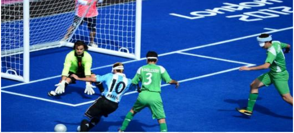
Şekil 2.8. Futbol 5-a- Side Paralimpik

Oynanma: Sadece erkek sporcuların mücadele ettiği bu oyunda dört oyuncu ve bir kaleciden oluşan beş kişilik iki takım karşılaşır. Golbol' de olduğu gibi top ses çıkararak oyuncuları yönlendirir. Saha çevresinde bulunan ribaund duvarı nedeni ile taç atışı yoktur ve oyun hiç durmadan devam eder. 5 faul yapan oyuncu ceza alır. Turnuva dörder takımdan oluşan iki grup şeklinde oynanır. Oyun 25 er dakikalık 2 yarıdan oluşur ( Olimpiik branşlar 2016).