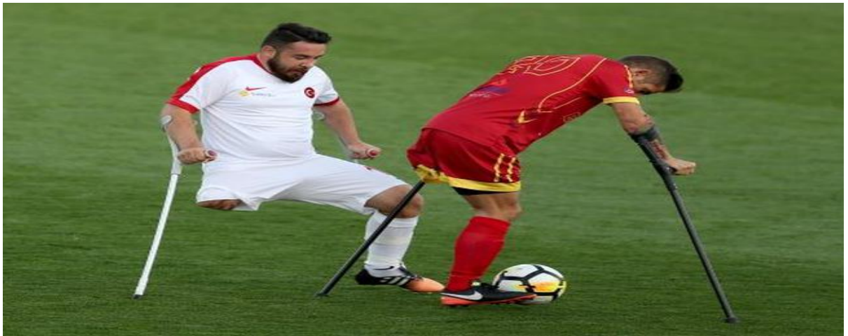
Şekil 2.14. Ampute Futbol

Şu an da Türkiye ampute futbol milli takım kaptanı bir terörle mücadele gazisidir.