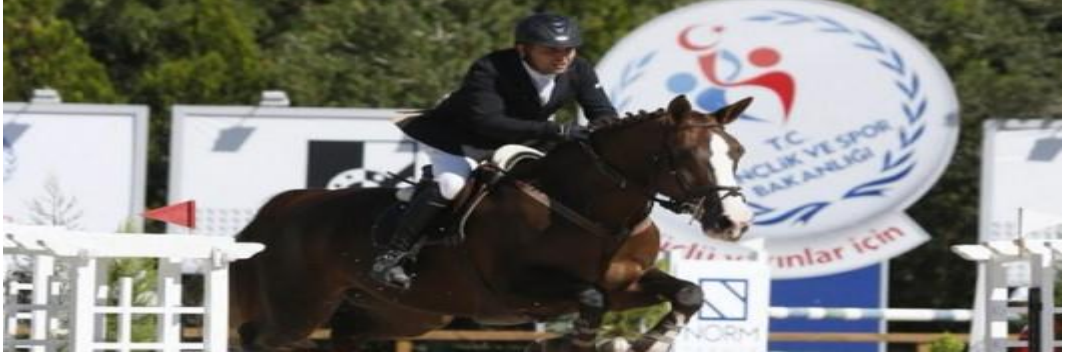
Şekil 2.4. Binicilik Paralimpik

Oynanma: Binicilikte paralimpik programda sadece dresaj yer alır. Dresajın iki çeşidi vardır. Önceden belirlenmiş hareketlerin yapıldığı yarışma ile sporcuların seçtiği müzik ve hareketlerle yapılan serbest stil yarışma. Burada her takımdan üç ya da dört kişinin performans sergilediği bir takım yarısı da olur. Yarışmalar, beş farklı sınıfta gerçekleştirilir. Bunlar sporcuların at üzerindeki hareketlerinin zorluğunu belirler (Olimpik branşlar 2016).