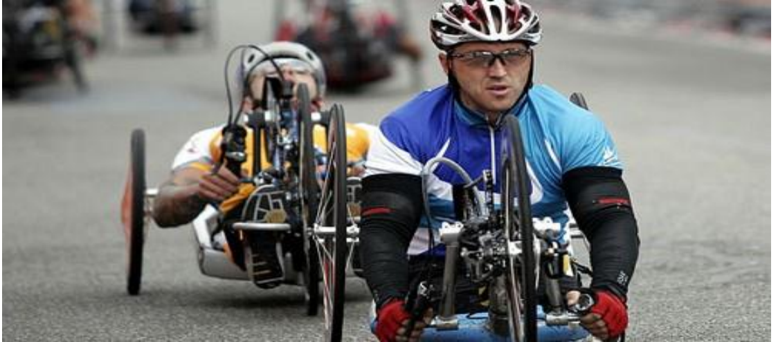
Şekil 2.5. Bisiklet Paralimpik

Oynanma: Yol ve pist yarışları yapılır. Zamana karşı ve takım yarışları vardır. Sporcular tandem bisiklet, el bisikleti, üç tekerlekli bisiklet ya da ihtiyaçlarına göre modifiye edilmiş bisiklet kullanarak 12 farklı klasmanda yarışır. Tandem bisiklet kullananlara, ön koltukta görebilen bir rehber eşlik eder. El bisikleti, tekerlekli sandalye kullanan; üç tekerlekli bisikletler ise denge sorunu yaşayan sporcular içindir (Olimpik branşlar 2016).