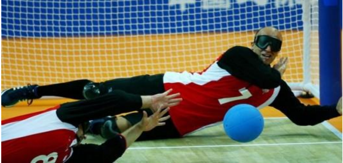
Şekil 2.9. Golbol Paralimpik

Oynanma: Golbol , görme engelli sporcular tarafından, içinde zil olan bir topa oynanır. Oyunun amacı, topu rakip kaleye isabet i şekilde atarak sayı kazanmaktır. Takımlar üçer kişiden oluşur. Maç esnasında takımın üç kez oyuncu değiştirme hakkı