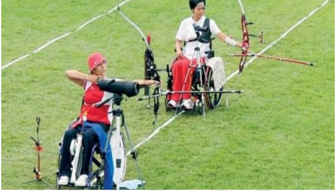
Şekil 2.15. Okçuluk Paralimpik

Oynanma: Okçuluğun amacı 10 adet iç içe geçmiş dairelerle belirlenmiş olan hedefe okları doğru olarak atmaktır. Dıştan merkeze doğru yaklaştıkça puanlama artar. En ortadaki dairenin sayısı değeri 10'dur, en dıştaki dairenin sayısı değeri ise birdir. Genel açık hava müsabakalarında hedef 30 mile 90 m arasında değişebilmektedir. Paralimpik oyunlarında ise 70 m olarak uygulanmaktadır (Olimpik branşlar 2016).