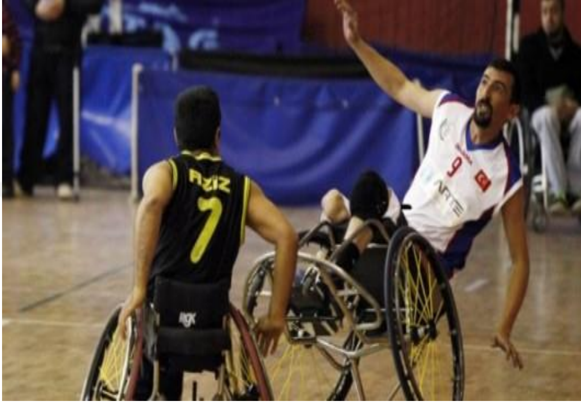
Şekil 2.13. Tekerlekli Sandalye Basketbol

Oynanma: Tekerlekli basketbolda takımların amacı rakibinin potasına sayı atmaktır. Ayrıca karşı takımın topa hâkim olmasına ve skor yapmasına da engel olunmalıdır. Karşılaşmalar beser kişilik 2 takım tarafından oynanır. Onar dakika süren toplam 4 periyodun sonunda ise maç tamamlanır ( Olimpiik branşlar 2016).