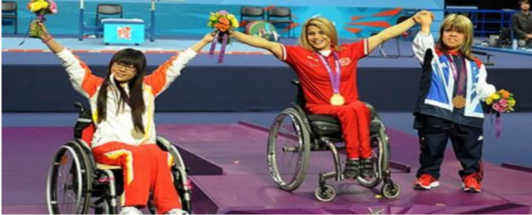
Şekil 2.3. Atletizm Paralimpik

Oynanma: Atletizm, paralimpik oyunlarının en önemli branşıdır. Parça yarışlarında sprint ( 100 m, 200 m, 400 m ) orta mesafe ( 800 m, 1500 m ) uzun mesafe (5.000 m, 10.000 m ) ve role yarışları ( 4×100 m, 4×400 m ) ; yol yarışlarında maraton; saha yarışlarında yüksek atlama, uzun atlama, üç adım atlama, disk, gülle atma, cirit; kombine yarışlarda ise pentatlon yer alır. Sporcular akustik sinyallerle yönlendirilir ve bu sinyaller sporcular atış alanındayken verilen keskin sinyallere göre değişir (Olimpik branşlar 2016).