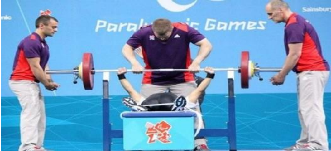
Şekil 2.17. Halter Paralimpik

Oynanma: Sporcular, kaldırış süresince kollarını 20 derecelik açıyla kaldırarak hareketi göstermelidir. Geçerli kaldırış için üç hakemden en az ikisinin onayını almak gerekir. Toplamda tic hakları bulunan sporcular, barı kollarıyla kaldırıp hakemlerin sinyaline kadar hareketi göstermek zorundadır. Sporcular, değişik engellere sahip