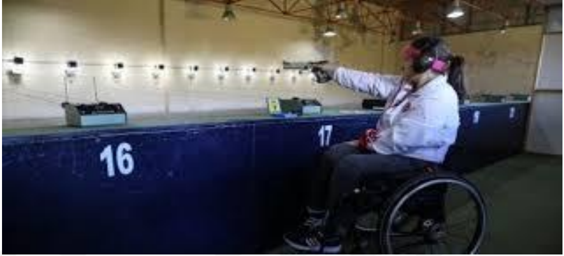
Şekil 2.16. Atıcılık Paralimpik

Oynanma: Atıcılık müsabakaları iki ana başlıkta toplanır. Üç mesafeden oluşan havalı tüfek ve tabanca yarışmalarıdır. ( 10 m, 25 m, 50 m ) Kurallar silaha, mesafeye, hedefe, atış pozisyonuna, atış sayısına ve zaman sınırına bağlıdır. Sporcular, atış değerlerine göre puan biriktirirler. Her bir yarışma, bir sıralama ve final bölümünden oluşur. Finaldeki skor, sıralama bölümünde elde edilen skorun üstüne eklenir. En yüksek puanı alan yarışmayı kazanır (Olimpik branşlar 2016).