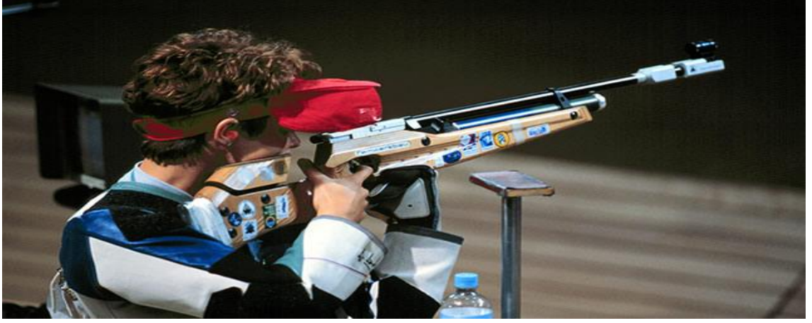
Şekil 2.2. Atıcılık Paralimpik

Oynanma: Atıcılık müsabakaları iki ana başlıkta toplanır. Üç mesafeden oluşan havalı tüfek ve tabanca yarışmalarıdır. ( 10 m, 25 m, 50 m ) Kurallar silaha, mesafeye, hedefe, atış pozisyonuna, atış sayısına ve zaman sınırına bağlıdır. Sporcular, atış değerlerine göre puan biriktirirler. Her bir yarışma, bir sıralama ve final bölümünden oluşur. Finaldeki skor, sıralama bölümünde elde edilen skorun üstüne eklenir. En yüksek puanı alan yarışmayı kazanır (Olimpik branşlar 2016).