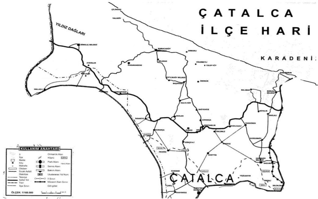
Şekil 1: Çatalca İlçe Haritası