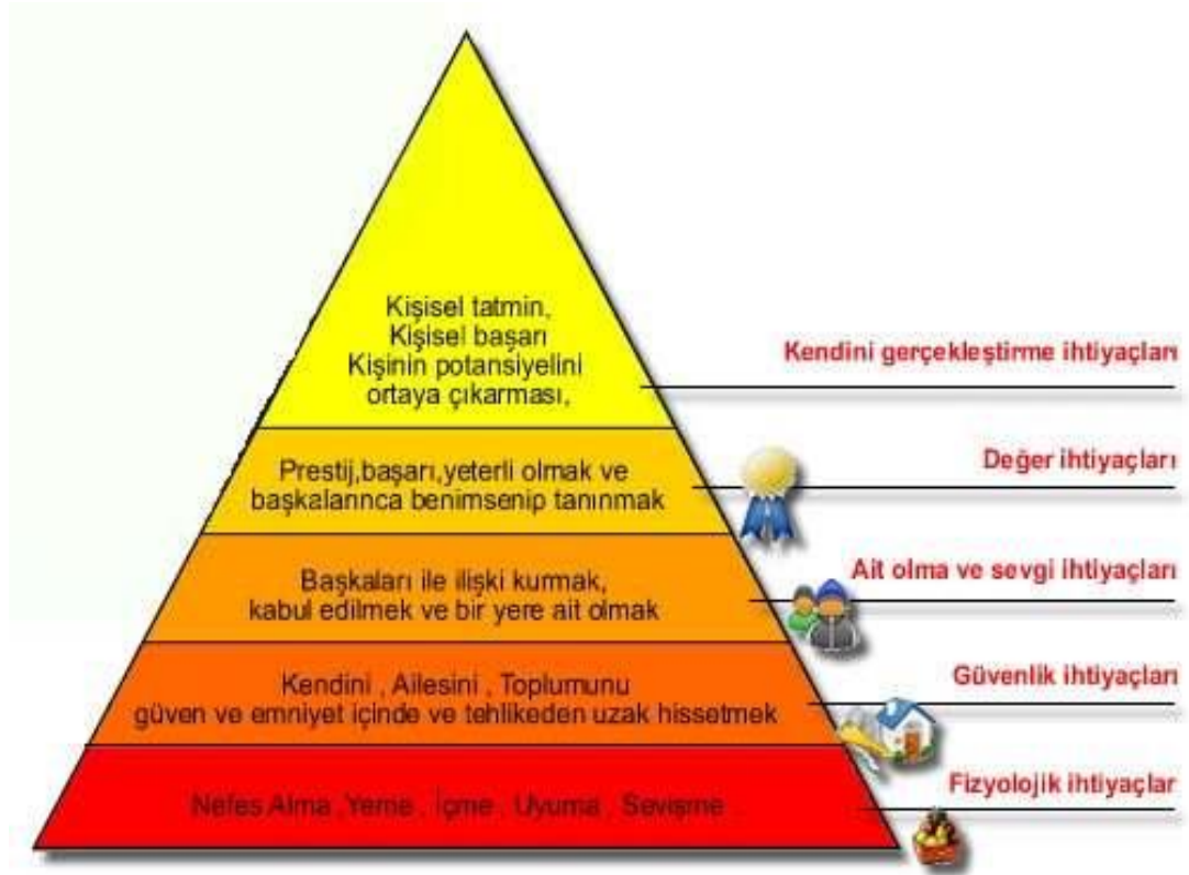
Şekil 2.2: Maslow'un Gereksinimler Sıradüzeni

Maslow, bir kişinin %85 ile en yüksek oranda fizyolojik gereksinimlerinin, ikinci sırada güvenlik gereksinimlerinin %70'ini, ait olma gereksinimlerinin %50'sini, özsaygı gereksinimlerinin %40'ını ve en az kendini gerçekleştirme gereksinimlerinin %10'unu tatmin etmiş olabileceği görüşünü savunmaktadır.