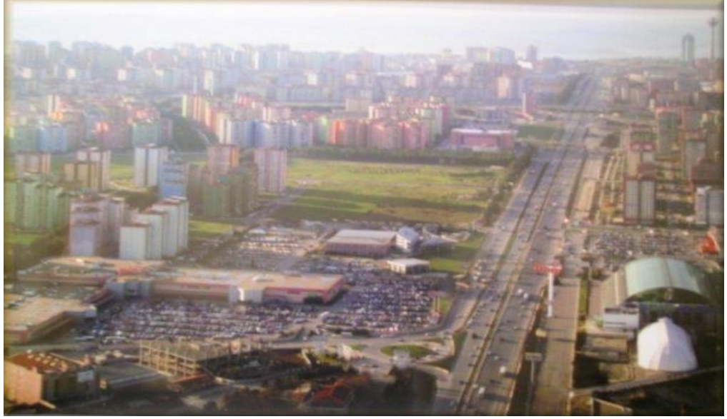
Resim 2: Beylikdüzü İlçesi Görünüm