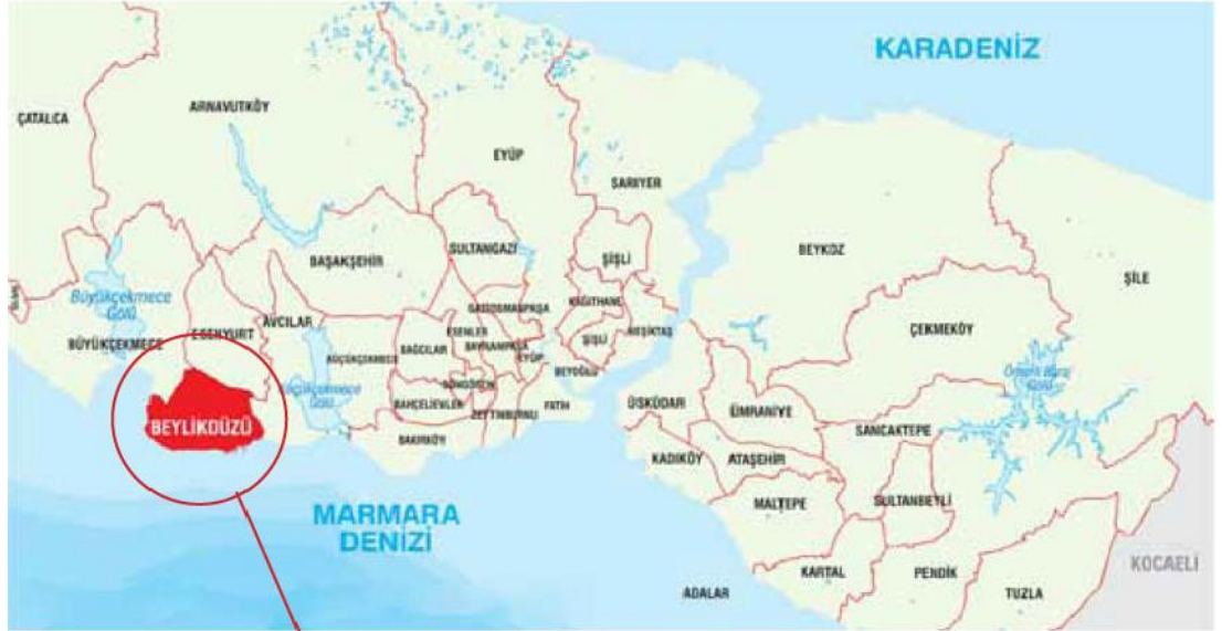
Resim 1: Beylikdüzü İlçesi İstanbul'daki Konumu ( http://beylikduzu.bel.tr ).

Beylikdüzü'nün yüzölçümü 11.162 km 2 ve nüfusu 229,115'dir (TİK, 2012). Marmara depreminden sonra İstanbul'un ve Marmara bölgesinin çeşitli bölümlerinde evleri yıkılan veya ağır derecede hasar görmüş olan mağdur vatandaşların Beylikdüzü ilçesine yönelmesi ile Beylikdüzü ilçesinin nüfusu artmıştır. İstanbul'un merkezine uzak olan Beylikdüzü ilçesi son zamanlardaki ulaşımın kolaylığı ve rahatlığı ile tamamen tercih edilen daha çok yaşanabilir bir merkez konumuna yükselmiştir. Marmara depreminden sonra gelen göç dalgası ve sonrası ulaşım ağının genişlemesi ve daha hızlı olması ile ikinci bir göç dalgası oluşarak günümüz nüfusuna kavuşmuştur.