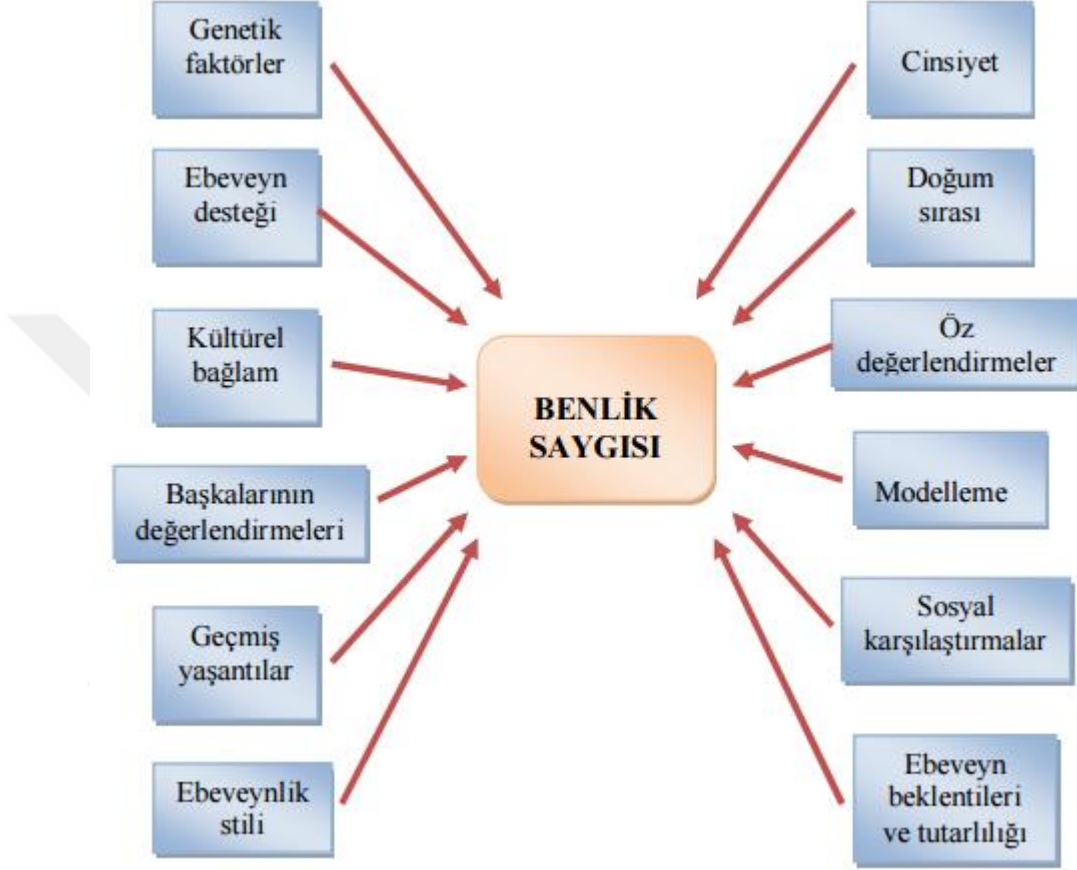
Şekil 2.1: Benlik Saygısını Etkileyen Faktörler (Tunç, 2011).

Şekil 2.1’ de gösterildiği gibi benlik saygısını etkileyen birçok etmen bulunmaktadır. Bunların yanında benlik saygısının gelişiminde kalıtımın da çevrenin de etkisinden bahsedebiliriz. Kalıtım ve çevreden hangisinin insan gelişiminde daha önemli olduğu sorusuna kesin bir cevap vermek mümkün değildir. Gelişimin bazı alanlarında kalıtım, bazı alanlarında ise çevre daha etkilidir. Bir çocuğun fiziksel özelliklerinin belirlenmesinde kalıtımın; dil gelişimi, kişilik özellikleri, yetiştirme tarzı gibi konularda çevrenin rolü daha fazladır(Selçuk, 2004).