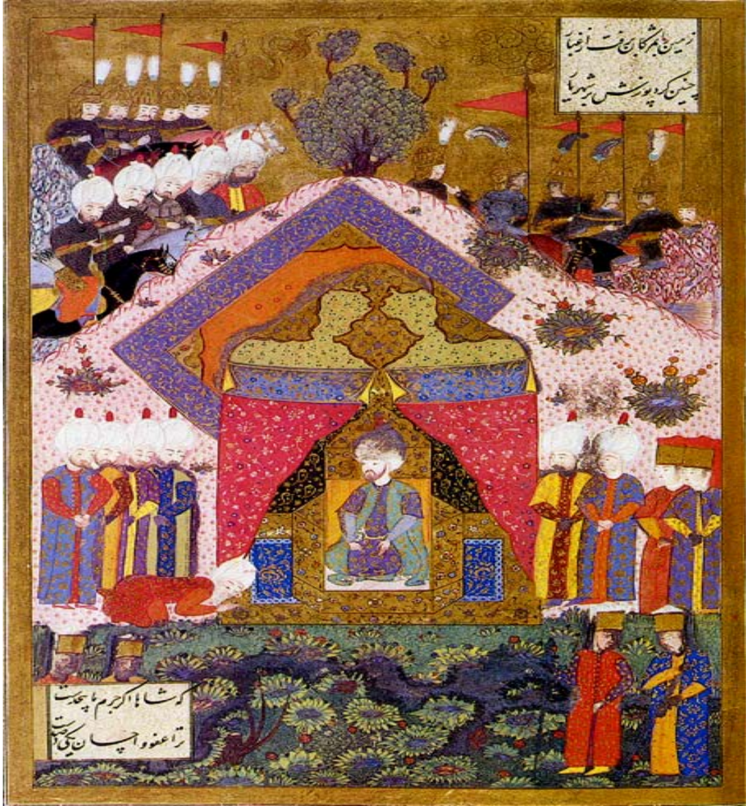
Şekil 3.3: 1. Süleyman, yabancı elçiyi kabul ederken, Süleymanname- Matrakçı Nasuh