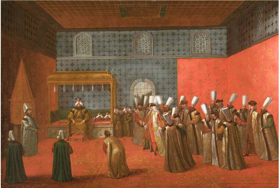
Şekil 3.2: Sultan 3. Ahmet Hollanda elçisi Cornelis Calkoen'i Topkapı Sarayı'nda kabul ederken, 1727. Eser: Jean Baptiste Vanmour, 1727

Fatih Sultan Mehmet döneminde, 1454 senesinde Venedikliler İstanbul'da ilk kalıcı elçiliği kurmuşlardır (Aslan, 2011:6). Osmanlı sarayında kurulan Teşrifat-ı Divan-ı Hümayun (Protokol Dairesi) Tanzimat'la birlikte Teşrifat Nazırlığı (Protokol Bakanlığı)'na dönüşmüştür. Şuanda bile Birleşmiş Milletler ile Avrupa Konseyinin protokol müdürlüklerini Türk diplomatik görevlileri yapmaktadır (Aytürk, 2012:6).