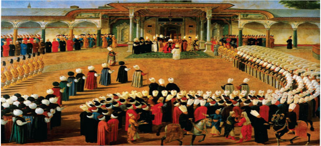
Şekil 3.1: Osmanlı Devletinde Teşrifat

Kaynak: http://www.gencdoku.com/osmanli-devletinde-tesrifat-ve-alkislar-1158.html