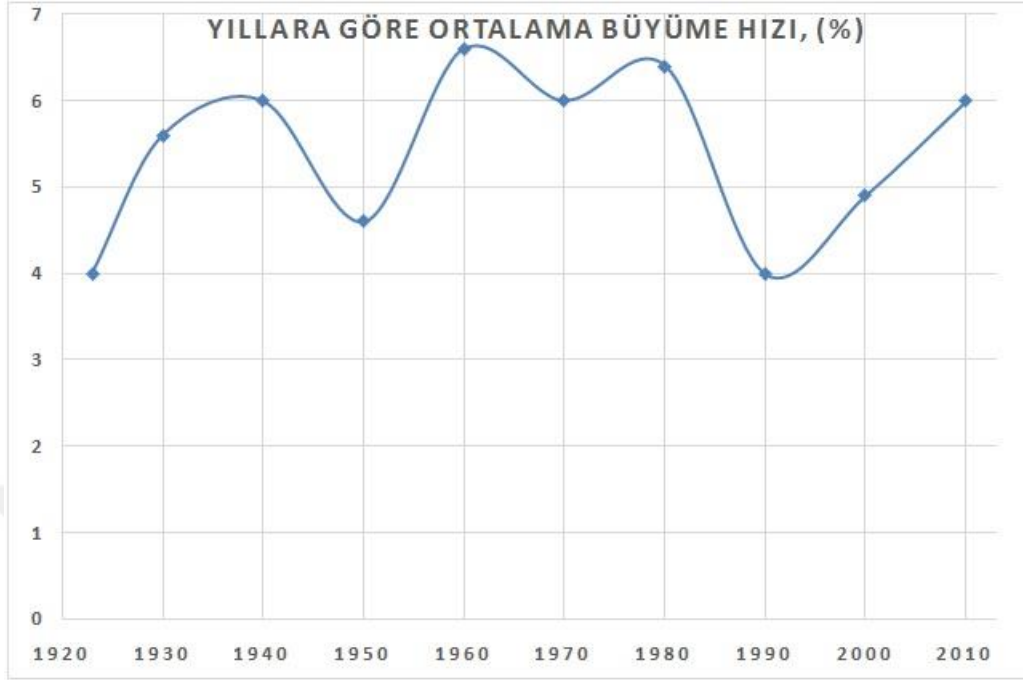
Şekil 2.1: 1923-2010 Yılları Arası Büyüme Hızı Grafiği

Şekil 2.1 1923-2010 yılları arasında, onar yıllık dönemler halinde Türkiye'nin büyüme hızı seyrini göstermektedir.