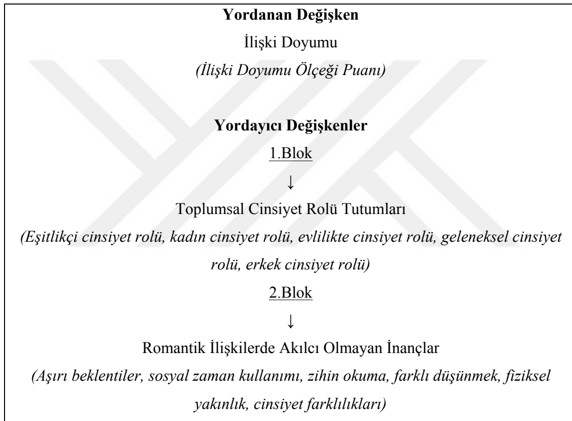
Tablo 3.2.2. İlişki Doyumunu Yordayan Değişkenlere İlişkin Hiyerarşik Regresyon Analizi Aşamaları

Bu aşamada ilişki doyumunu yordayan değişkenleri belirlemek amacıyla hiyerarşik regresyon analizi yapılmıştır. Bu amaçla, sırasıyla Toplumsal Cinsiyet Roller Tutum Ölçeği'nin alt boyutları olan eşitlikçi cinsiyet rolü, kadın cinsiyet rolü, evlilikte cinsiyet rolü, geleneksel cinsiyet rolü ve erkek cinsiyet rolü ile Romantik İlişkilerde Akılcı Olmayan İnançlar Ölçeği'nin alt boyutları olan aşırı beklentiler, sosyal zaman kullanımı, zihin okuma, farklı düşünmek, fiziksel yakınlık ve cinsiyet farklılıkları yordayıcı değişkenler olarak analize alınmıştır. Hiyerarşik regresyon analizinin aşamaları Tablo 3.2.2.'de verilmiştir.