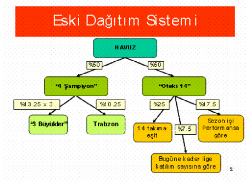
Figür 1- Eski Dağıtım Sistemi (Akşar, 2005)

Bu sistem 2005 yılının temmuz ayına kadar bu şekilde işledi. Temmuz ayı içerisinde Futbol Federasyonu'nun yeni dağılım modelini kamuoyuna