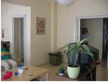
Salon foto 1

Teraslı ev arayışımız sonunda, aynı terasa açılan evi kullanmaya karar verdik. Emlakçılardan çekim için boş ev bulmaya muvaffak olamadık çünkü gittiğimiz emlakçıların hepsi bu fikirle ilk defa karşılaşılıyor, evleri bize iki hafta sonu (4 gün) süreyle kira karşılığı vermeyi sürekli reddediyorlardı. Sonunda, hem pratik bir çözüm olacağı hem de zaman açısından çok faydalı olacağını düşünerek içi eşyalarla dolu olmasına rağmen, terasa açılan evi kullanmaya karar verdik. Boşaltıldığında son derece aydınlık, ışıklı ve ferah bir yer olacağı belliydi. Bir odayı deneme mahiyetinde boşaltıp eşyasız haliyle deneme çekimi yapınca, uygun olduğuna karar verdik. Evin sahipleri evlerini ve teraslarını iki hafta sonu boyunca çekimler için bize teslim etmeyi kabul edince, lokasyon sorunumuz büyük ölçüde çözülmüş oldu çünkü hikâye zaten ağırlıklı bu iki ana mekânda geçecekti.