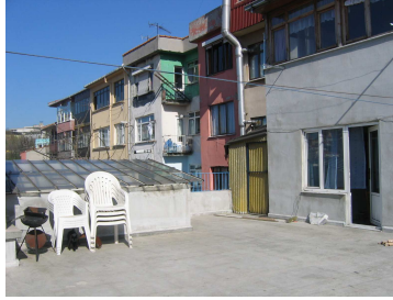
Teras foto 5