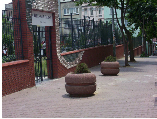
SAHNE 2. DIŞ – GÜNDÜZ – CADDE (buluşma noktası)