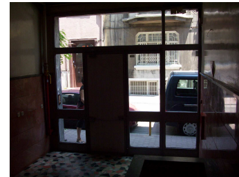
Cihangir foto 6