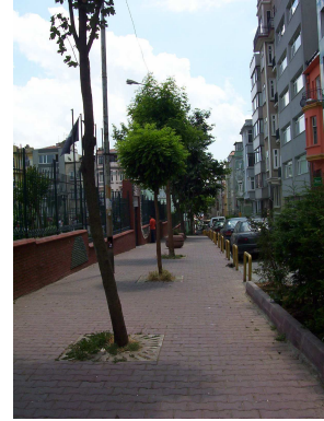
Cihangir foto 3