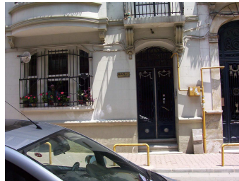
Cihangir foto 5