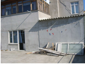
Teras foto 4