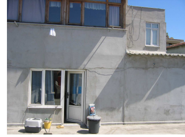
Teras foto 3