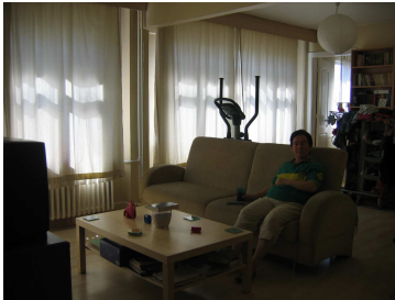
Salon foto 4