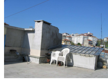
Teras foto 6

Başlangıçta terası çekimlere uygun bir renge boyama projesi vardı, fakat deneme çekimlerinde terasın badanasız, çimento halinin kamerada iyi resim verdiği ve üzerindeki her rengi ön plana çıkardığı anlaşıldı ve olduğu gibi bırakma kararı alındı. Mekân temizlendi, boşaltıldı ve çekimler için hazırlandı. Tüm gün ışık alan, öğle saatlerinde tam güneş altında kalan bir mekân olduğundan, ancak sabah erken saatlerde ve akşamüstü