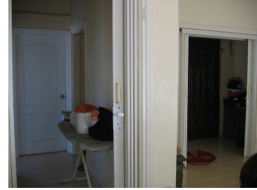
Salon foto 3