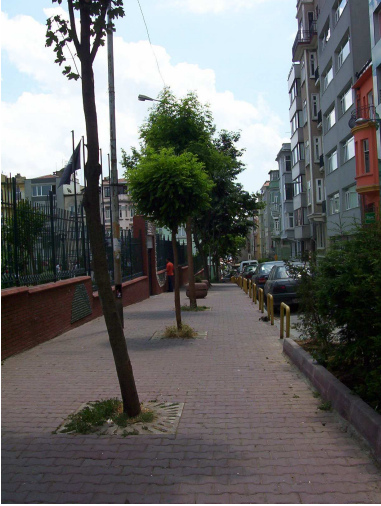
SAHNE 2. DIŞ – GÜNDÜZ – CADDE