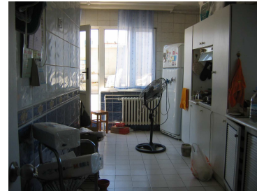
Salon foto 6