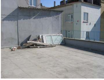
Teras foto 1

Mekân seçimi, özellikle uygun terası bulmak çok önemliydi. Hikâyeyi yazarken aklımda uygun teras vardı, fakat bir apartman çatısındaki teras tüm apartman sakinlerinin kullanımında olduğu için onu iki hafta sonu üst üste kullanıma kapatmak mümkün olmadı. Daha rahat çalışabilelim ve istediğimiz gibi kullanabilelim diye, bir tanıdığımın terasında karar kıldık.