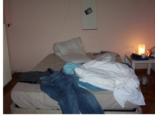
SAHNE 1. İÇ – GECE – YATAK ODASI