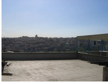
Teras foto 2