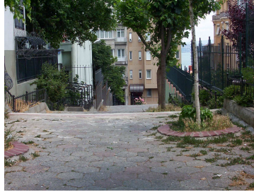
Cihangir foto 2