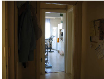
Salon foto 5