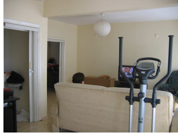
Salon foto 2