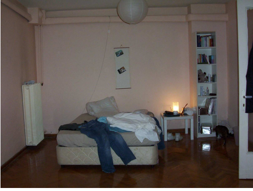
SAHNE 1. İÇ – GECE – YATAK ODASI