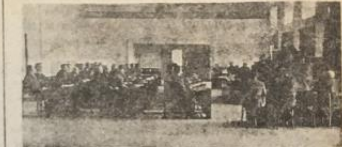
Umumi Meclis toplantı halinde

Vilâyet matbaası, İvindiye panayır açılması ve Gâbel mektebine yardım edilmesi gibi işler üzerinde görüşüldü.