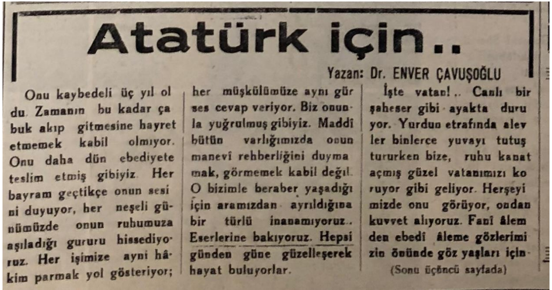
Şekil 8. Atatürk İçin Fıkрасının Orijinal Hâli