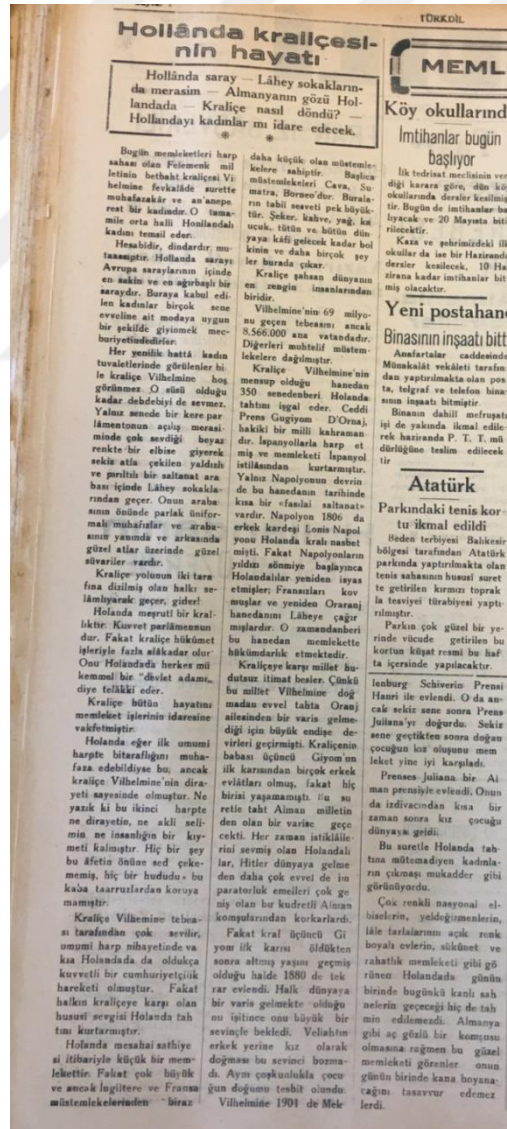
Şekil 16. Hollanda Kraliçesinin Hayatı Biyografisinin Orijinal Hâli

Çok renkli nasyonel elbiselerin, yeldeğirmenlerin, lâle tarlalarının açık renk boyalı evlerin, sükûnet ve rahatlık memleketi gibi görünen Holanda da günün birinde bugünkü kanlı sahnelerin geçeceği hiç tahmin edilemezdi. Almanya gibi aç gözlü bir komşusu olmasına rağmen bu güzel memleketi görenler onun günün birinde kana boyanacağını tasavvur edemezlerdi. İmzasız”