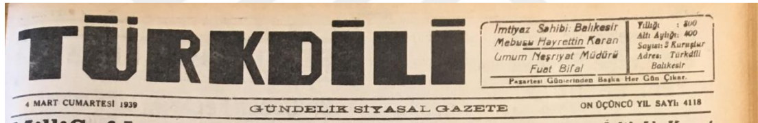
Şekil 1. Türk Dili Gazetesinin 1939 Klišesi