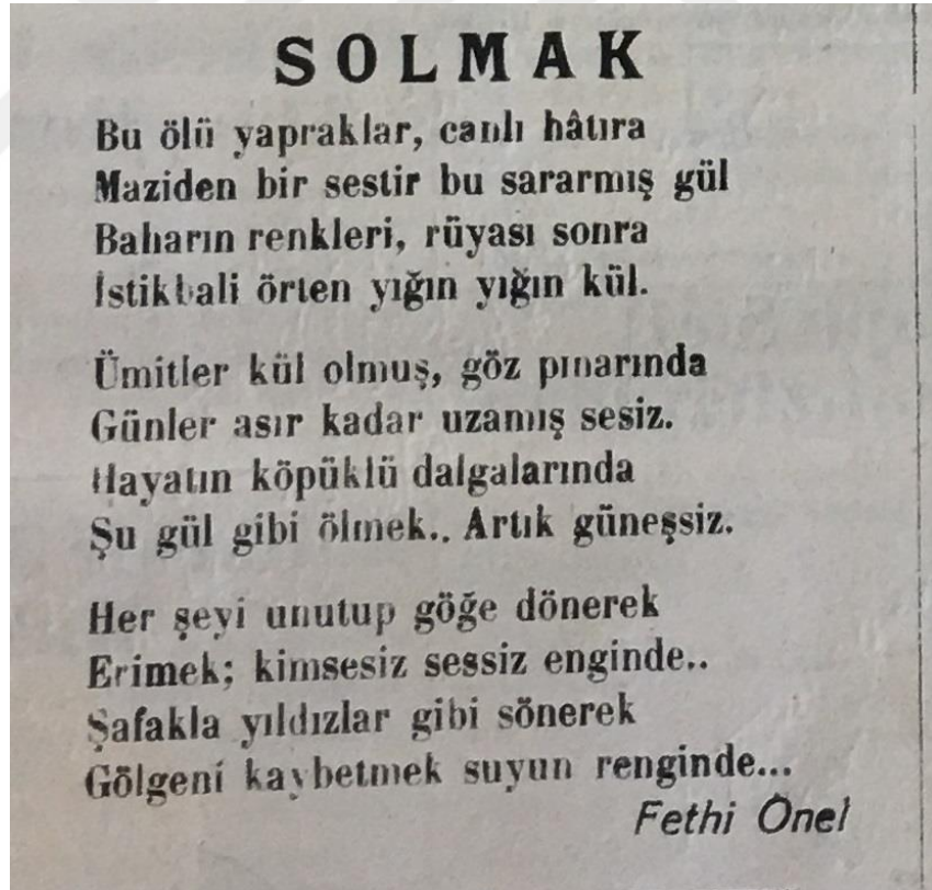
Şekil 4. Solmak Şiirinin Orijinal Hâli