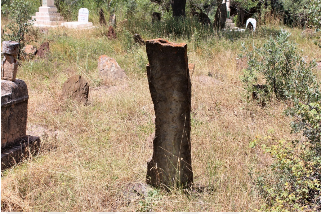
Fotoğraf 11. Bolucan K y  Mezarlıđı eski d z mezar taşları.