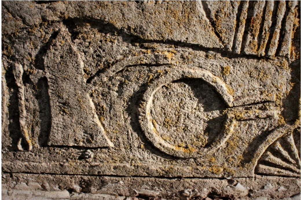
Şekil 9.11: 19 numaralı mezar taşı üzerinde bulunan ibrik ve tas sembolü.

Bolucan Köyü mezarlığında bulunan mezar taşlarının pek çoğunda gündelik olarak kullanılan eşyalar ve çeşitli araç gereçlerin sembol olarak taşlara kazındığı görülmektedir. Mezar taşlarının üzerinde genelde köyde yaşayan insanların sıklıkla kullandığı, ibrik, cezve, tarak, tas, murç gibi motifler sıklıkla yer almıştır. Fotoğraflanan 34 mezarın 11 tanesinde gündelik eşyalar ve araç gereçlerin kullanıldığı görülmüştür. Bu sembollerin çoğunluğu ibrik, tas, leğen gibi su ile alakalı olan eşyalardan oluşmaktadır. Adil Kaya'ya göre mezarlarda kullanılan bu semboller temizlenmeyi göstermektedir. Köyde yaşayan insanlar temizlenmek için bu araçları kullanmışlardır. İnanç gereği bu motifler mezarlara yansıtılmıştır (Röportaj 3).