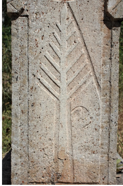
Şekil 9.8: Nazife Ergün' e ait 5 numaralı mezar taşı üzerinde bulunan ağaç motifi.