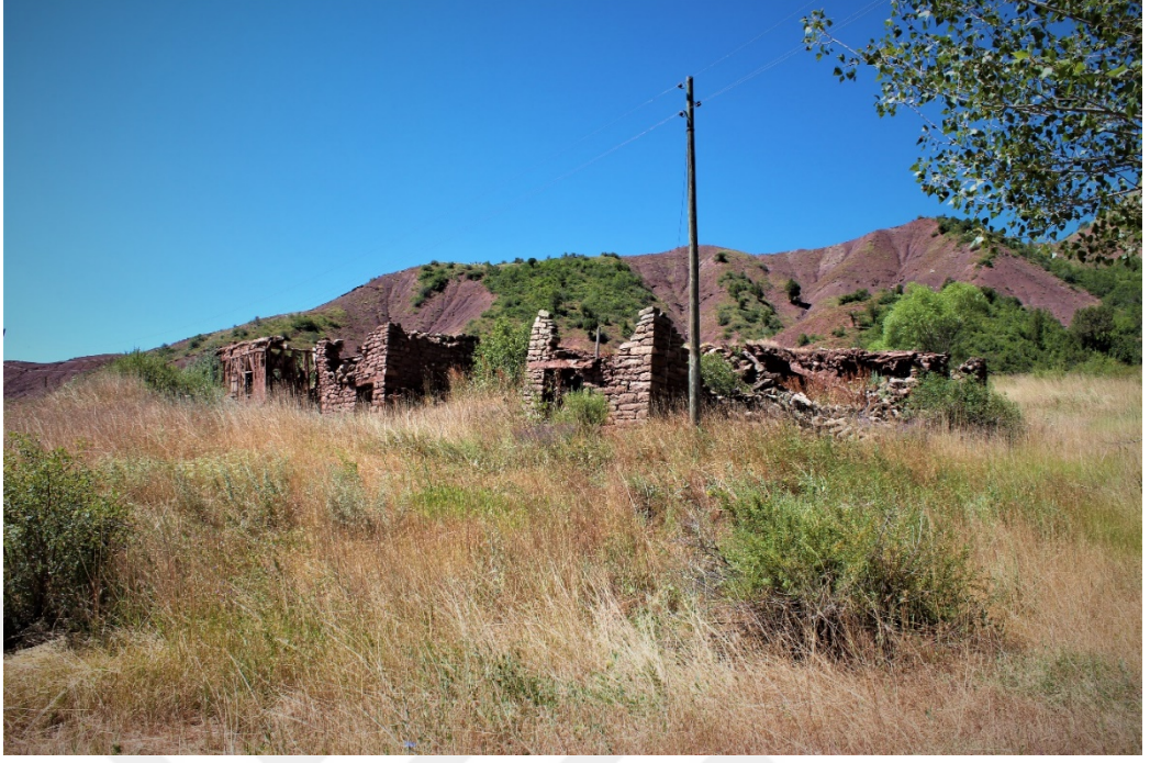
Fotoğraf 1. Bolucan Köyü Eski Evleri.