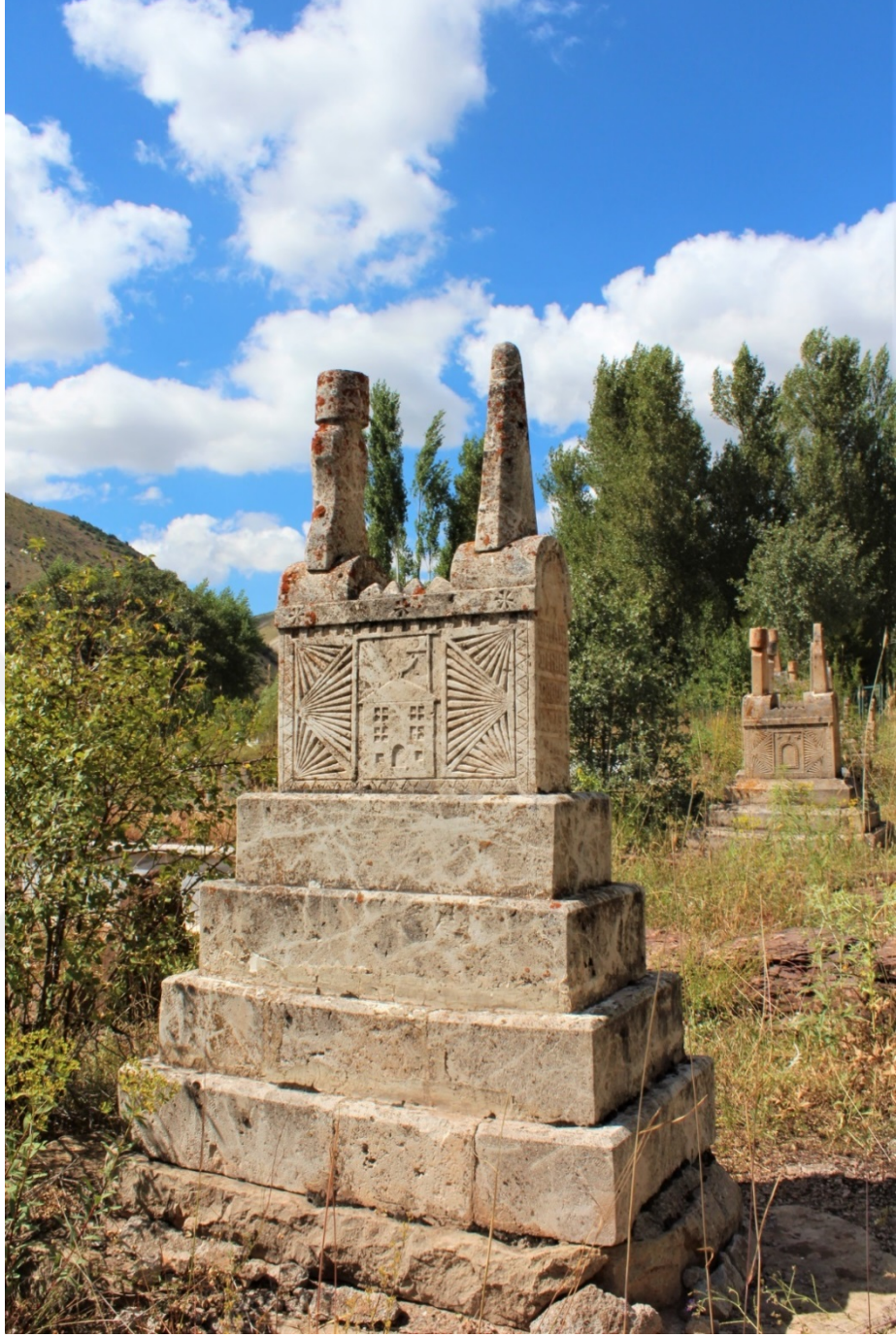
Fotoğraf 3. Gül Ali Demir'e ait 16 numaralı mezar.