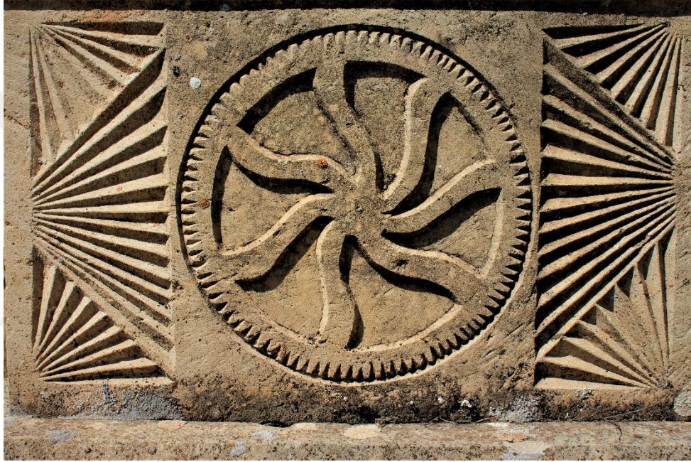
Şekil 9.10: Ali Karataş'a ait 2 numaralı mezar taşı üzerinde bulunan çark sembolü.