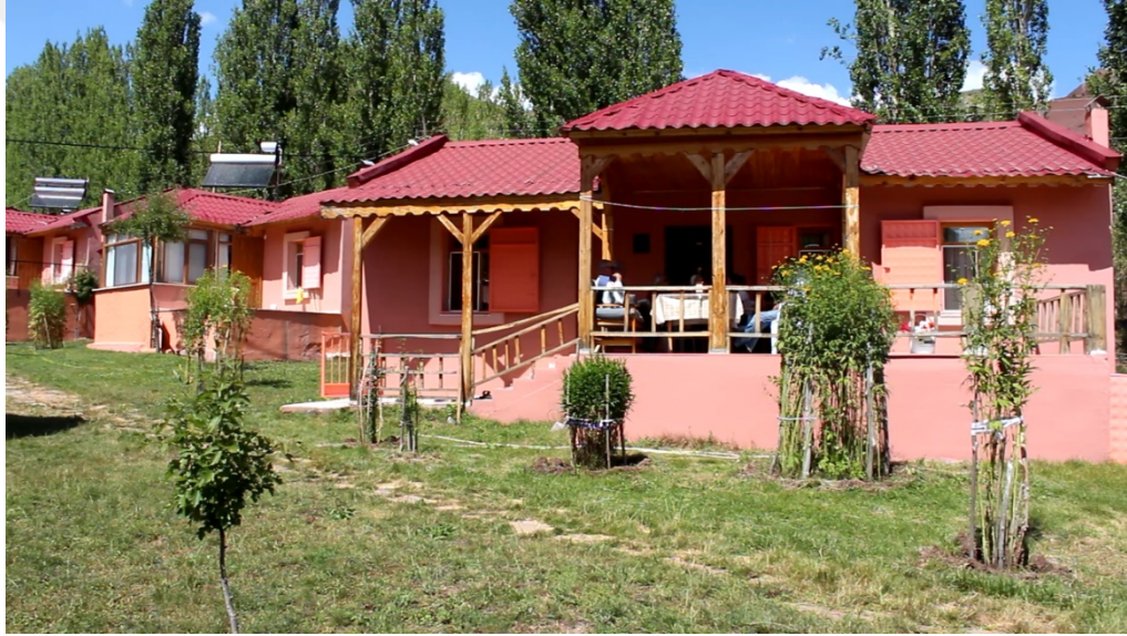
Şekil 8.2: Bolucan Köyü evleri.