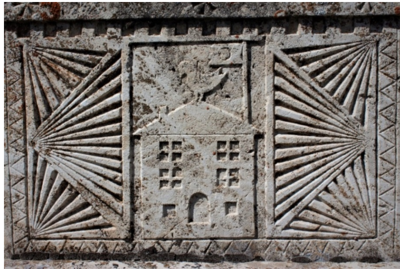
Şekil 9.2: Hamdi Kaya'nın mezarı üzerinde bulunan bina çatısındaki kuş sembolü.