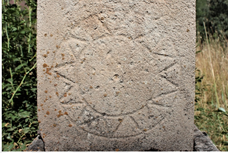
Şekil 9.6: 10 numaralı mezar taşı üzerinde bulunan güneş sembolü.