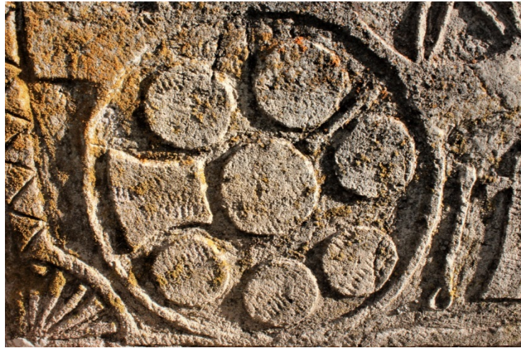
Şekil 9.7: 19 numaralı mezar taşı üzerinde bulunan sofrâ sembolü.