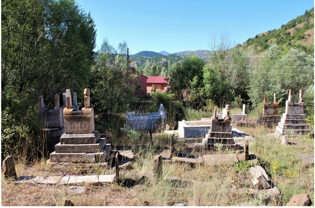
Şekil 5.1: Bolucan Köyü Mezarlığı.