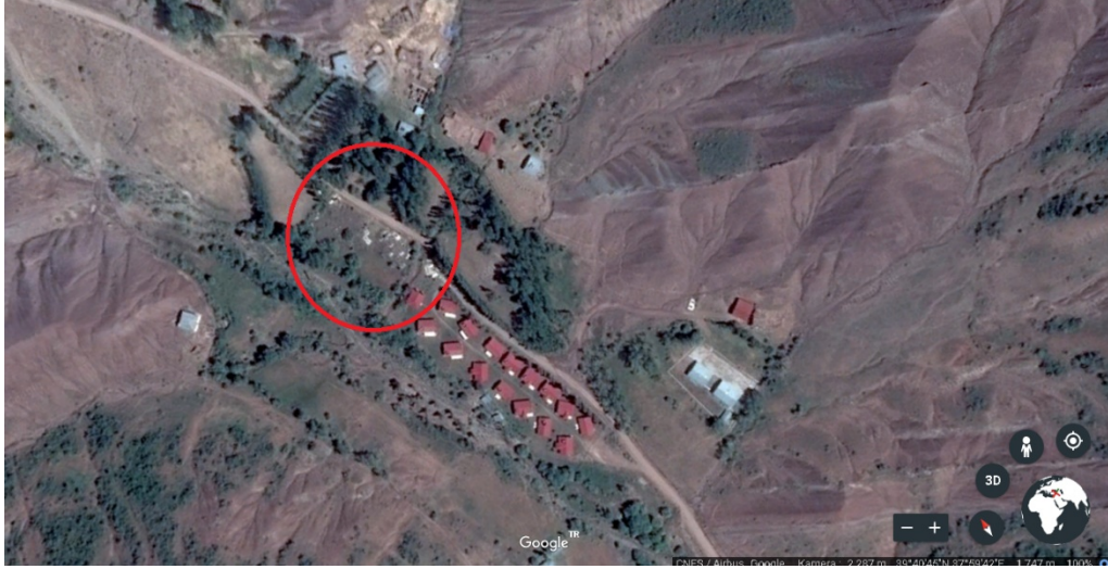
Şekil 8.1: Bolucan Köyü Google Earth uydu görüntüsü. (Yuvarlak içerisinde alınan alanda Bolucan Köyü Mezarlığı)