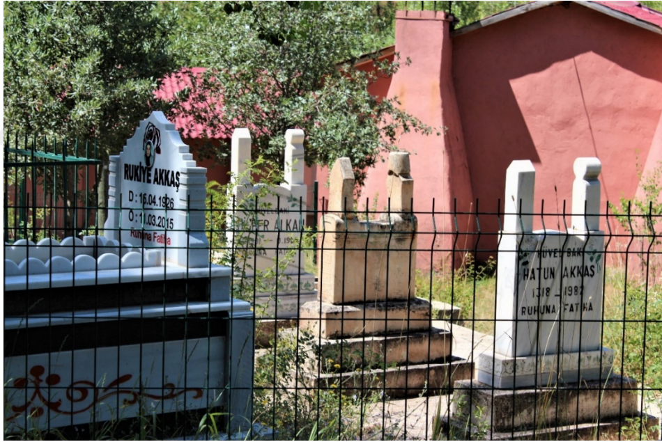
Fotoğraf 5. Kilitli alanda bulunan mezar taşı.