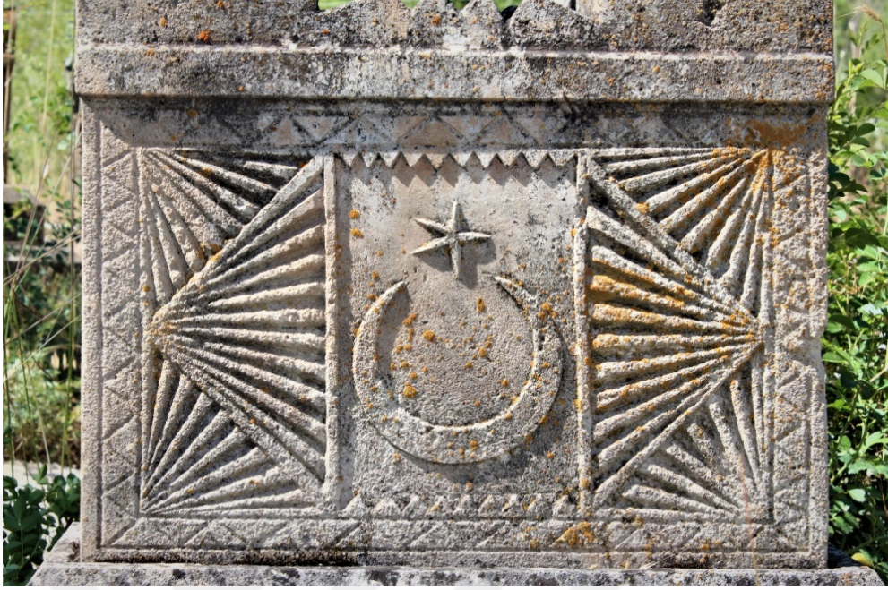
Şekil 9.12: 10 numaralı mezar taşında bulunan ay ve yıldız sembolü.