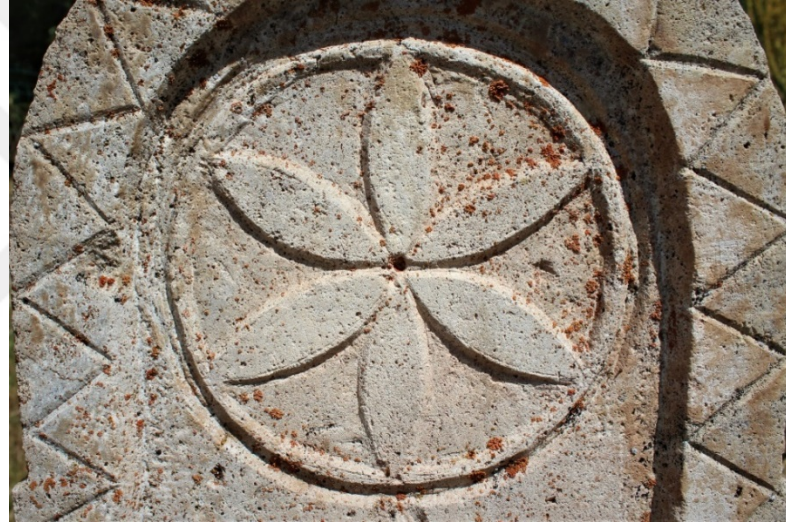
Şekil 9.5: Nazife Ergün'e ait 5 numaralı mezar taşı üzerinde bulunan 6 yapraklı çiçek motifi.