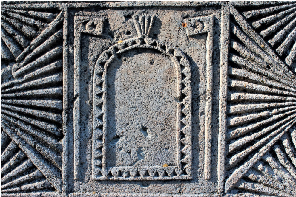
Şekil 9.13: Mehmet Ali Oğlu Hasan'a ait 8 numaralı mezar üzerinde bulunan bayraklı kapı sembolü.