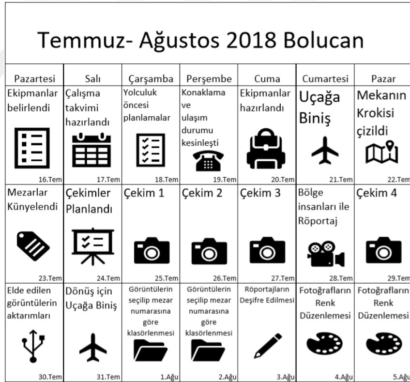
Şekil 5.3: Bolucan Köyü Çekim Takvimi