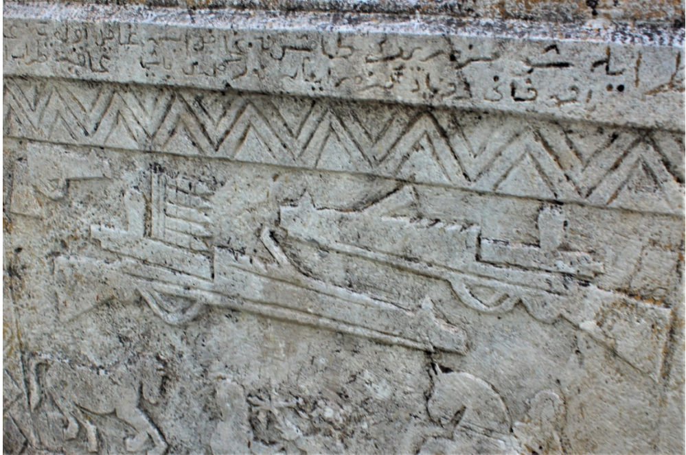
Şekil 9.9: Adil Kaya'ya ait 19 numaralı mezar taşı üzerinde bulunan silah sembolleri.