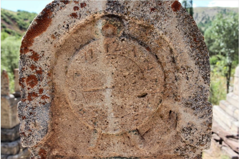
Şekil 9.3: Hamdi Kaya'ya ait mezar taşı üzerinde bulunan saat sembolü.