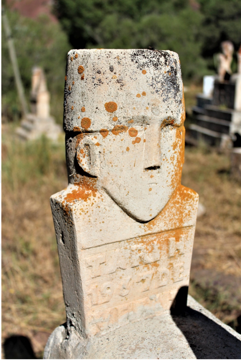
Fotoğraf 6. 3 numaralı mezar taşının balbalı. (Fotoğraf, Burak Kaya 2018)