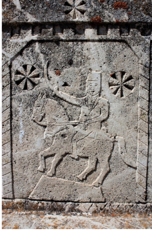
Şekil 9.4: Hamdi Kaya'ya ait mezar taşı üzerinde bulunan at üzerinde kılıçlı adam sembolü.