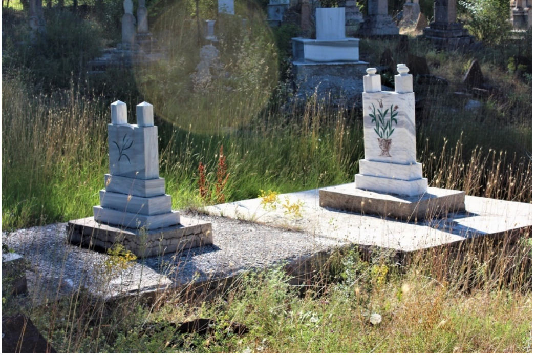
Fotoğraf 2. Bolucan Köyü Yeni Mezarları.