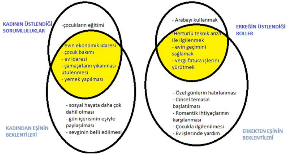
Şekil 2.1: Geleneksel Evliliklerde Beklentiler ve Üstlenilen Roller