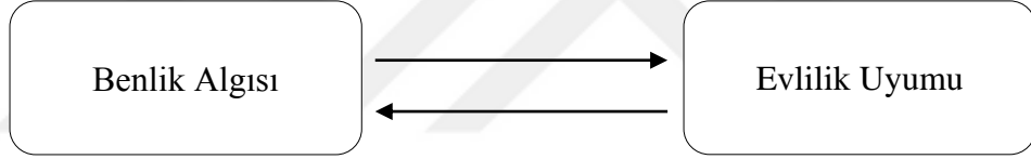
Şekil 3.1: Araştırmanın Modeli

Bu araştırmanın modeli Şekil 3'te verilmiştir.