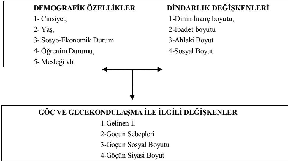
Şekil 1: Değişkenler arası ilişkiler

Değişkenler açısından bakıldığında, konunun tasvirinde, demografik özellikler ile göç, gecekondulaşma ve dindarlık boyutları arasındaki ilişki incelenecektir. Dolayısıyla bu araştırmada değişkenler arasında önerilen ilişkiler modeli şematik olarak aşağıdaki gibi gösterilebilir.