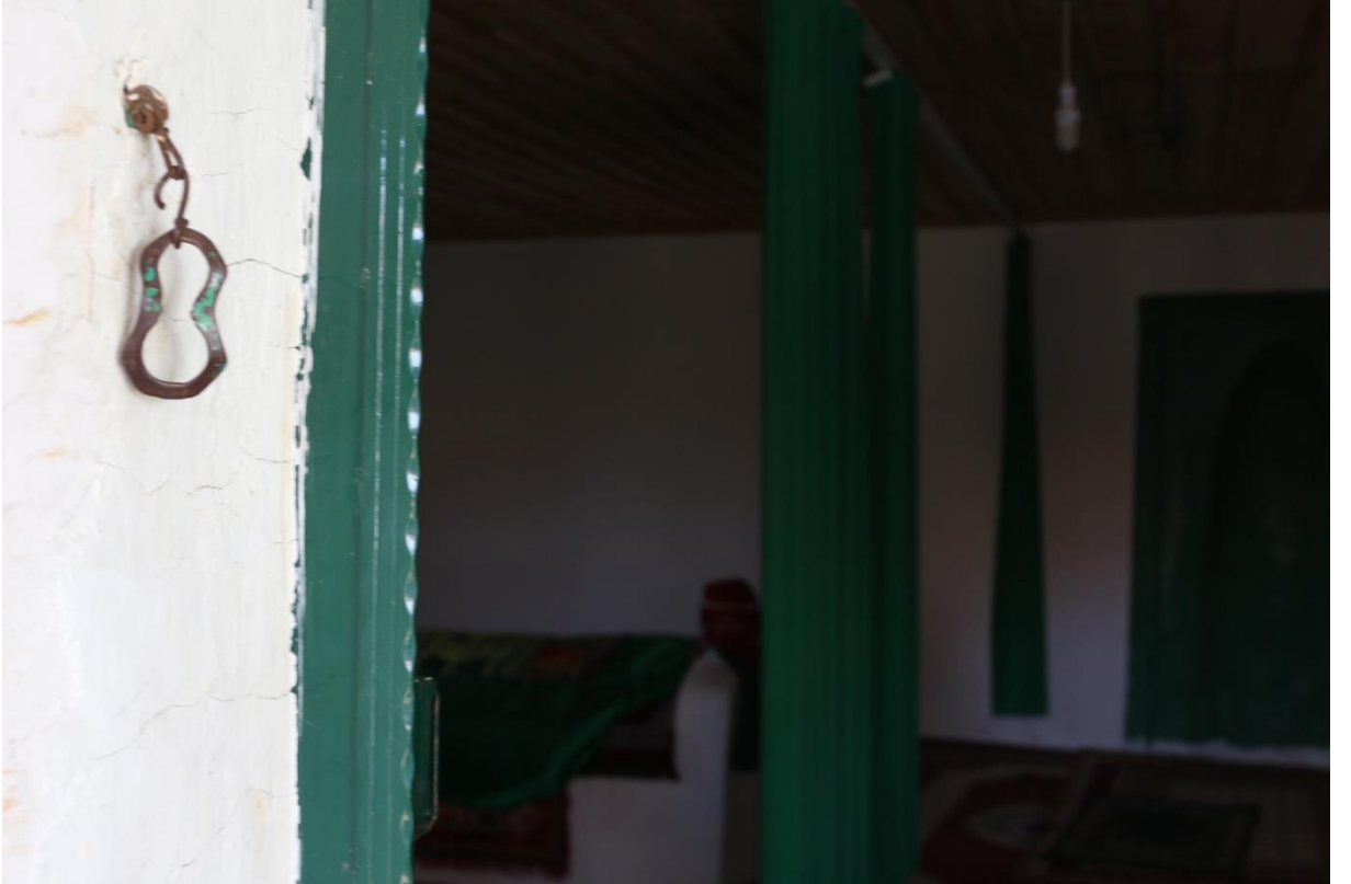
Fotoğraf 9. Mecitözü Şihlar Dede giriş kapısındaki şifalı olduğuna inanılan kilit halkası