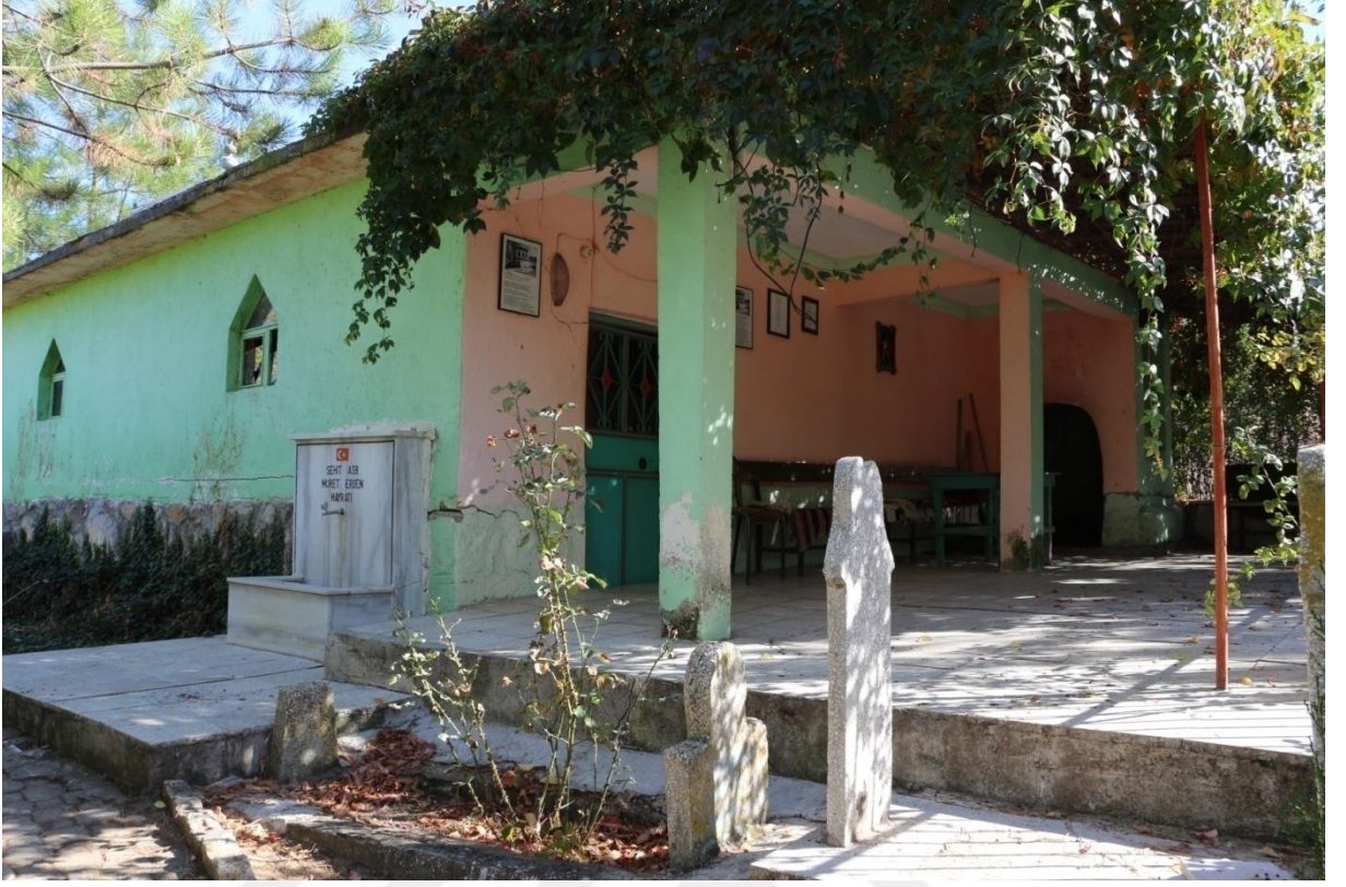
Fotoğraf 24. Köseeyüp Köyü Haydar sultan türbesi dıştan görünümü.