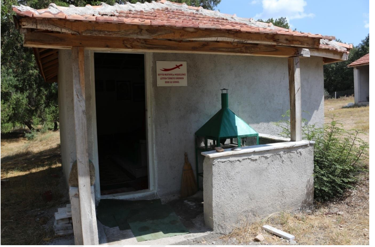
Fotoğraf 16. Kargı Köyü Erenler dede türbe girişi ve mum yakma yeri.