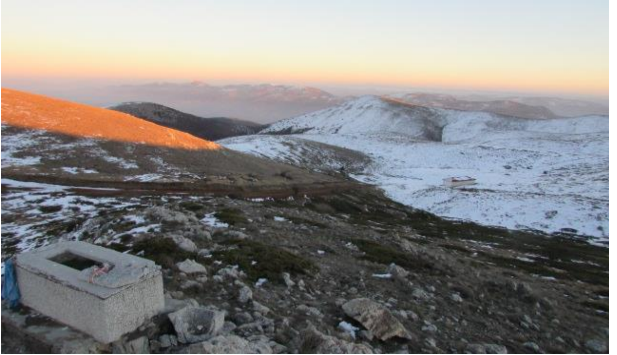
Fotoğraf 15. Kırklar dađı yatırlarından bir diđer mezar yeri ve sađ tarafta adak ve yemek iřleri iin kullanılan tesisin uzaktan grnm.