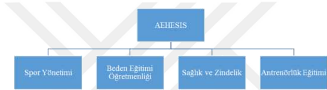
Şekil 2. Avrupa Yükseköğretiminde Spor Alanları ( Deveciođlu vd., 2011)

Avrupa Birliđi'nde yükseköğretim düzeyinde spor eğitimi düzenlemelerine bakılırsa, Spor Bilimleri Eğitimi Avrupa Ortak Müfredatı (AEHESIS) 2001 yılında Prag'da Bologna sürecini değerlendiren Avrupa Birliđi ÷lke bakanları, yükseköğretimde ulaşılan Avrupa boyutunun öğrenci ve akademisyen deđişiminin artırılarak daha da geliştirilmesi gerektiđini vurgulamışlardır. Bologna süreci bağlamında spor bilimleri eğitiminin Avrupa çapında uyumlu hâle getirilmesi amacıyla, 2003 yılında Erasmus Tematik Ađı (AEHESIS) adlı program yürürlüğe konulmuştur (bkz. Şekil 2). Bu projede spor ile ilişkili dört alan olarak “Spor Yönetimi”, “Beden Eğitimi Öğretmenliđi”, “Sađlık ve Zindelik” ile “Antrenörlük Eğitimi” tanımlanmıştır (Deveciođlu vd. 2011).