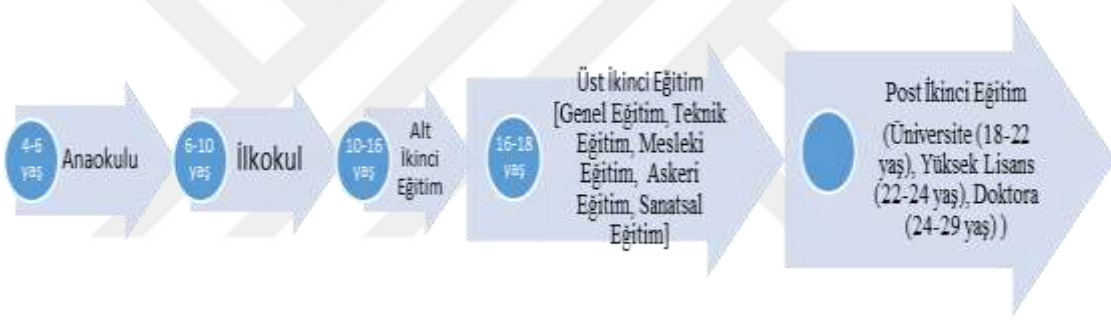
Şekil 1. Romanya’da Eğitim Sistemi (Mihai ve Catalina, 2013)

2005 yılından sonra Romanya’da yükseköğretim sistemi yeniden düzenlenmiştir. Lisans (Bachelor), Yüksek Lisans ve Doktora programları Avrupa Yeterlik Çerçevesi ile uyumlu hale getirilmiştir. 2007 yılında Avrupa Birliği’ne üye olmasıyla birlikte büyük değişimler yaşamaya devam etmiştir. Alt dereceden mezun olan öğrenciler; başvuracakları programın koşullarını sağlamak koşuluyla bir üst dereceye geçmektedirler. Girişlerde genellikle; lisans mezuniyet performansı, mezun olduktan sonra yapılan sınav ve üniversite giriş sınavındaki performans dikkate alınmaktadır.