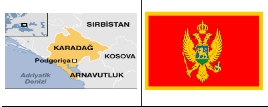
4.1. Karadağ Haritası ve Bayrağı