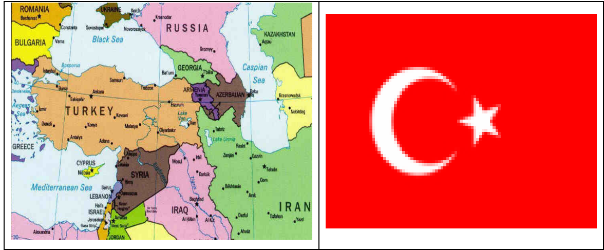
7.1. Türkiye Haritası ve Bayrağı