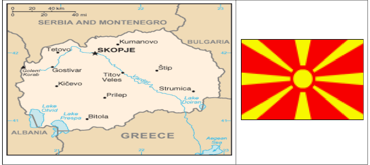
3.1. Makedonya Haritası ve Bayrağı