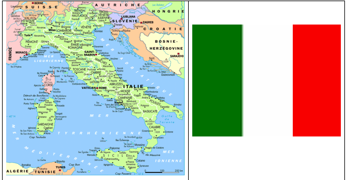
6.1. İtalya Haritası ve Bayrağı