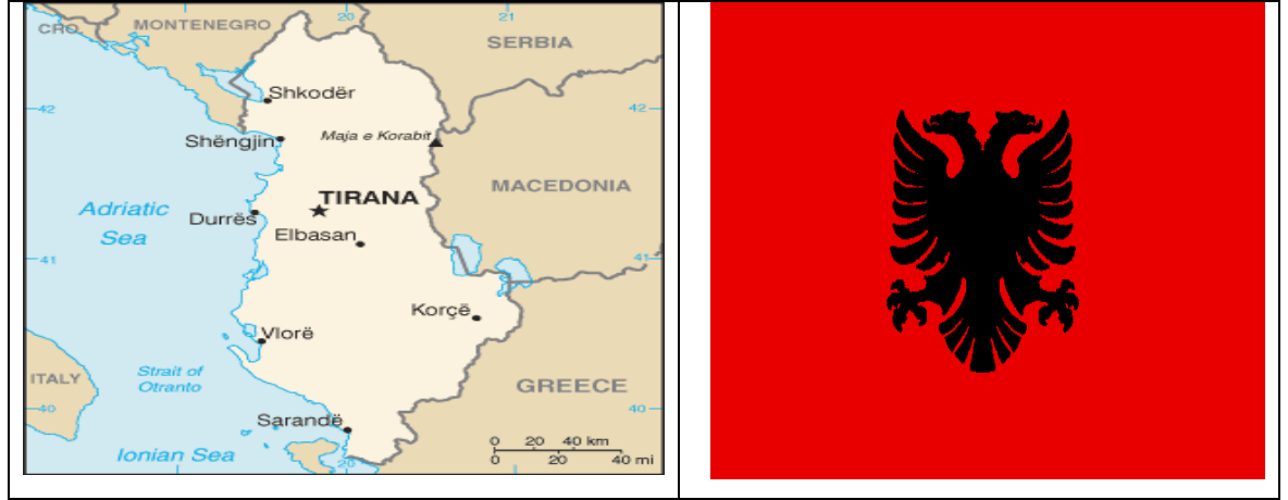
1.1. Arnavutluk Haritası ve Bayrağı