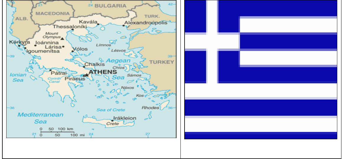
2.1. Yunanistan Haritası ve Bayrağı