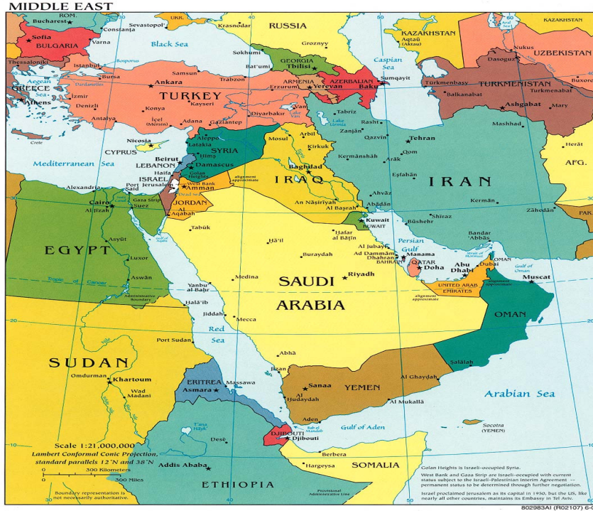
Harita 2.1: Ortadoğu Siyasi