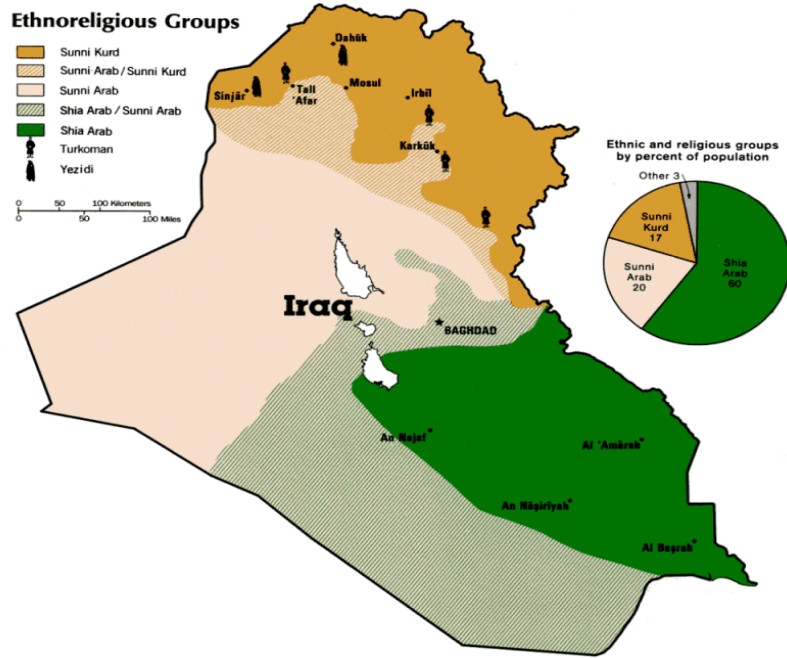
Harita 3.2 : Irak'ın Demografik Durumu