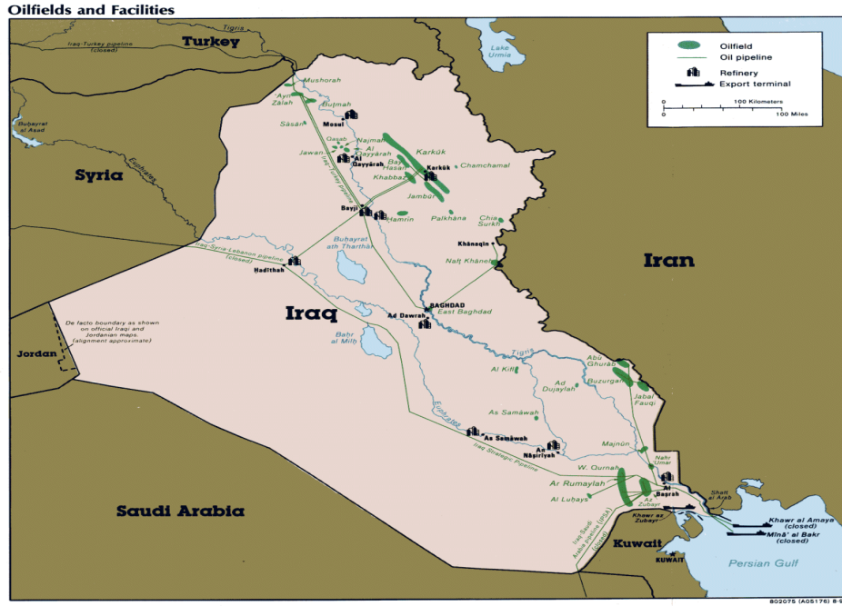
Harita 8.1. : Irak'ta Petrol Sahaları ve Petrol Boru Hatları