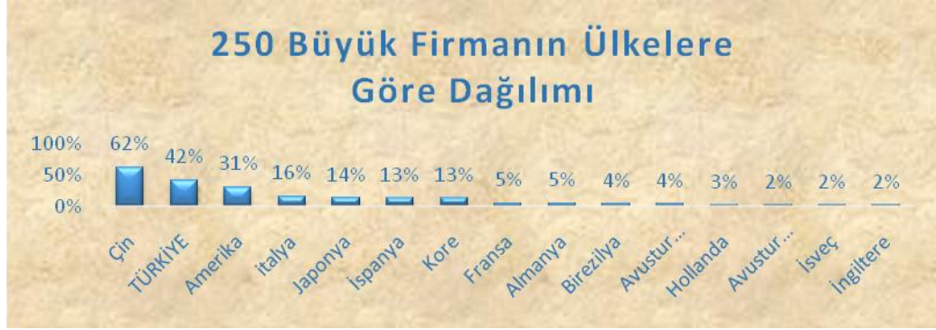
Tablo 2.5. 250 Büyük Firmanın Ülkelere Göre Dağılımı (Engineering News Record)

Sektörel anlamda bu büyüme ulusal düzeyde inşaat sektörünün teknolojik gelişmeleri yakinen takip etmesi gerekliliğini ortaya çıkarmıştır. Yeni ekipman ve malzemeleri üretim içerisine çok hızlı şekilde sokulup hem kaliteyi hem de üretim kolaylığının sağlanması hızlı atılımların yapılmasına ve üretim süreçlerinin kısalmasına vesile olmuştur. Sektörel büyüme bu sektörde çalışanların eğitim zorunluluğunu da beraberinde getirmiştir. Maalesef ki üretim aşamasında teknolojik ekipmanların kullanımı ne kadar üretimi kolaylaştırıp hızlandırmış olsa da insan gücüne ihtiyacı kesinlikle ortadan kaldıramamıştır. Sektörel anlamda çalışan iş gücüne bakıldığında; inşaat işleri son derece deneyimsiz, eğitim seviyeleri düşük çalışanların ve ucuz iş alan alt işverenlerin (taşeronlar) tarafından üstlenildiği görülmektedir.