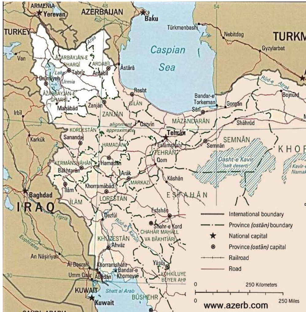
Şekil 2.1. İran Siyasi Haritası (www.azerb.com)