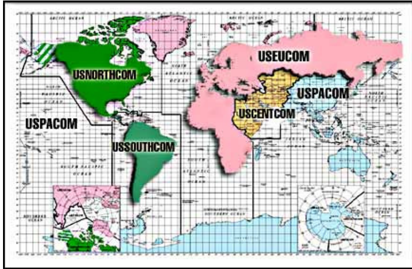
Harita 3.1 ABD Silahlı Kuvvetlerinin Dünya Coğrafyası Üzerinde Dağılımı

Bu dokuz komutanlıktan beşi , dünya coğrafyasını beş görev ve sorumluluk sahasına bölecek şekilde beş bölge üzerine konuşlanan Ortak Muharebe Komutanlıkları şeklinde teşkilatlanmışlardır. Bu komutanlıkların dünyadaki görev ve sorumluluk sahaları aşağıda görüldüğü gibidir.