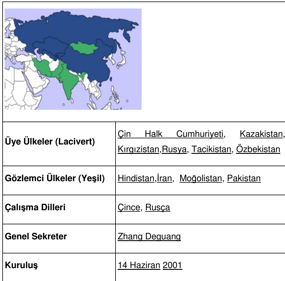
Tablo 6-1: Şangay İşbirliği Örgütü