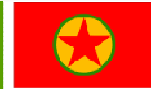
PKK 2005-ve sonraki son hali