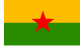
HPG 2000-... HRK(1982-1986) ARGK(1986-2000)

Kaynak: http://tr.wikipedia.org/wiki/PKK