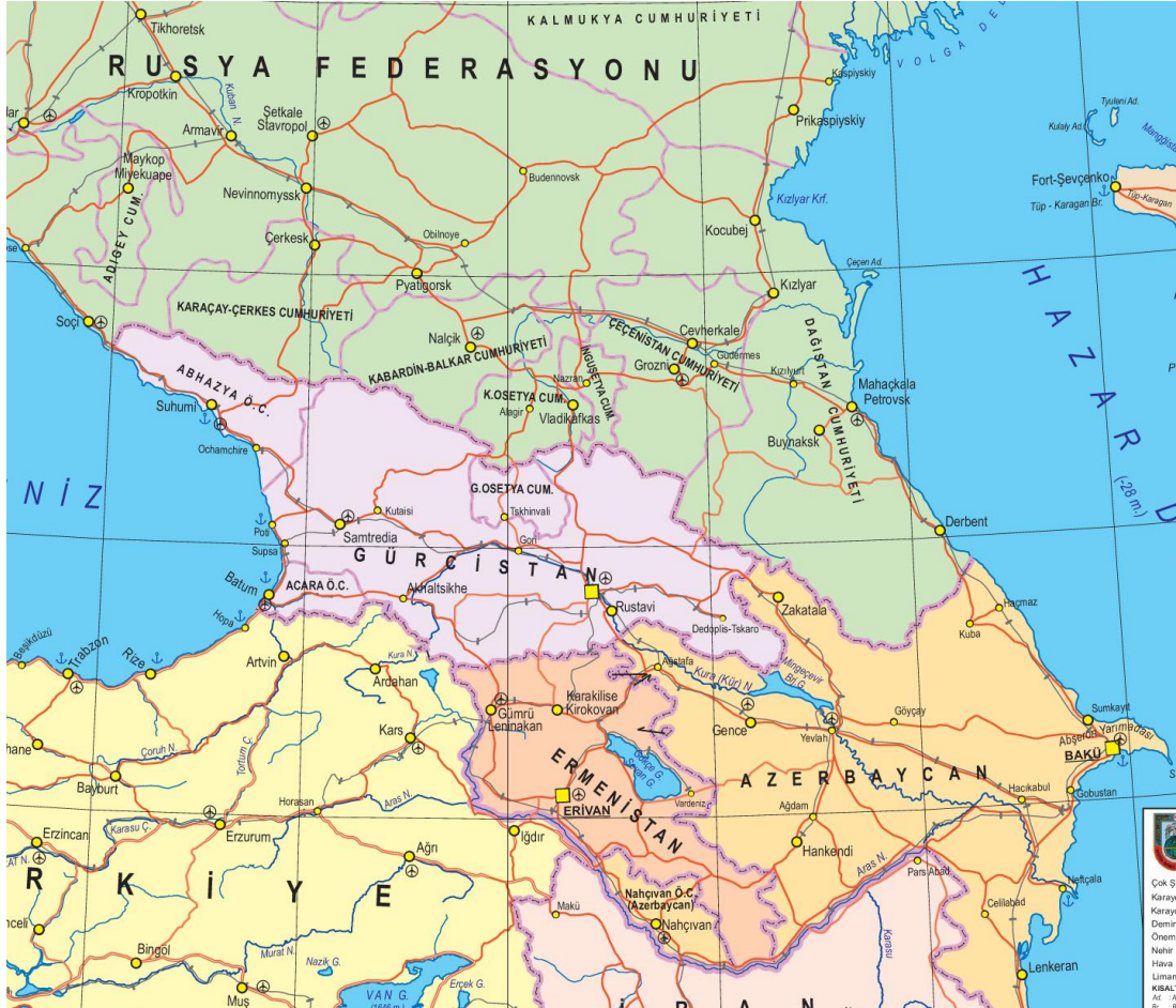
Harita 1: Kafkasya Siyasi Haritası