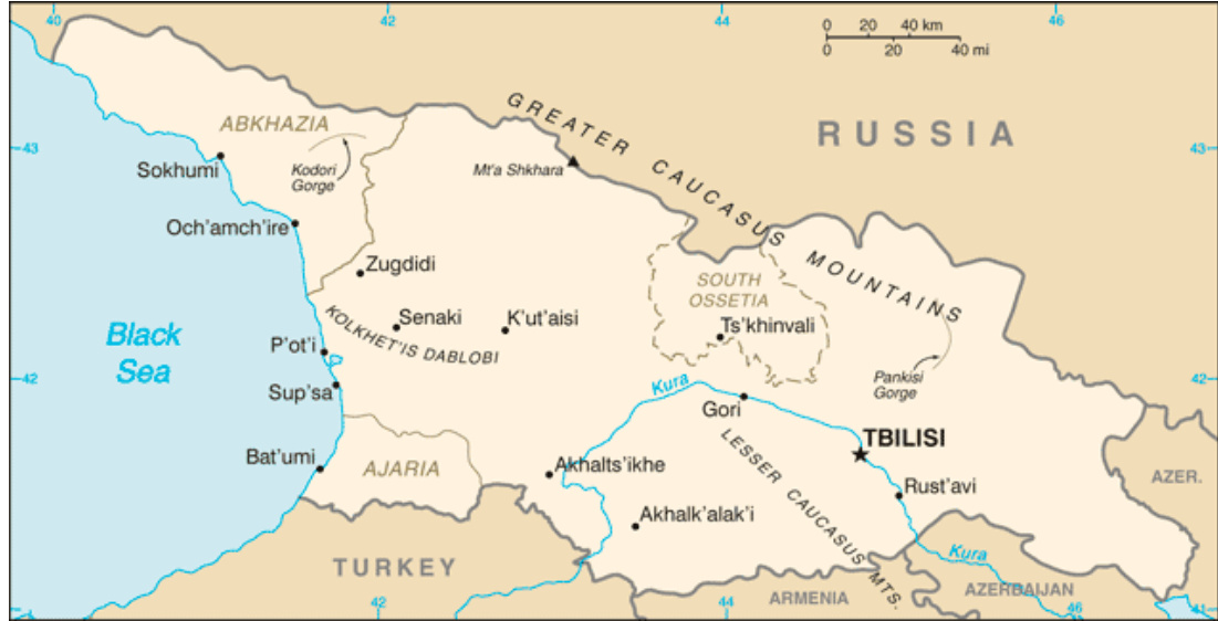
Harita 2: Gürcistan Siyasi Haritası