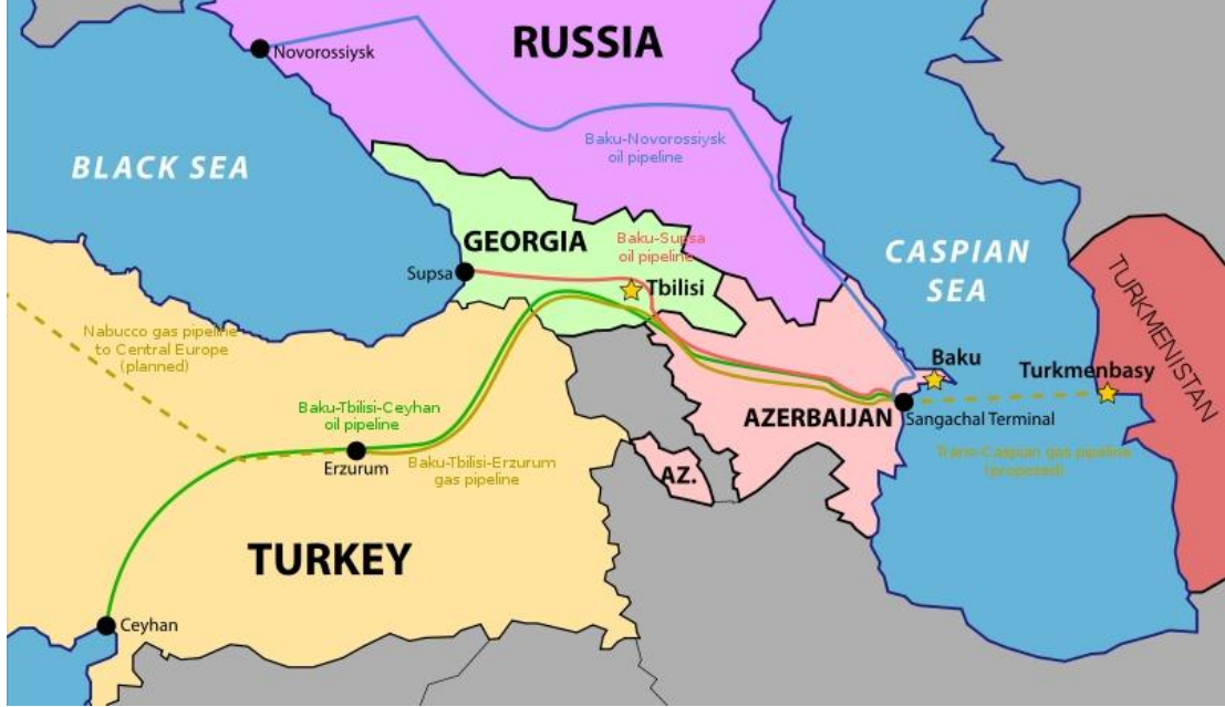
Harita 4: Enerji Nakil Hatları

Orta Asya ve Hazar Havzası enerji kaynaklarının Rusya dışı bölgelerden uluslar arası pazarlara nakli konusu Sovyetlerin dağılmasından sonra üzerinde düşünülen önemli konulardan biridir. Bu anlamda Güney Kafkasya bölgesinin önemi dikkat çekmektedir. Aslında Rusya'ya karşı paralel bir hat Türkiye vasıtasıyla sağlanabilmektedir ve bu anlamda en önemli bölge ülkesi Türkiye'dir. Ancak Türkiye-Ermenistan arasındaki problemler nedeniyle bölgesel hatlar Gürcistan üzerinden Türkiye'ye gelmekte ve bu da Türkiye ile birlikte Gürcistan'ın stratejik önemini arttırmaktadır.