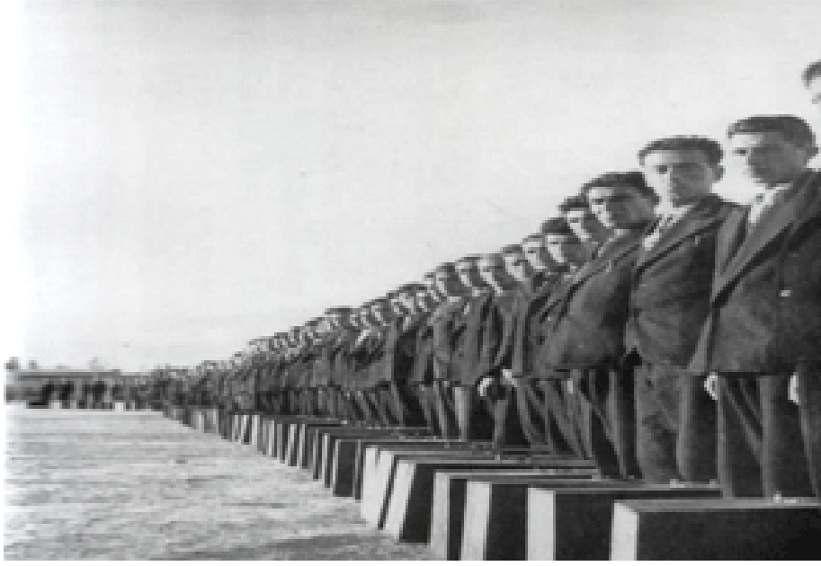
Resim 1: Köy Enstitülerinden mezun olan öğrenciler.

Resimde yer alan öğrencilerin tamamı aynı takım elbise ile hatta aynı bavul ile görülmektedirler. Resimde görülen “ tek tip insan ” yetiştirme düşüncesi ders kitaplarına şu sözlerle yansımıştır: “Mektep idaresi, mektep idaresinin koyduğu nizamlar, kaideler topluluğu tanzime ve mektepte müşterek faaliyete yardım ediyor. “Mektep nizamlarına riayet etmek sizin borcunuzdur ve sizin faydanızdır” (Ahmet,1928:28-29).