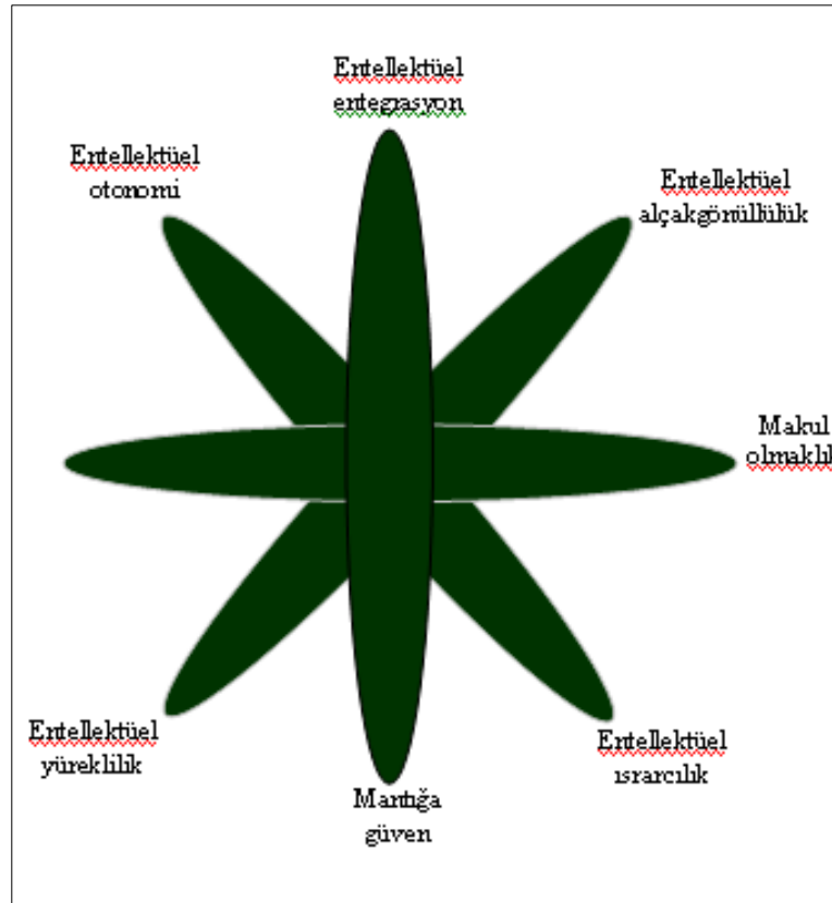
Şekil 2.2: Eleştirel Düşünme Kişisel Özellik Boyutu (Paul ve Elder, 2008)

Paul ve Elder (2008) bu özellikleri şu şekilde şema halinde sunar: