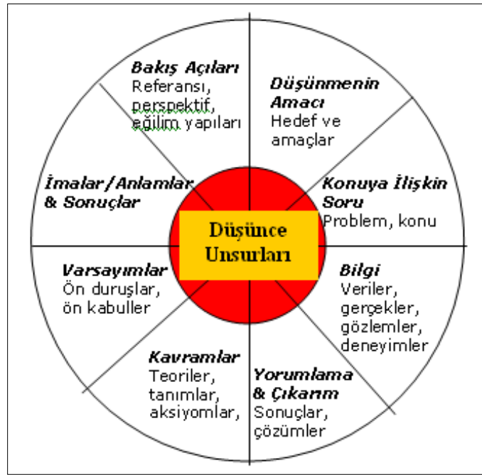
Şekil 2.1: Eleştirel Düşünme Unsurları (Paul ve Elder: 2008)