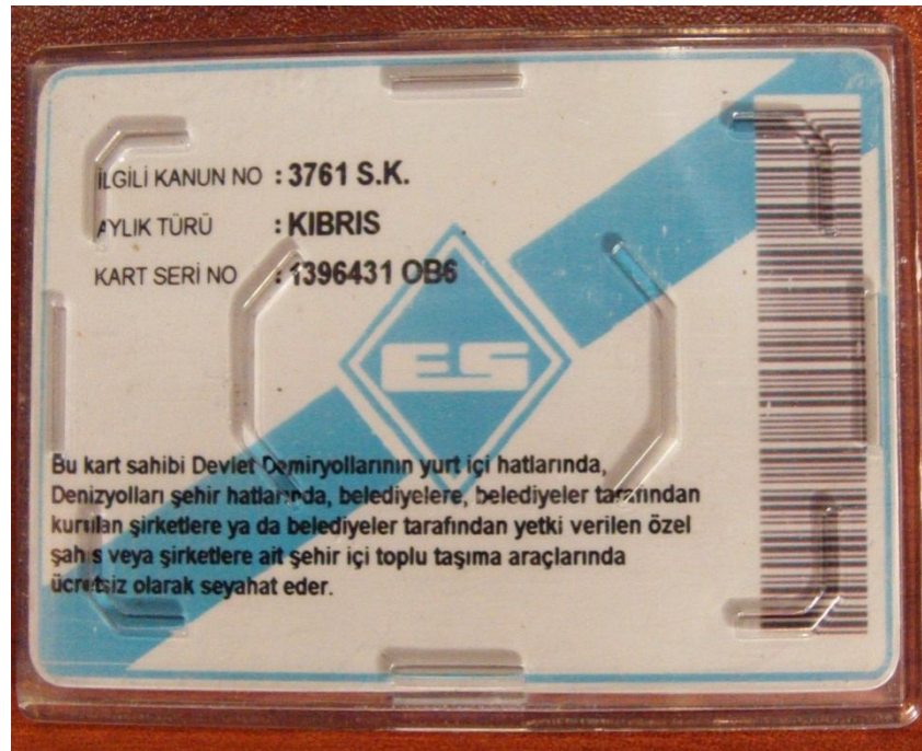
Gazilerimize verilen gazi kimliğine bir örnek. (Arka Yüz)