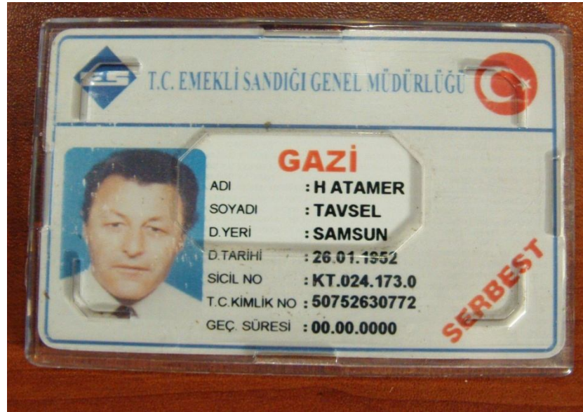
Gazilerimize verilen gazi kimliğine bir örnek. (Ön Yüz)