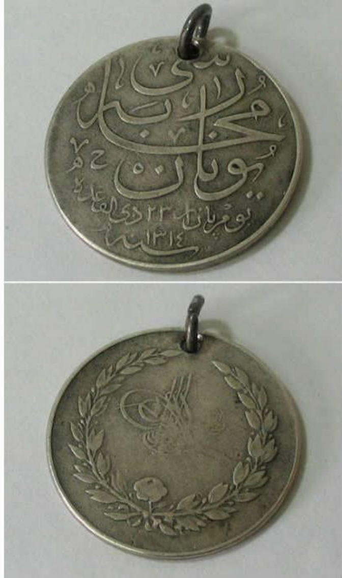
Ek: 5. Yunan Muharebe Madalyası Örneği

( http://mcdn01.gittigidiyor.net/7617/tn70/76174532_tn70_0.jpg?_=1362612805 Erişim Tarihi: