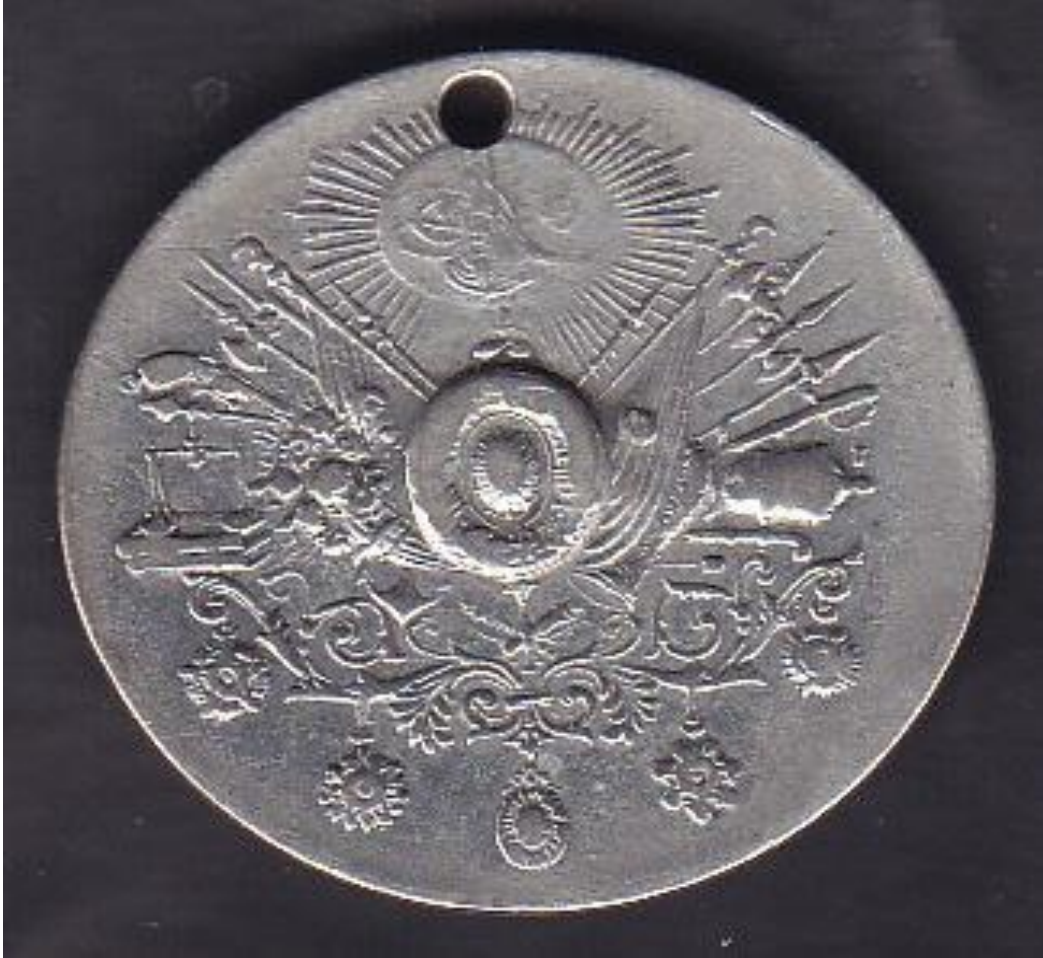
Ek: 3. Liyakat Madalyası Örneđi ( http://www.benerkoleksiyon.com/images/1002007%20(1).jpg Eriřim Tarihi: 13.06.2014 )