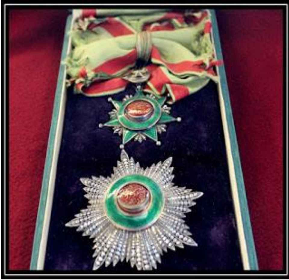
Ek: 7. Dördüncü Dereceden Osmanlı Nişanı Örneği

( http://koleksiyonerim.blogspot.com.tr/2013/01/osmanli-donemi-nisan-ve-madalyalari-1.html Erişim