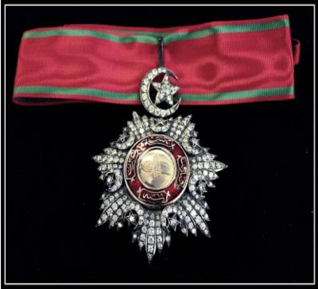
Ek: 6. Beşinci Rütbeden Mecid-i Nişanı Örneği

( http://koleksiyonerim.blogspot.com.tr/2013/01/osmanli-donemi-nisan-ve-madalyalari-1.html Erişim