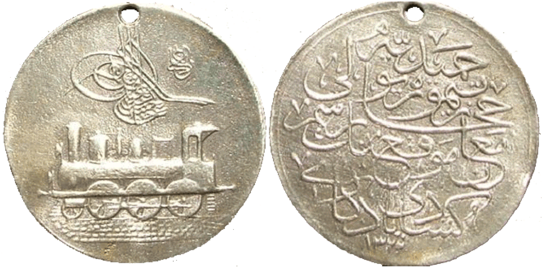
Ek: 1. Hicaz – Demiryolu Madalyası Örneđi

( http://upload.wikimedia.org/wikipedia/commons/1/16/Hicaz-demiryolu-maan-mevkii.gif Eriřim Tarihi: 13.06.2014 )