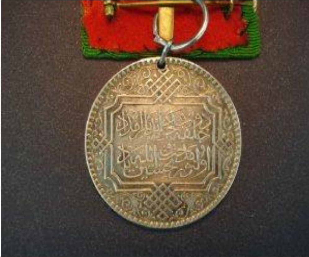
Ek: 2. Tahlisiye Madalyası Örneđi

( http://www.bing.com/images/search?q=tahlisiye+madalyas%c4%b1&qvpt=tahlisiye+madalyas%c4%b1&FORM=IGRE#view=detail&id=F685DCD48305EA5142FE5588BCAE15ED101C31C6&selectedIndex=0 Eriřim Tarihi: 13.06.2014 )