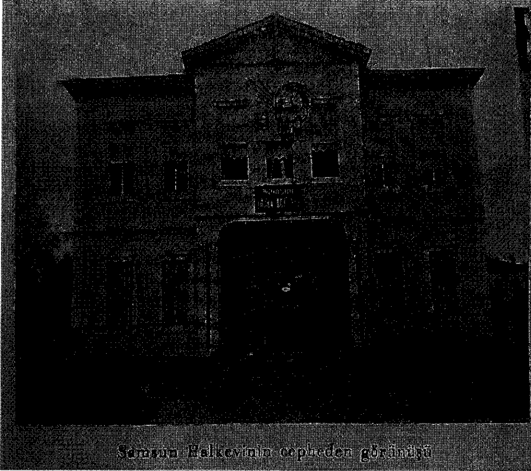
Samsun Halkevi 1932-1939, Dil Tarih Edebiyat Şubesi Yedinci Yıl Dönümü, 1939, Güneş basımevi, Samsun, s:7 )