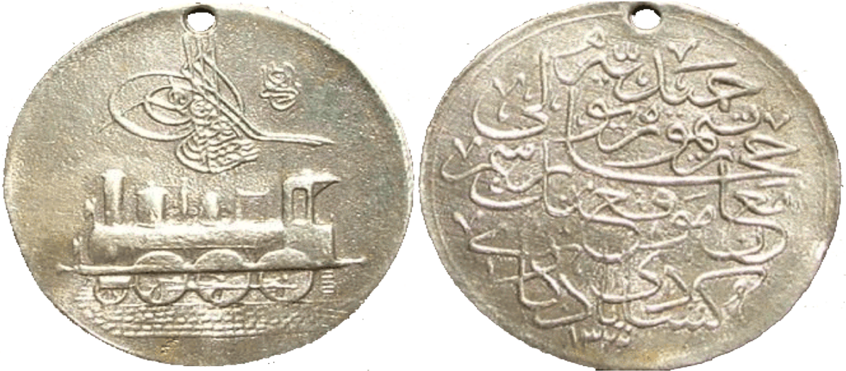
Ek:4-Hamidiye-Hicaz Demiryolu Madalyası Örneği

( http://www.turkish-militaria.com/TR/ThemenTR/Abdulmecid/photo024.htm Erişim tarihi:25.04.2015)