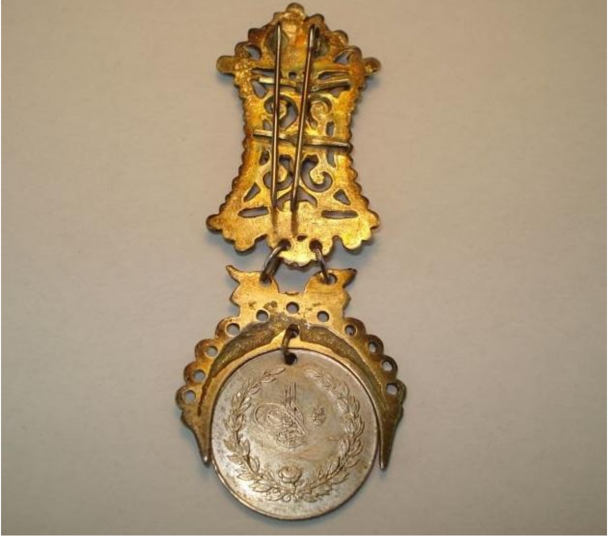
Ek:6- Yunan Muharebe Madalyası Örneđi.

( http://www.turkish-militaria.com/TR/ThemenTR/Abdulhamid/photo059.htm tarihi:25.04.2015)