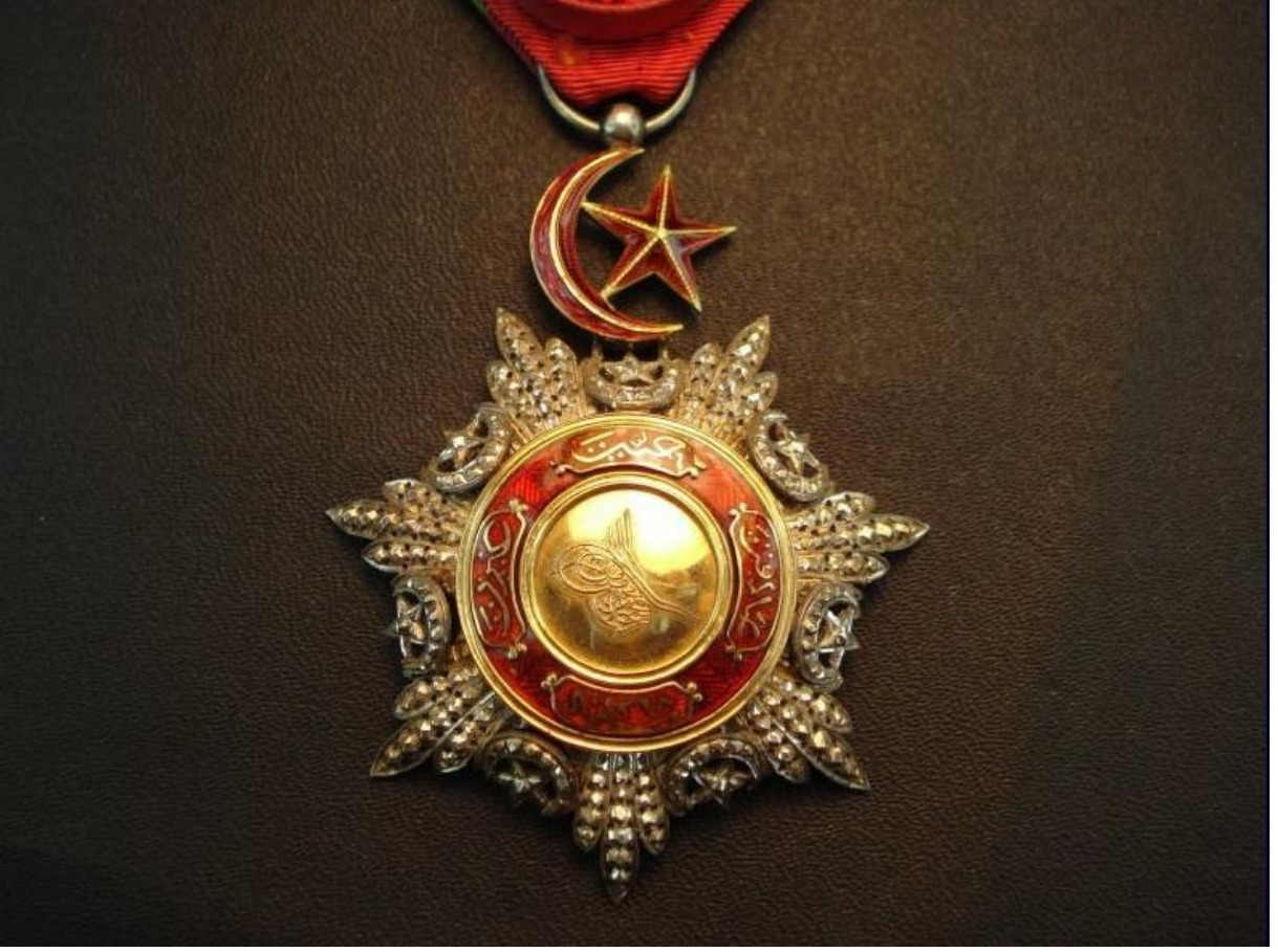
Ek:2- Dördüncü Rütbeden Mecidi Nişanı Örneği

( http://www.turkish-militaria.com/TR/ThemenTR/Abdulgadir/photo026.htm tarihi:25.04.2015)