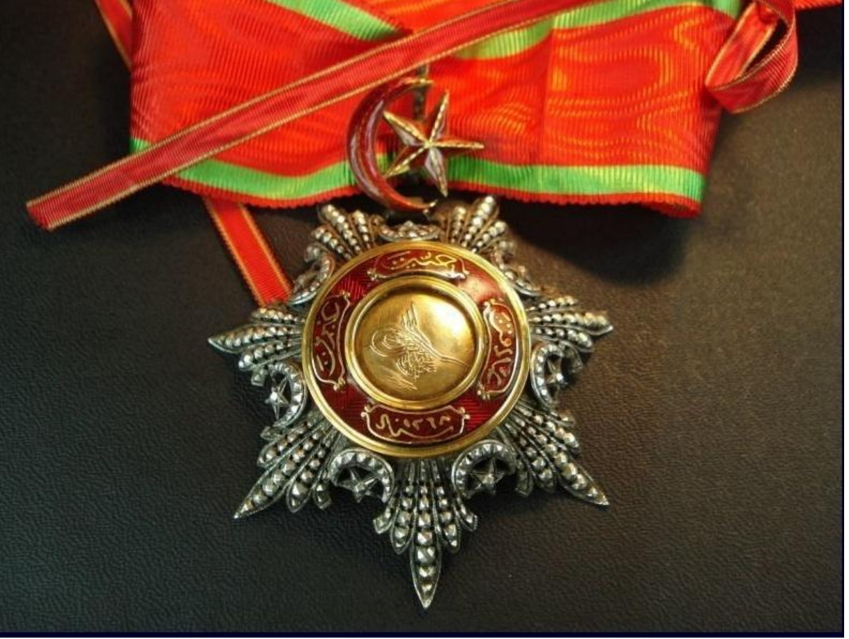
Ek:3-İkinci Rütbeden Mecidi Nişanı Örneği

( http://www.turkish-militaria.com/TR/ThemenTR/Abdulmecid/photo024.htm Erişim tarihi:25.04.2015)