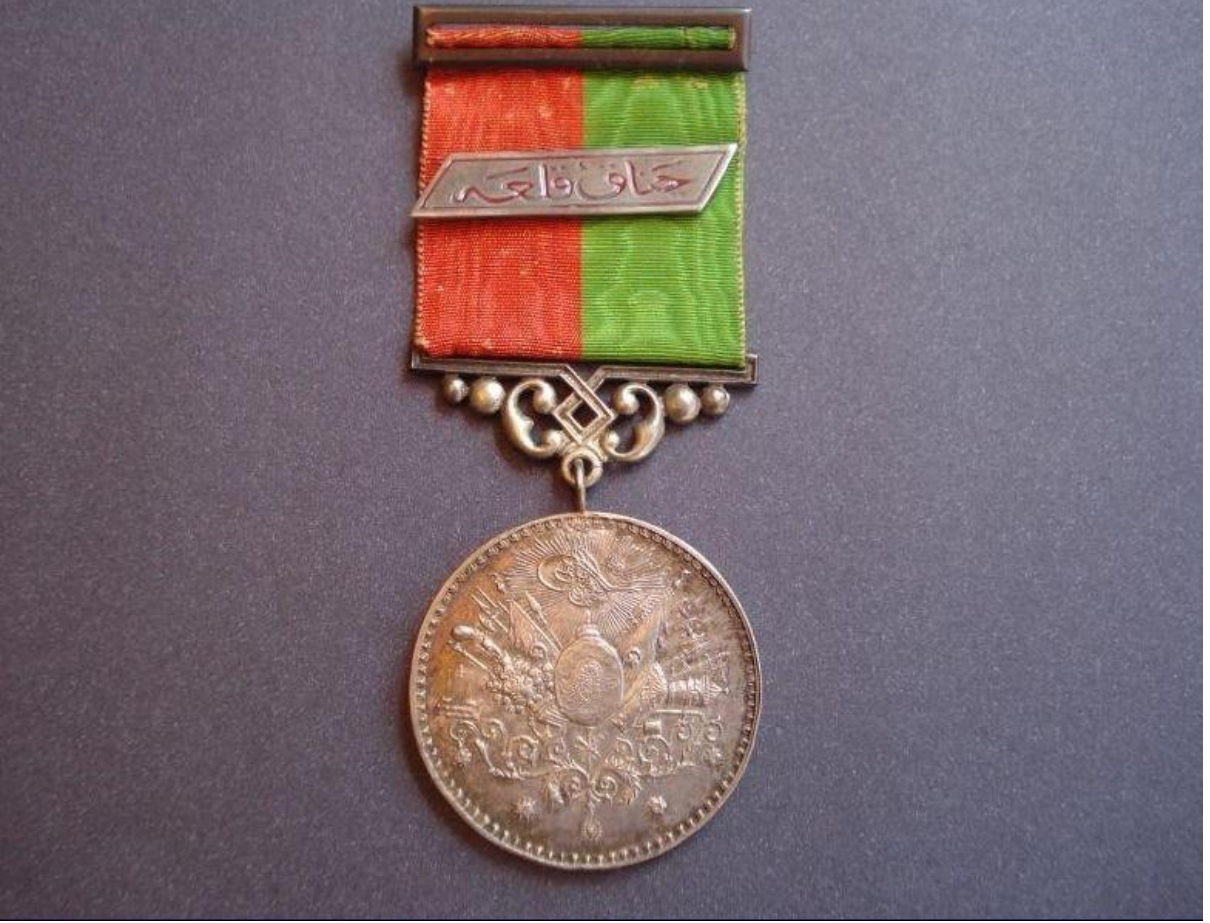
Ek:5-İmtiyaz Madalyası Örneđi.

( http://www.turkish-militaria.com/TR/ThemenTR/Abdulhamid/photo009c.htm