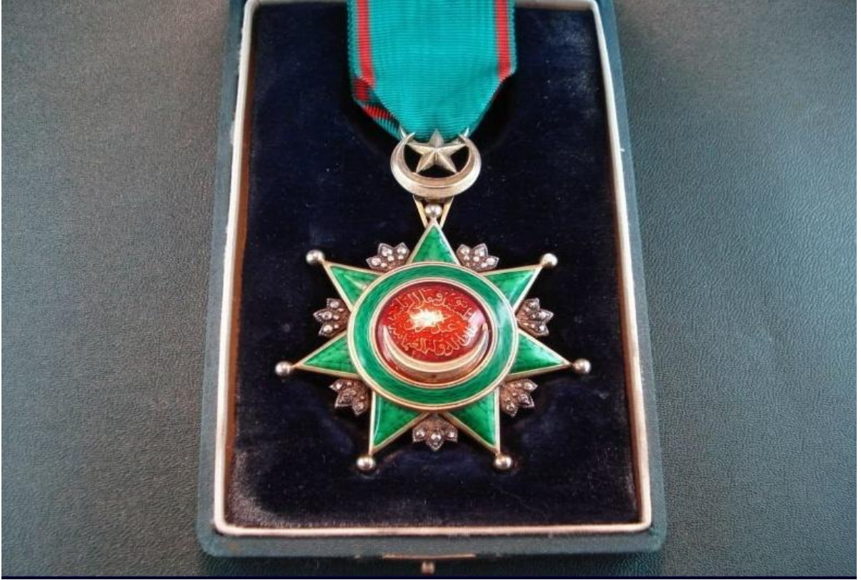
Ek:1-Dördüncü Rütbeden Nişan-ı Âli Osmanî Örneği

( http://www.turkish-militaria.com/TR/ThemenTR/Abdulaziz/photo019.htm Erişim tarihi:25.04.2015)