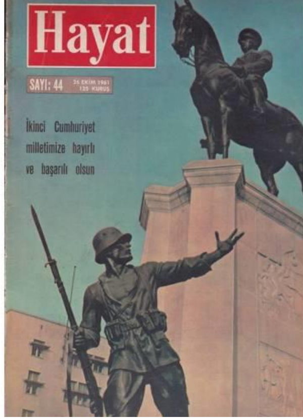
Resim 6: Hayat Mecmuasının 21 Ekim 1960 Tarihli Kapağı.

“Kurucu Meclis tarafından kabul edilen Anayasa şüphesiz pek yakında halkın oyuna sunulacak ve herhalde referandum neticesinde müspet sonuç alınacaktır. Yani İkinci Cumhuriyet’in fiilen kurulmasına üç dört aylık bir zaman kalmıştır 962 ”.