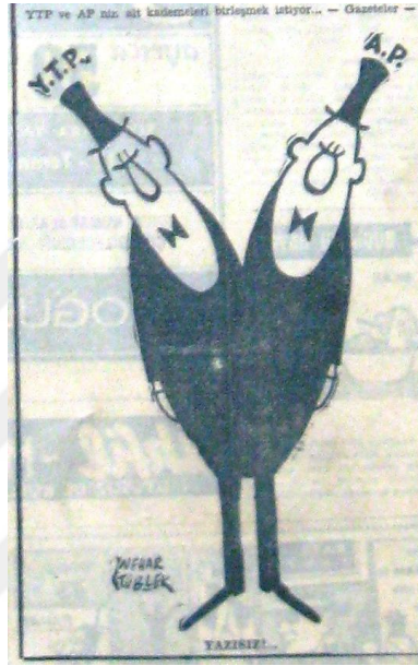
Resim 4: Birleşmeyi Tasvir Eden Bir Karikatür (Akşam, 13.07.1961).