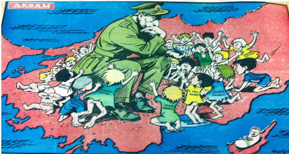
Resim 2: Darbe Sonrası Çözülmesi Gereken Meseleler Karşısında Düşünen Adam: Cemal Gürsel. (Akşam, 16.09.1960)

27 Mayıs darbesine giden süreçte toplumun politize ve mobilize olması, iktidarın elini zayıflatırken muhalefetin kurumsal şemsiyesinin genişlemesine vesile olmuştur. Bu noktada öğrencilerin, işçilerin, kadınların ve toplumun her kesiminden insanın sivil toplum örgütleri çatısı altında bir araya gelmesi ülkede STK'leri önemli bir toplumsal güç haline getirmiştir. 27 Mayıs'ın sosyolojik tabanını da üniversitelerin, sendikaların, basın, derneklerin oluşturduğu göz ardı edilemez. Üniversite öğretim üyeleriyle yaşanan gerginlikler, yargıda ve orduda girişilen tasfiyeler, basın kanununun anti-demokratikleştirilmesi, gösteri ve yürüyüş kanununun daraltılması, muhalefet partileri ile olan ilişkilerin gerginliğinin her geçen gün artırılması, sendikaların kapatılması, seçim kanununun değiştirilmemesi, 6-7 Eylül Olayları, plansız büyüme ve ekonomik sıkıntıların baş göstermesi DP iktidarının sallandığının belirtileri ve müdahaleyi hazırlayan nedenler olarak sıralanabilir.