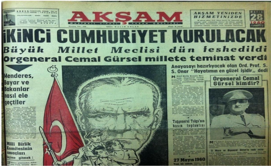
Resim 5: 28 Mayıs 1960 Tarihli Akşam Gazetesi'nin Manşeti.

27 Mayıs'a giden yolda taşların nasıl döşendiğinin hikayesini anlatan CHP milletvekili Bekata ise kitabına "Birinci Cumhuriyet Biterken" başlığını koyarak ikinci cumhuriyet tartışmalarına dahil olmuştur. Ona göre büyük bir değişimi ifade eden "27 Mayıs İnkılabı" ile yeni bir devletin kurulmasının yolu açıldı ve bu nedenle ikinci cumhuriyet tabirinin kullanılmasında bir sakınca görülmemiştir 948 . Bekata'nın yanı sıra Erginer de hemen darbe ertesi kaleme aldığı kitabına "İkinci Cumhuriyetin Eşiğinde" adını vererek, 27 Mayıs sonrası bu tabirin yaygınlaşmasına katkı sağlayanlardan olmuştur. Erginer Bekata'dan farklı olarak darbe öncesi hadiseler tek tek değinmemiş, onun yerine demokrasi kavramına temas etmiş, demokrasinin toplumun her kesimiyle ilişkisinden yola çıkarak ihtilalin nedenlerini ortaya koymuştur 949 . İhtilal liderinin radyoda yapmış olduğu konuşmada işaret ettiği bu değişim sonraki birkaç ay boyunca ülke gündemini meşgul eden tartışmalar arasında yerini almıştı. Gürsel'in açtığı kapıdan birçok siyasetçi ve köşe yazarı girerek tartışmalara kendi mahfillerinden katıldılar. Tartışılan konular arasında: ikinci cumhuriyetin ne olduğu, ne olmadığı ve nasıl olması gerektiği ile böyle bir sınıflandırmaya gereksinim olup olmadığı yer almıştır.