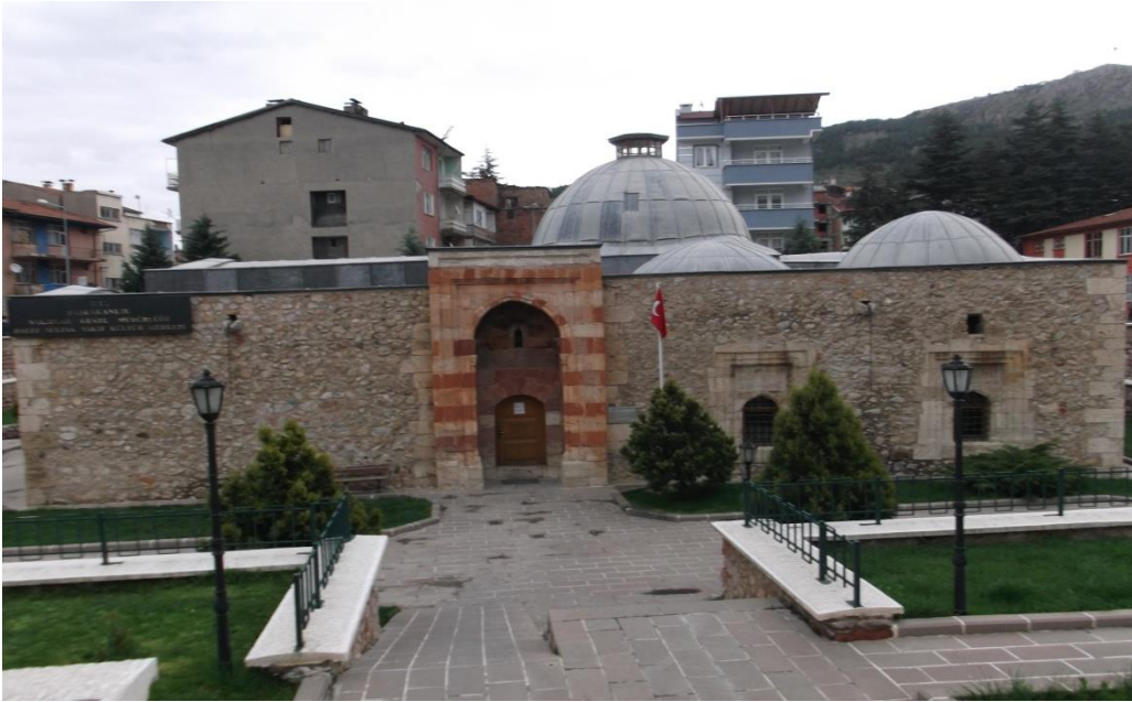
Resim 5: Halef Sultan Zaviyesi