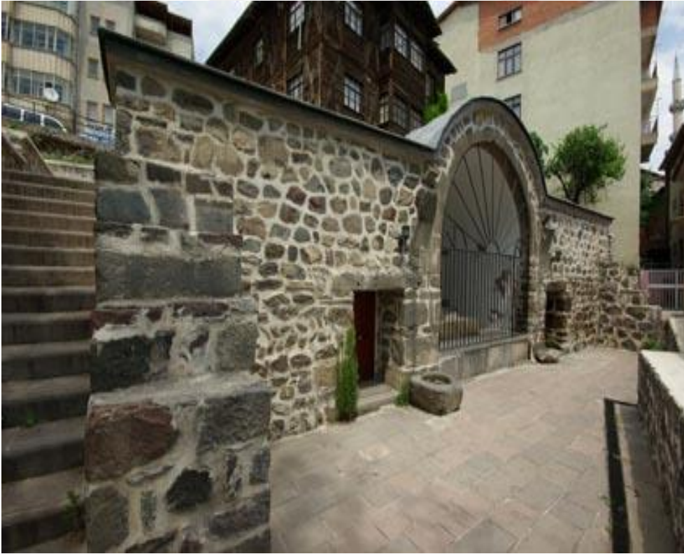
Resim 17: Niksar Hacı Çıkrık Türbesi