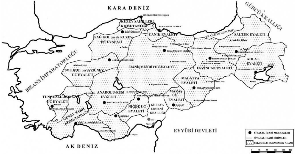
Harita 3: Anadolu'da Selçuklu Dönemi Siyasî, İdarî örgütlenme ve egemenlik sınırları 386