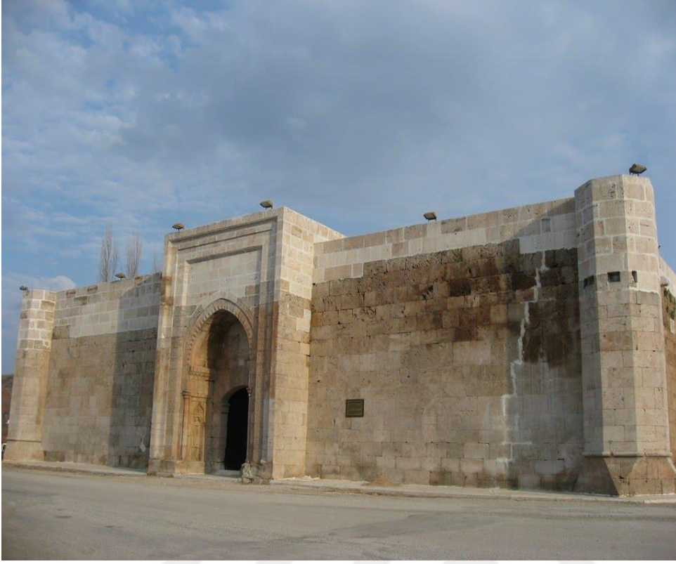
Resim 15: Mahperi Hatun Kervansarayı 383