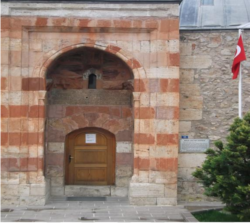
Resim 6: Halef Sultan Zaviyesi Taç Kapısı