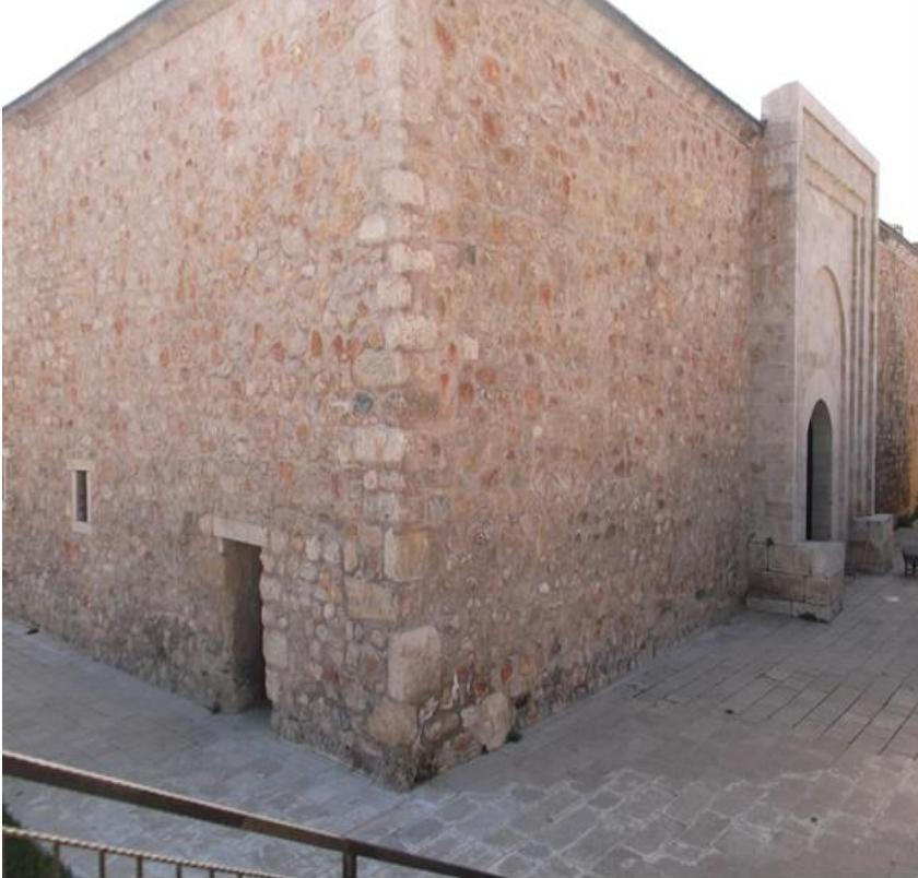
Resim 13: Tokat Yağbasan Medresesi