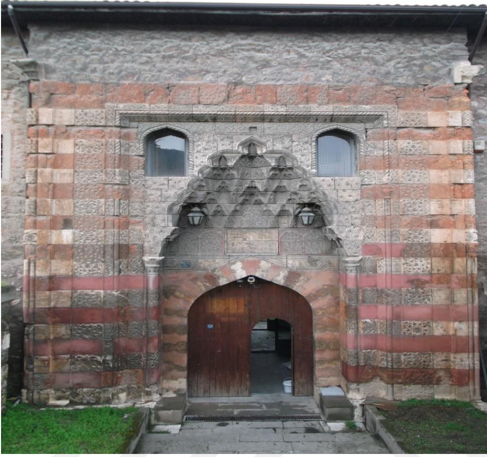
Resim 4: Gök Medrese Taç Kapısı