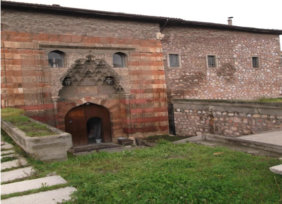
Resim 3: Gök Medrese