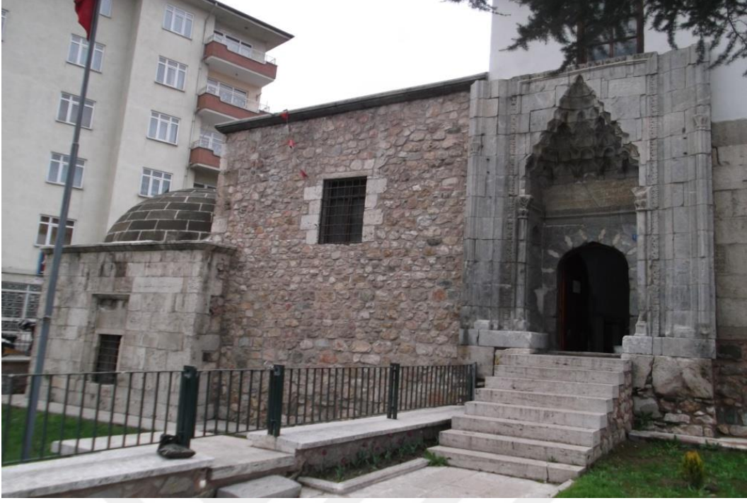
Resim 2: Sümbül Baba Zaviyesi