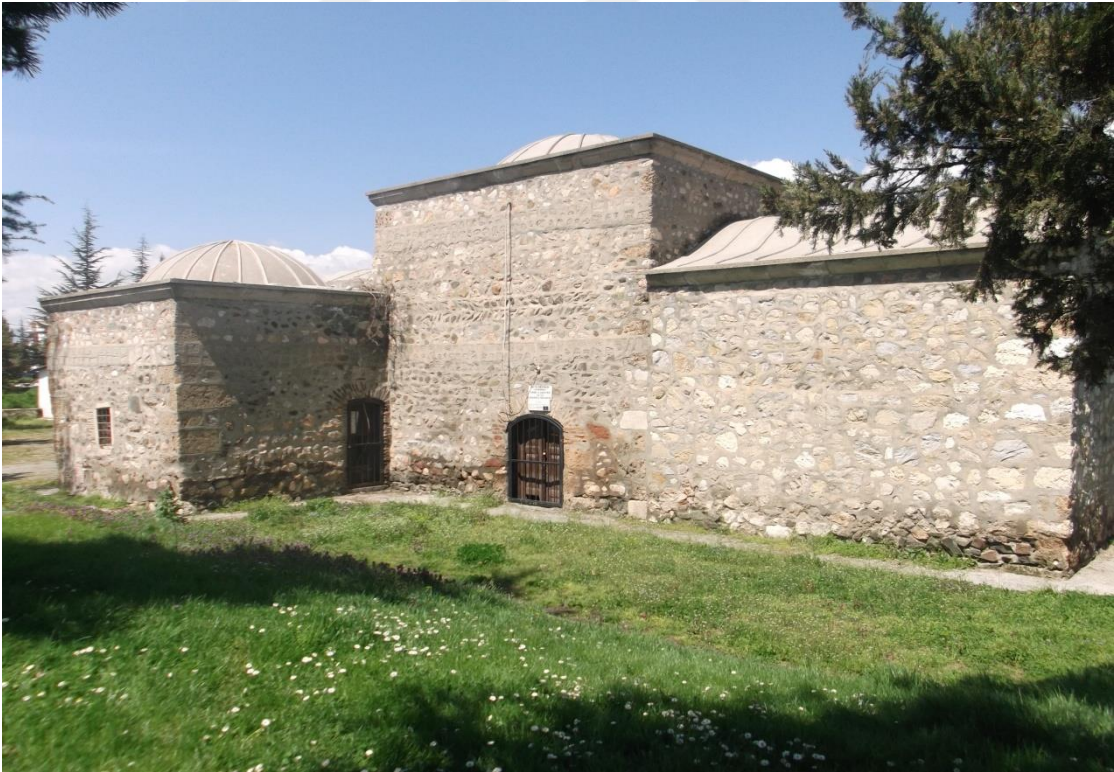
Resim 9: Şeyh Meknun Türbe ve Zaviyesi