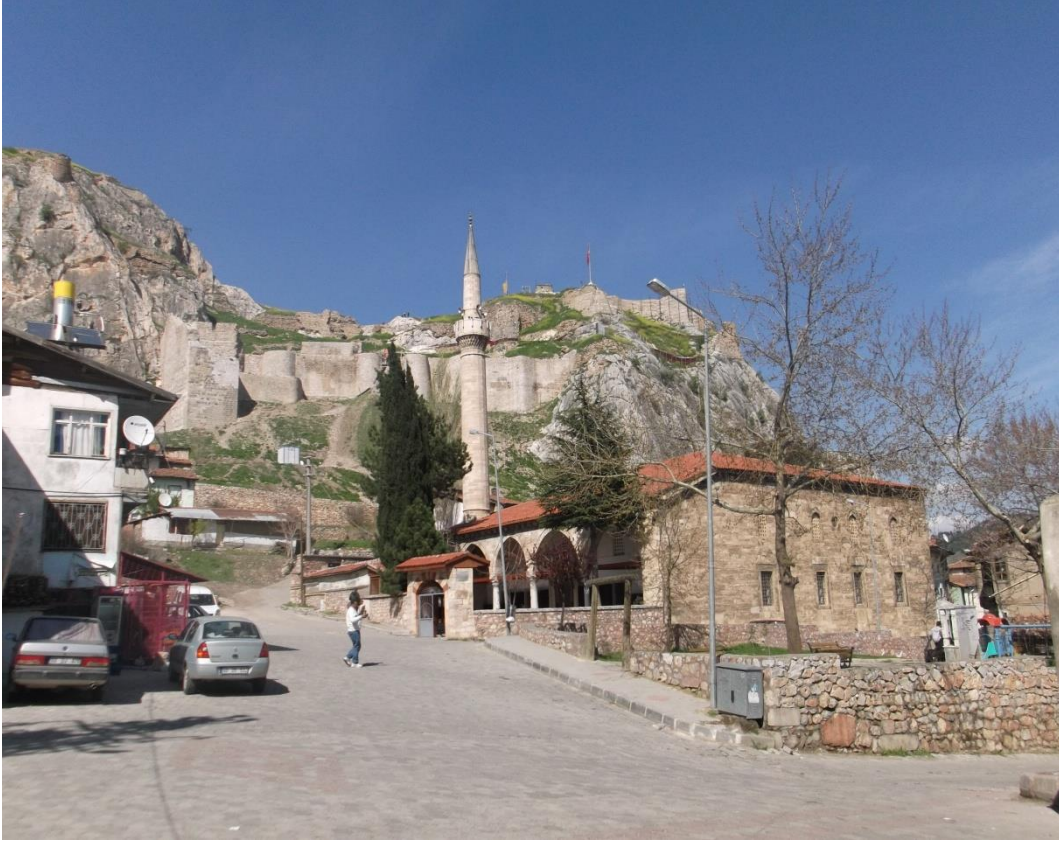
Resim 11: Tokat Kalesi ve Tokat Ulu Camii