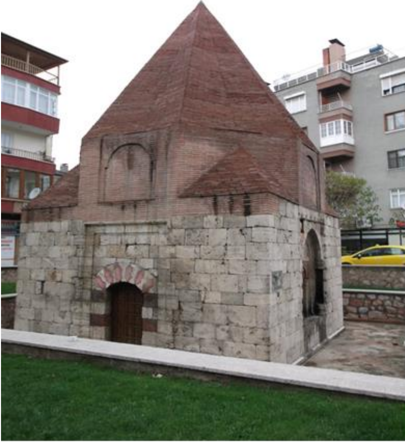
Resim 1: Sentimur Türbesi