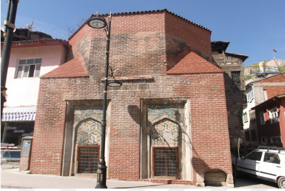
Resim 10: Ali Tusî Türbesi