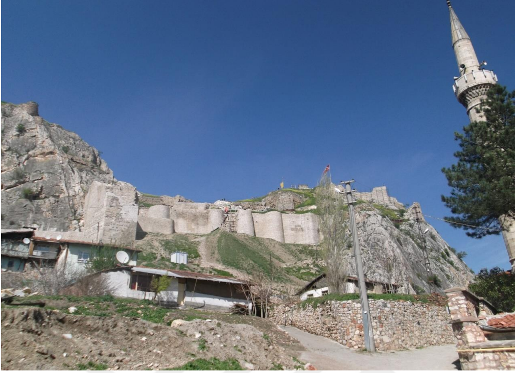
Resim 12: Tokat Kalesi