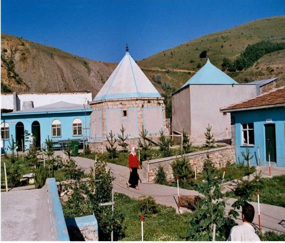
Resim 14: Hubyar Sultan Tekkesi 382