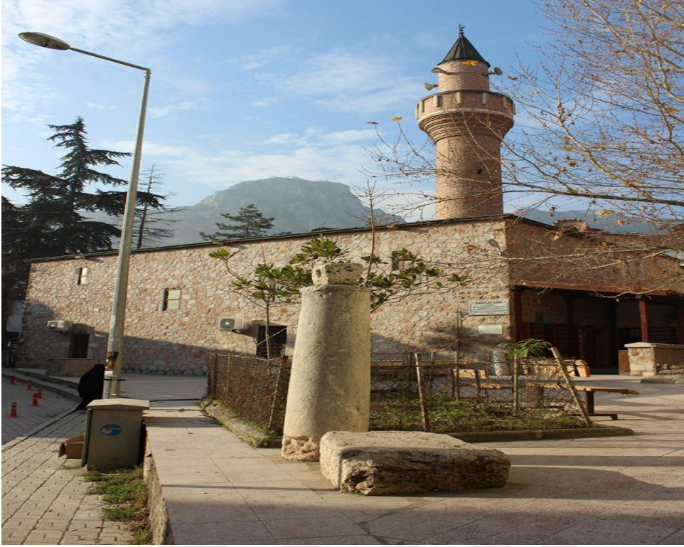
Resim 16: Tokat Garipler Camii