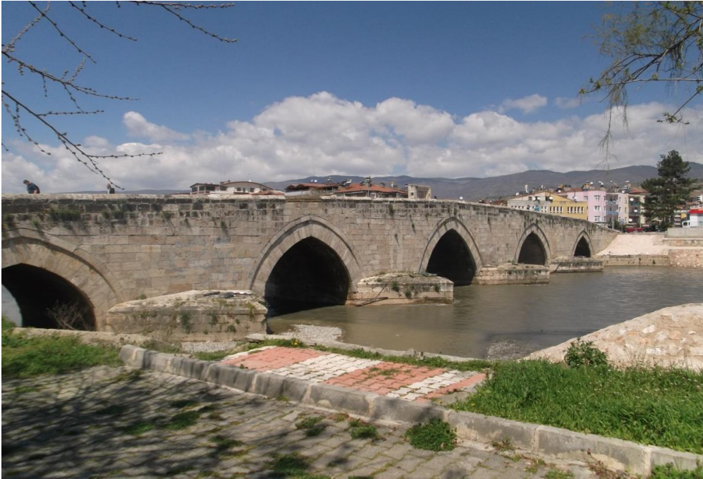
Resim 7: Hıdırlık Köprüsü (Taş Köprü)