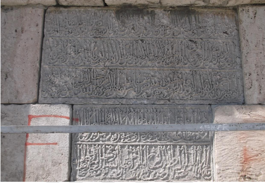
Resim 8: Hıdırlık Köprüsü Kitabesi