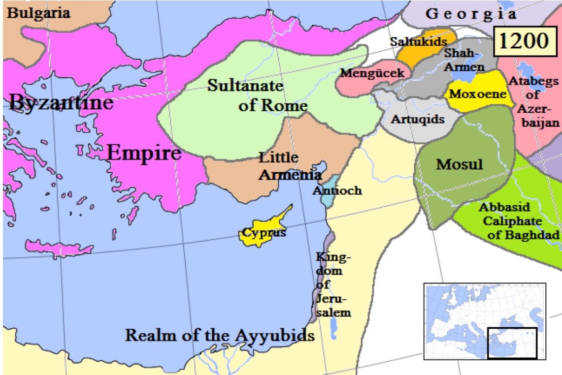
Ek-6: 1200 yılında Artuklular

http://tr.wikipedia.org/wiki/Artuklu_Beyliđi#/media/File:Anatolia1200