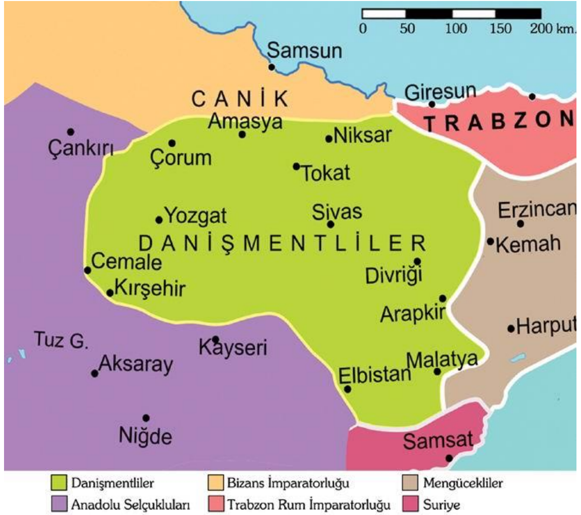
Ek-4: Danişmentliler (1071-1178)

http://www.ansiklopedim.info adresinden alınmıştır. (Erişim tarihi 31.05.2015)