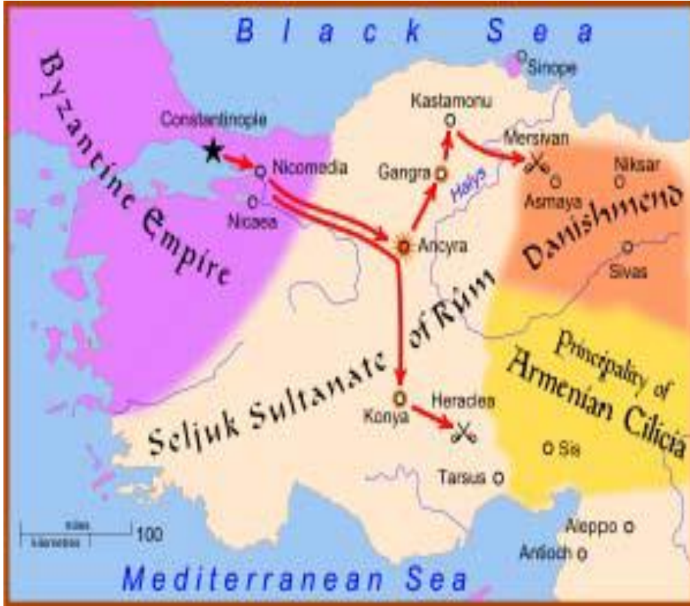
Ek-2: 1101 Yılı Haçlı Seferi Güzergâhı