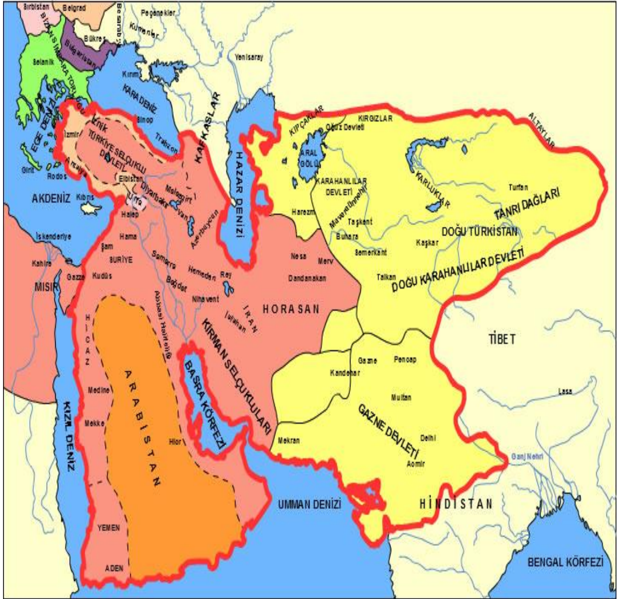
Şekil 1: Büyük Selçuklu Devleti