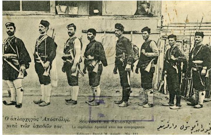
Resim 19: Kaptan Apostol ve Rûfekaları 1041