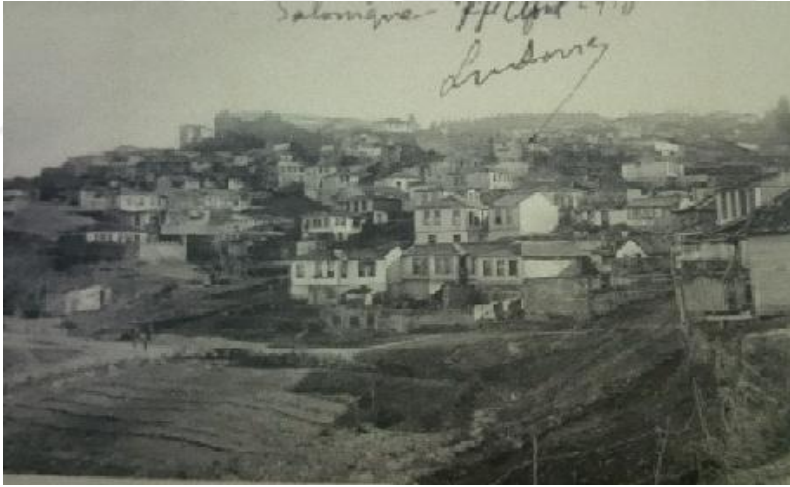
Resim 6: Sur Dibinde Türk Mahallesi 212

Selanik'te Türkler kendilerine ait mahallelerde yaşıyorlardı. 210 Selanik'te kırk sekiz Türk mahallesi vardı. 211 Müslümanların yoğun olarak buldukları yerleşim bölgeleri, şehrin kuzey bölümünde, tepelerin üzerindeydi. 19.yüzyıl başında en önemli Türk mahallesi, surların kuzeydoğusundaki Telli Kapu yakınında bulunan Ahmet Subaşı mahallesi idi. Fakat Müslümanların diğer cemaatlerle karışık oturduğu başka mahalleler de vardı: Akçe Mescid, Koca Kasım Paşa, Saray-ı Atik, Porta Kapu, Astarıcı, Mes'ud Hasan, İki Şerefli, Suluca ve Kasımiye.