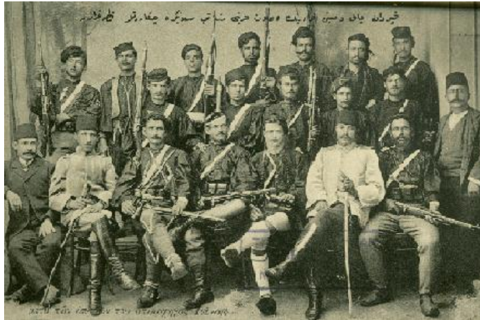
Resim 16: Kaptan Yani ve Maiyeti 832

Çıkarılan affın ardından önde gelen çete reisleri teslim olmuşlardı. Sandanski ve arkadaşları meşrutiyetin ilanından sonraki ilk günde; Çernopeevev ikinci veya üçüncü günde teslim oldu. İMDÖ’nün sağcılarının çeteleri de ilk günlerde kentlere gelmeye başladılar. Son olarak Sırp ve Rum komiteleri teslim oldu. Osmanlı idaresinde veya Makedonya içerisinde olup bağımsız bir karaktere sahip Arnavutlar ve Sandanist Parti gibi taraflar gelişmelere açık hatta olumlu bir tepki gösterdiler. 831