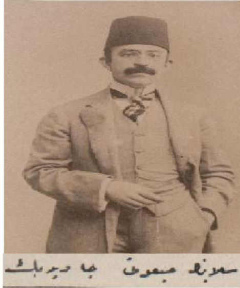
Resim 4: Selanik Mebusu Cavid Bey 196