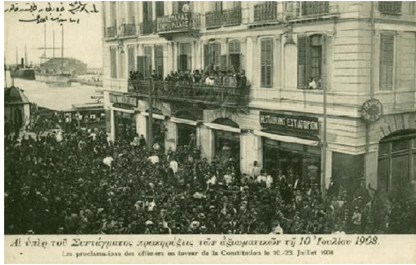
Resim 1: Selanik'te Zabitan Tarafından Kanuni Esasi'nin İlanı /23 Temmuz 1908 136

İkinci Meşrutiyet ilan edildiği zaman, 137 1876 ve 1877'den sonra, 1908'de Osmanlı Devleti'nin üçüncü genel seçimini yapmak gerekiyordu. İkinci Meşrutiyet'in ilk genel seçimi 1908 yılının Kasım-Aralık ayları içinde yapılmıştır. 138 Yapılan bu