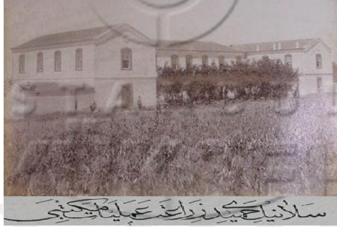
Resim 9: Selanik Hamidiye Ziraat Ameliyat Mektebi 416

bütün masrafları tazmin edeceğine dair velisi tarafından bir kefalet senedine sahip olması şarttı. 415