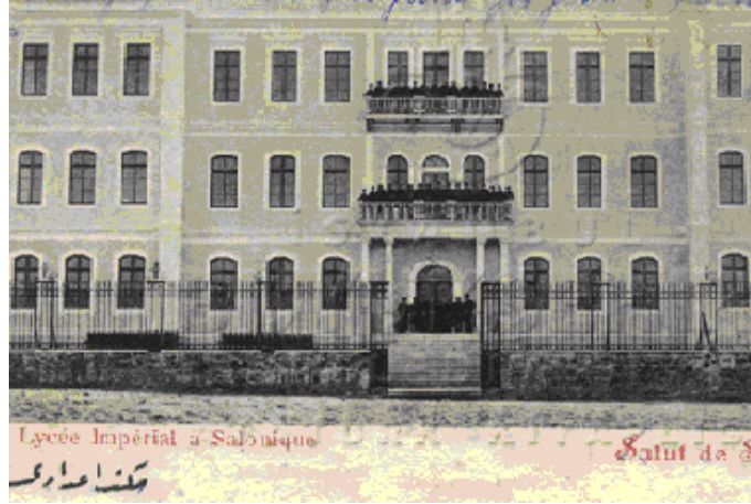
Resim 8: Selanik Mekteb-i İdadisi 392

İdadi mektepler, Osmanlı maarif sistemine bir ortaöğretim müessesesi olarak Maarif-i Umumiye Nizamnamesi ile girmişti. Bu mekteplerin özel amacı talebelere orta tahsil seviyesinde bilgi vermek, onları ticari, sanayi ve ziraat alanında sanat sahibi yaparak çalışma hayatına hazırlamaktı. İdadi mektepleri bu vazifeleri yerine getirebilecek şekilde teşkilatlandırılmış, ders programları da bu amaca uygun olarak düzenlenmişti. 393