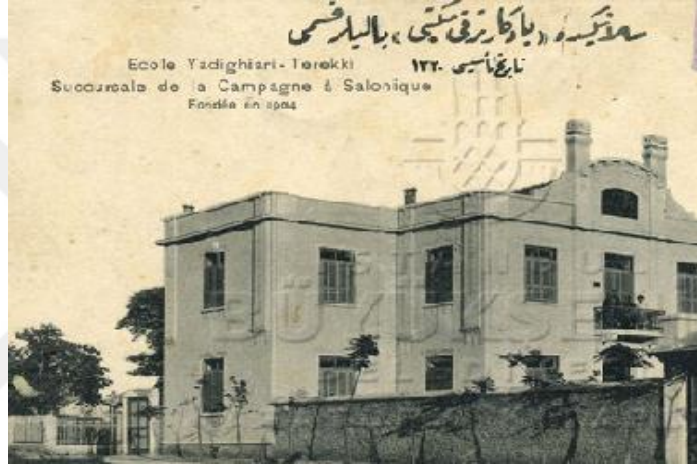
Resim 11: Selanik'te Yadigâr-ı Terakki Mektebi/ Yalılar Kısmı 444

toplumsal yapıdaki gereksinimlere uygun bir doğrultuda yapıldığı gözlenmektedir. Terakki Mektebi'nden mezun olanlar bir yandan, o dönemde neredeyse yalnızca İstanbul'da bulunan yüksek öğretim kurumlarına devam edebilmekte, diğer yandan da Selanik'teki ticari ve mali kuruluşlarda çalışabilmekte ve Selanik'te etkinlik gösteren başlıca şirketlerden biri olan "Şimendifer Kumpanyası"na da memur olabilmekteydiler. 441 Mektebin kuruluşunun yirmi beşinci senesi şerefine mektebin adı Yadigâr-ı Terakki şekline dönüştürülmüş 442 ve 1324 (Hicri)/(1906/1907) senesinde Yalılar'da bir de inas ibtidai şubesi açılmıştı. Mektebin zükura mahsus leylî kısmı da 1324 (Hicri)/(1906/1907) senesinde açılmıştı. 443