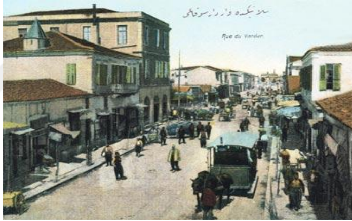
Resim 13: Selanik'te Vardar Sokağı/Atlı Tramvaylar 648

Diğer Osmanlı ve Avrupa şehirleri ile karşılaştırıldığında tramvay Selanik'e oldukça geç gelmişti. 643 Selanik'e tramvayın gelmesi Compagnie Ottomane des Tramways de Salonique'nin, 1889 yılında, atlı tramvay işletme ve tesis imtiyazını alması ile başlamıştır. 644 Selanik Tramvay Şirketi 11 Eylül 1889 tarihinde 50 sene müddetle kurulmuştu. 645 Şirketle anlaşmaya varılmasının ardından Selanik şehrinde ulaşım için ilk defa 1889 yılında tramvay hattı döşenmeye 646 ve 1893'de de ilk atlı tramvaylar işlemeye başlamıştır. 647