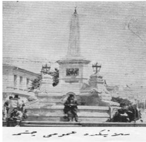
Resim 15: Selanik'te Umumi Çeşme 737

Diğer taraftan su kumpanyasının bazı uygulamalarının halkın şikâyetine sebep olmasından dolayı halkın haklarını aramak istediği ama su kumpanyası mukavelenamesinin içeriğini bilmediklerinden dolayı ne gibi hakları olduğunu öğrenmeyi talep ettikleri görülür. Bundan dolayı gazetelerle söz konusu mukavelenin suretleri yayınlanarak halkın bilgilendirilmeye çalışıldığı, bu çerçevede hukukunu koruma yoluna gidildiği görülmüştür. 736