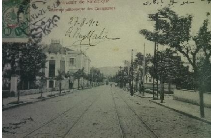
Resim 14: Hamidiye Caddesi/Tramvay Yolu 673

Zaman gazetesi konuyla ilgili olarak 18 Safer 1327 (11 Mart 1909) tarihli “Tramvaylara Dair” başlığıyla yazdığı yazısında, tramvay hatlarının memleketin ihtiyacına göre çok sınırlı olarak Tahtakale’den İstasyon ve Beşçınar’a ve İskele’den Depo’ya kadar işletildiğini, oysa Beşçınar’dan ileri mevkilerin de günden güne gelişmesinden dolayı tramvay hatlarının bu noktalara kadar uzatılması gerektiğini savunmuştur. 674 Bu konuda halkın gerçekleşen şikâyetleri üzerine, bundan önce durum Nafia Nezareti’ne bildirilmişti. Eski Nazır Zihni Paşa tarafından gönderilen tahriratta bu yerlerin mesafeleri tahakkuk edilmek üzere belediyeye havale olunarak icap eden krokiler yapılmış ve evrakı vilayet tarafından tramvay komiserine havale olunmuş ise de kumpanyaya karşı ciddi bir teşebbüste bulunulmadığından iş sonuçlanamamıştı. 675