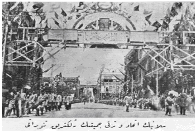
Resim 14: Selanik İttihat ve Terakki Cemiyeti'nin Elektrik Tenvirati 714

Yine tablonun incelenmesinde de anlaşılacağı üzere 5 mum kuvvetinde bir lambanın sarfiyatı saatte asgari olarak 0,85 Frank yani 1,49 para iken, 10 mum kuvvetindeki lambanınki 1,63 Frank yani 2,90 para, 15 mum kuvvetininki 2,64 Frank yani 4,60 para, 25 mum kuvvetindeki 4,14 Frank yani 7,30 para, 32 mum kuvvetindeki 5,26 Frank yani 9,20 para iken 50 mum kuvvetindeki ise 8,22 Frank yani 14,40 paradır. 713