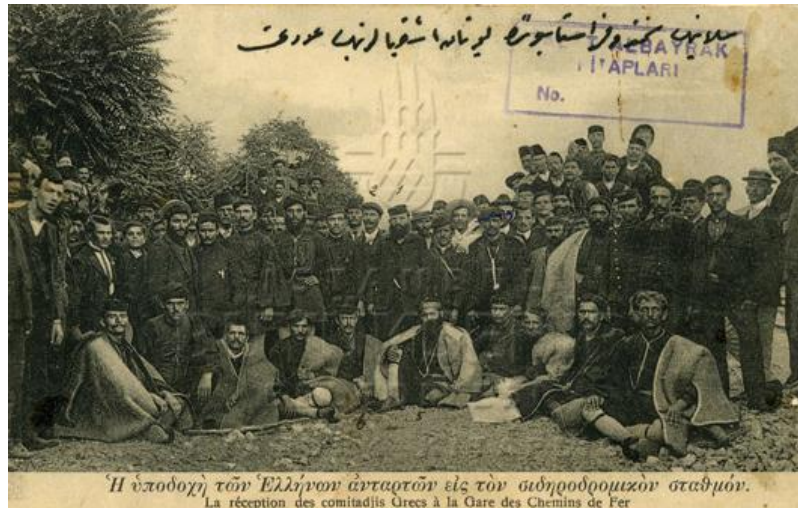
Resim 18: Selanik Şimendifer İstasyonunda Yunan Eşkıyalarının Avdeti 895

Meşrutiyet ilan edilmeden hemen önce 1907 yılı içinde Makedonya'da Yunan hükümetinin çete hareketleri hala devam etmekteydi. Her ne kadar 1907 Ocak ayı Yunan ve Bulgar devrimci örgütleri için sakin geçti ise de baharda harekete geçmek üzere Teselya'da hazırlıklar devam etmekte idi. Aynı yıl içinde Yunan çetelerinin katliam olayları devam etmiş Katrin Kazası dâhilinde Bulgarların katl edildikleri görülmüştür. Yunan çeteleri ile Türk askerleri arasında çatışmalar Temmuz ayı içinde de devam etmiş. Temmuz sonlarına doğru Osmanlı hükümeti Teselya çetelerinin oluşumunu önlemek için Atina hükümetine çağrıda bulunmuştu. 894