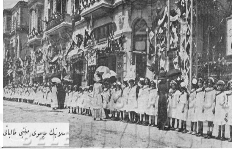
Resim 12: Selanik Musevi Milleti Talebatı 621

1200 erkek öğrenciye öğretim verilmekteydi. Kız Alliance okulunda da 440 kız öğrenci ve anaokulunda da 380 kız öğrenci bulunmaktaydı. 620