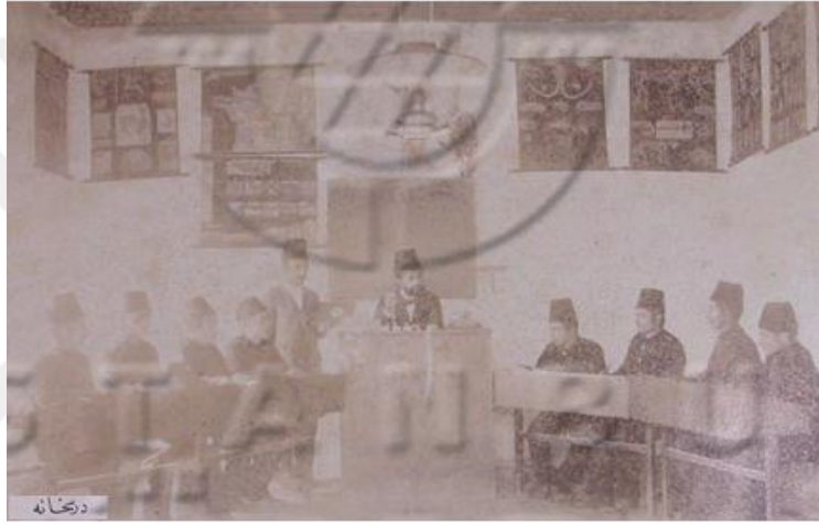
Resim 10: Selanik Hamidiye Ziraat Mektebi Dershanesi 420

Yine meşrutiyeti müteakip mektebin ıslah edilmesi yoluna gidildiği saptanmaktadır. Rumeli gazetesinin ifadelerine bakılacak olursa, Ziraat Mektebi'nin tahsil hayatında son iki yıl itibariyle aktif bir faaliyet vardı. Gazeteye göre, özellikle, mektebin idare ve talim heyetleri mektebi geliştirmek için çalışmışlar, gayret ve teşebbüsleri sayesinde güzel bir kimya ameliyathanesi vücuda getirmişler, bir de müze teşkil etmişlerdi. 419