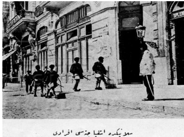
Resim 17: Selanik'te Eşkıya Çetesi Efradı 843