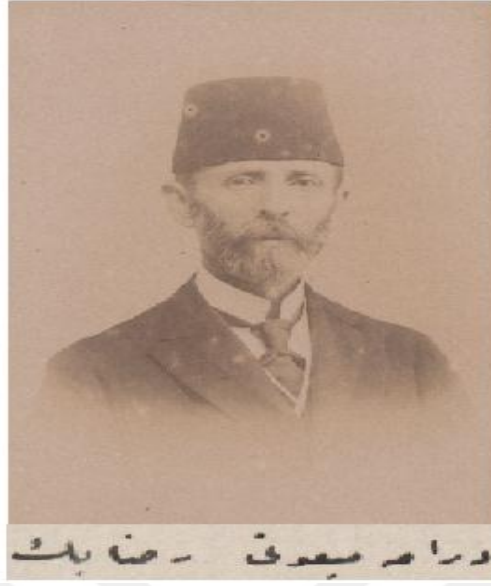
Resim 2: Drama Mebusu Rıza Bey 179