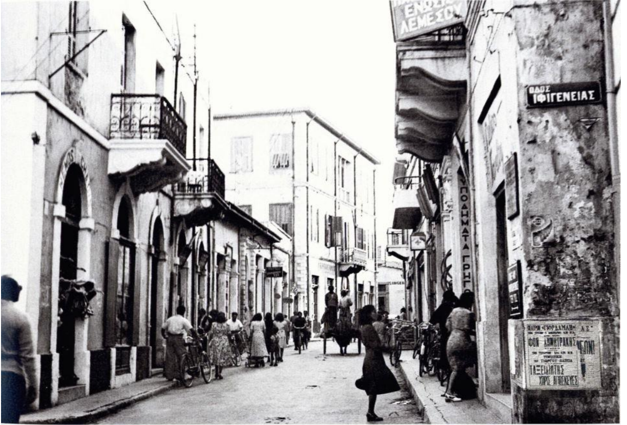
Ek 13: Limasol şehrinin sokakları 413 .