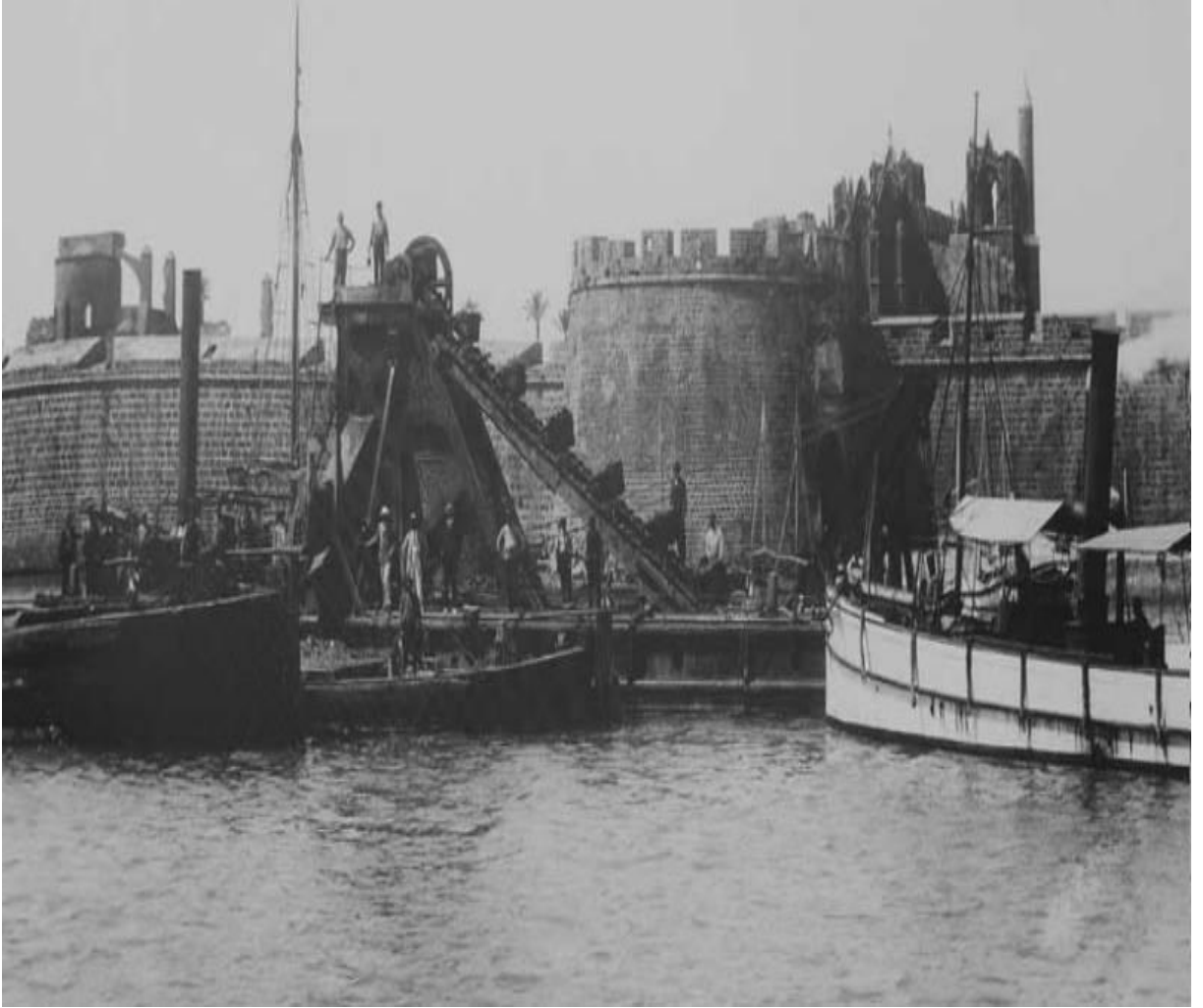
Ek 16: Gazimağusa Limanı'nın daha eski tarihli görünümü 417 .