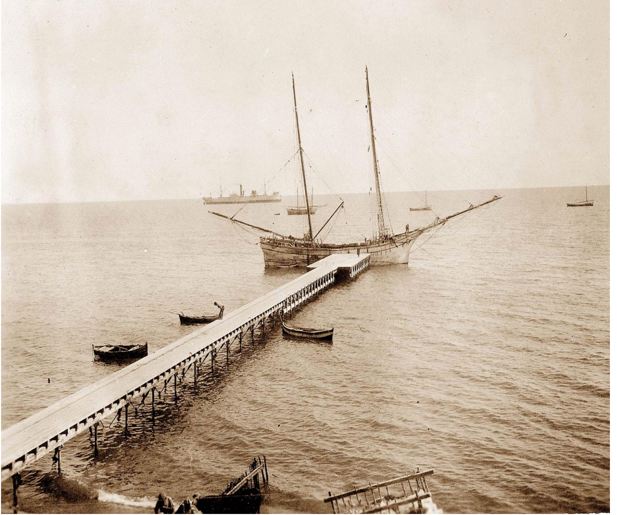
Ek 17: Limasol Limanının iskelesinin görünümü 418 .