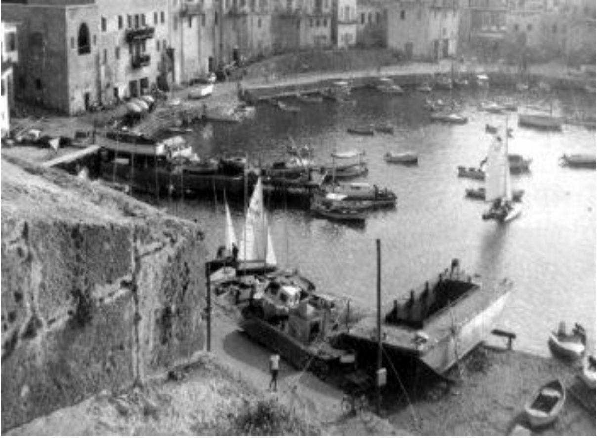
Ek 15: Girne Limanı'nın eski tarihli görünümü 416 .