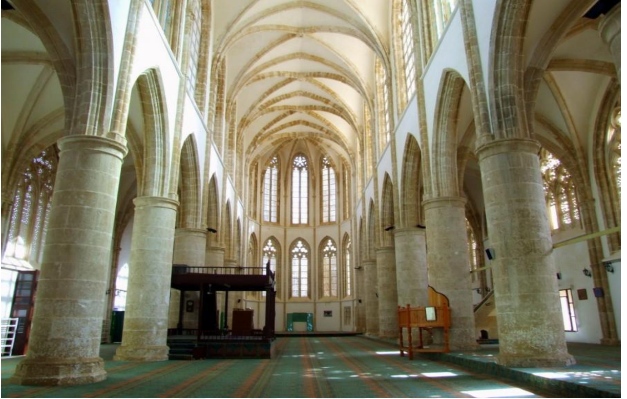
EK 8: Kıbrıs'taki St. Nicholas Katedralinin iç görüntüsü 406 .