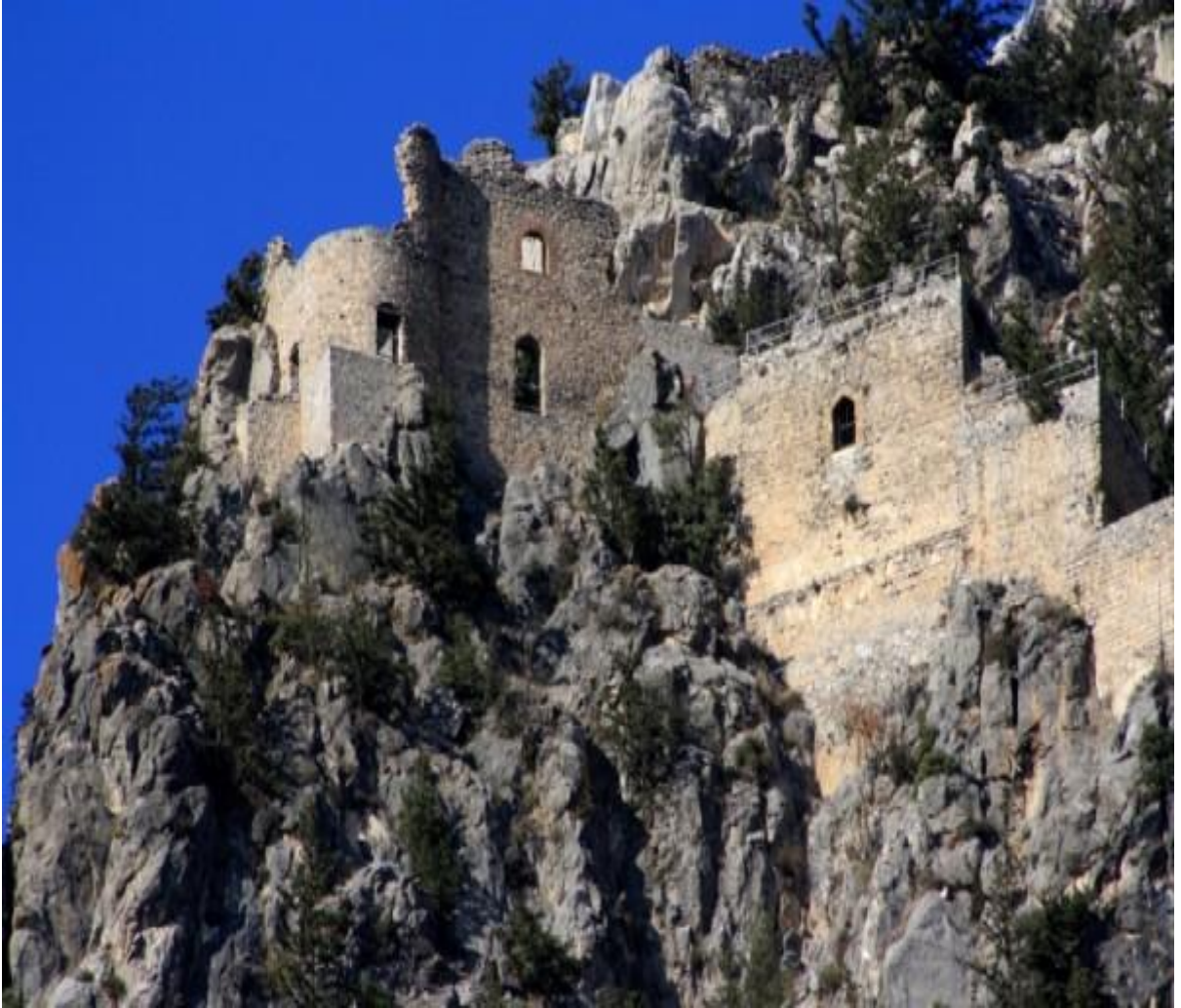
EK 9: Kıbrıs'taki Bufavento Kalesinin görüntüsü 407 .