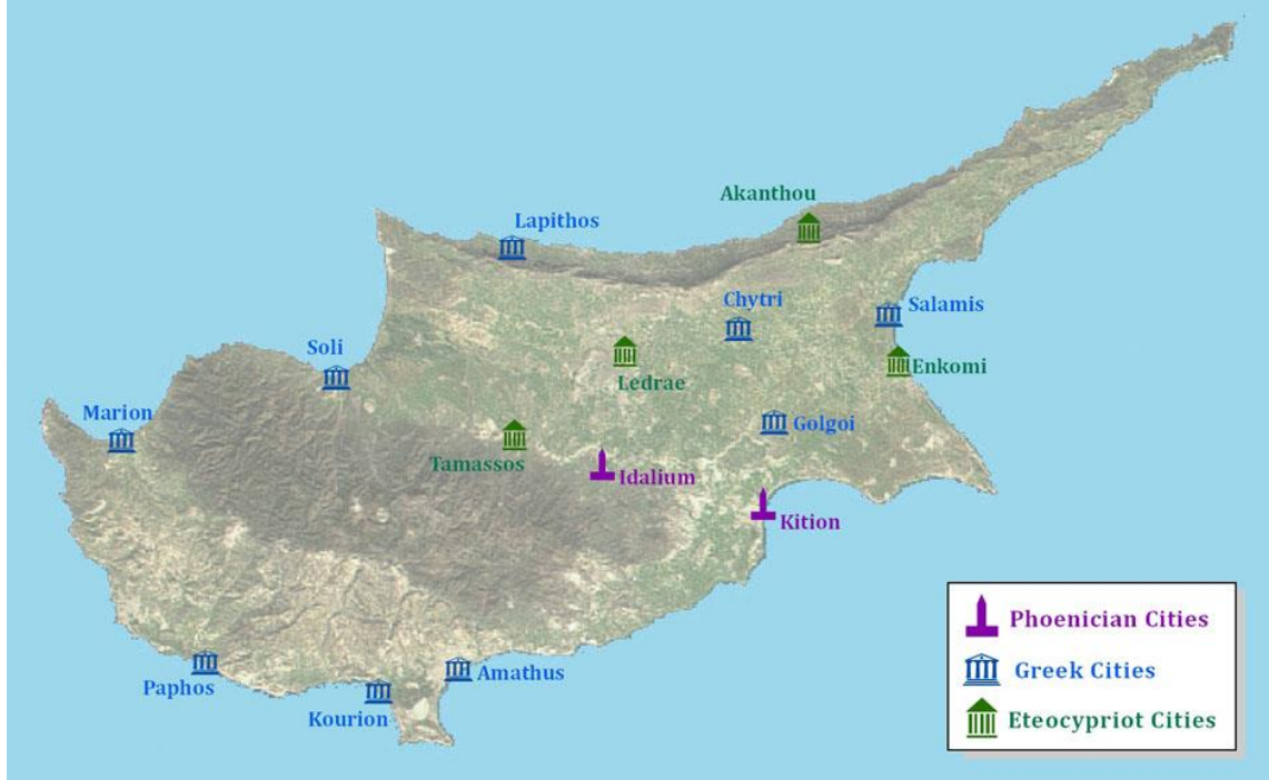
EK 1: Kıbrıs'ta kurulan kolonilerin haritası 395 .