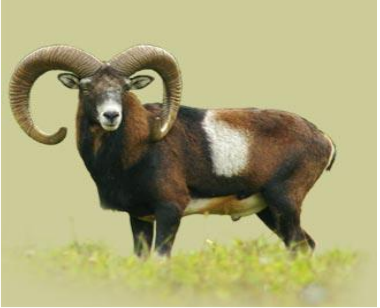
Ek 18: Kıbrıs'ta bulunan Muflon adı verilen koç türüdür 419 .