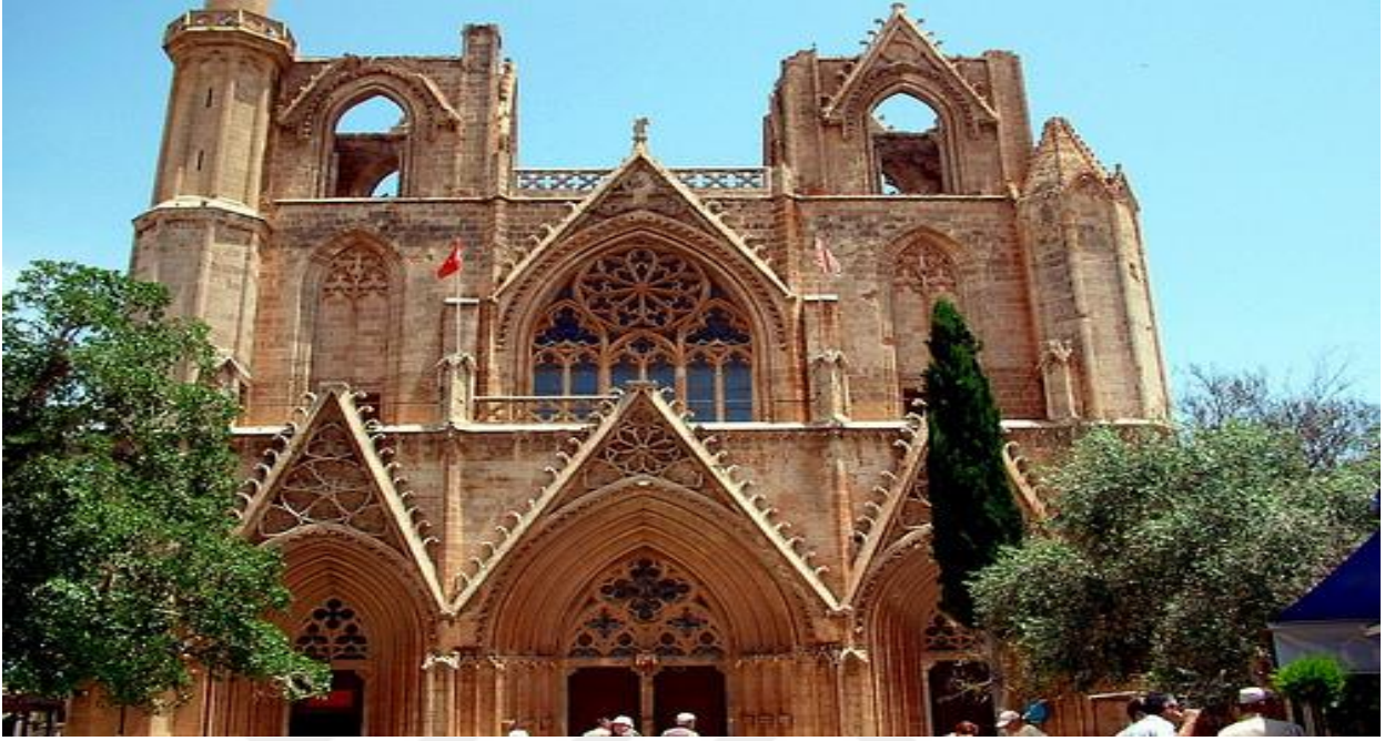
EK 7:Kıbrıs'taki St. Nicholas Katedrali genel görüntüsü 405 .