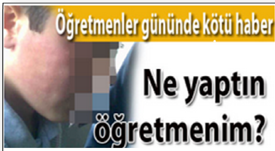
Resim 8. Öğrencisini Darp Eden Öğretmen

Resim 7’de görüldüğü gibi bir öğretmen 10 yaşındaki öğrencisini ıslık çalmaması konusunda uyarıp davranışın devam etmesi sonrası öğrencisine şiddet uygulamıştır. Habere göre aynı öğrenci daha önce de aynı öğretmen tarafından dövülmüştür. Resim 8’de öğretmen tarafından şiddet gören başka bir öğrencinin haberine yer verilmektedir.