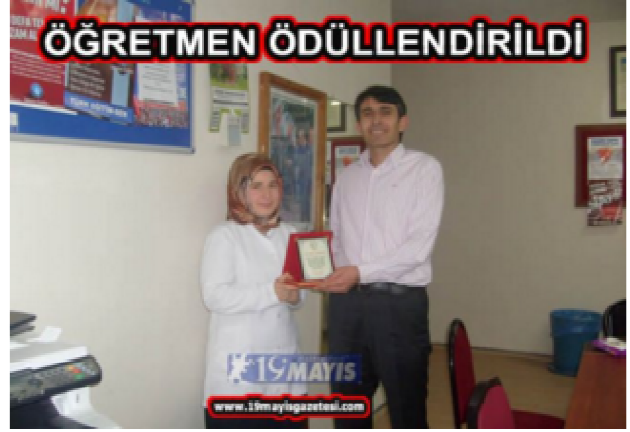
Resim 16. Ödüllendirilen Öğretmen

Öğretmenimizi tebrik eder başarılarının devamını dileriz" dedi.