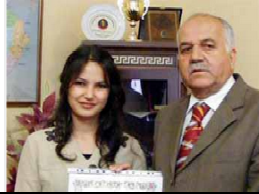
Resim 17. Teşekkür Belgesi İle Ödüllendirilen Öğretmenler