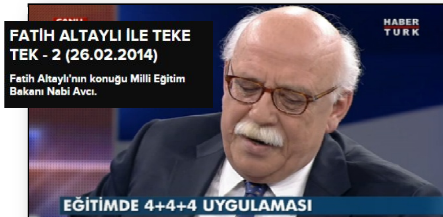
Resim 20. Teke Tek Programındaki Öğretmen İmajı

Resim 19'da görüldüğü gibi Sakarya'nın Söğütlü ilçesinde bir ilköğretim okulunda görev yapan ve 14 yaşındaki öğrencisini kaçıran öğretmen 2014 yılında tam 115 gün gündemde kalmıştır. Başbakan'ın bile bu konu hakkında talimat verdiği olay Türkiye'nin her kesimi tarafından yoğun ilgiyle takip edilmiştir. Resim 20'de Fatih Altaylı İle Teke Tek Programında yer alan öğretmen imajına yer verilmiştir.