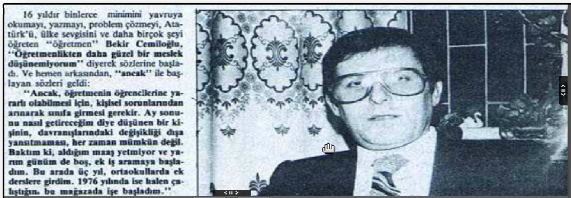
Resim 1. Ek İş Yapmak Zorunda Kalan Öğretmen