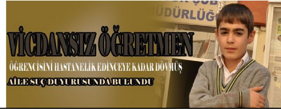
Resim 7. Öğrencisine Şiddet Uygulayan Öğretmen

Eğitim Haberi - 31 Ekim 2013 Perşembe - 09:26