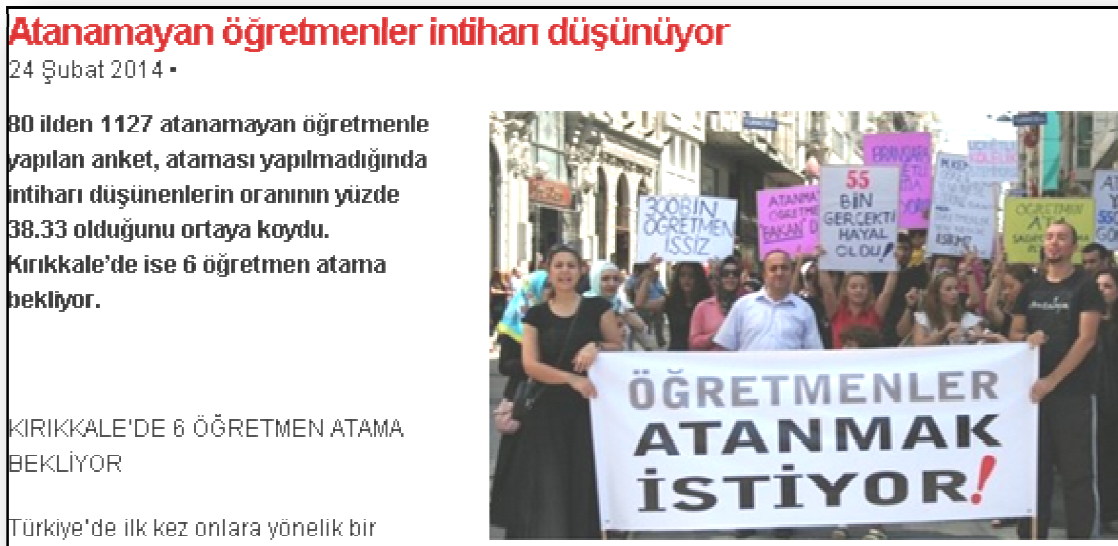
Resim 12. Atanamayan Öğretmenler

Atanamayan öğretmen. Toplumda öğretmen olmak isteyen kesim, basında atanamayan öğretmen başlığı altında geniş bir yer bulmaktadır. Kimi zaman cami önünde yem bekleyen güvercinlere benzetilen öğretmenler atanamadıklarında psikolojik sorunlar yaşamaktadırlar. Resim 12'de atanamayan öğretmenlerin intiharı düşünmesi ile ilgili bir habere yer verilmektedir.