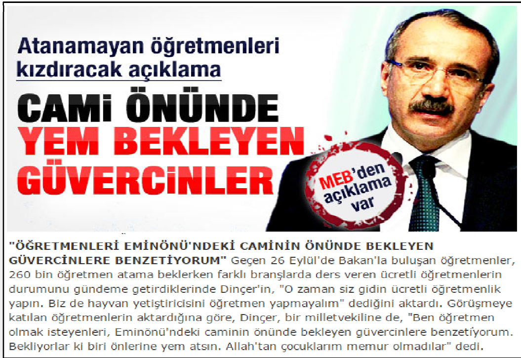
Resim 14. Cami Önünde Yem Bekleyen Güvercin Öğretmen