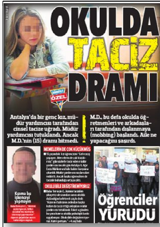
Resim 9. Taciz Eden Öğretmen

Taciz eden ve tacize uğrayan öğretmen. Öğretmenler zaman zaman basına taciz eden ve tacize uğrayan öğretmen olarak yansımaktadır. Öğrencilerin emanet edildiği öğrencilerin taciz edildiği, özveriyle çalışan öğretmenlerin tacize uğradığı haberleri öğretmenlik algısına zarar vermektedir. Resim 9’da bu konuyla ilgili bir habere yer verilmektedir.