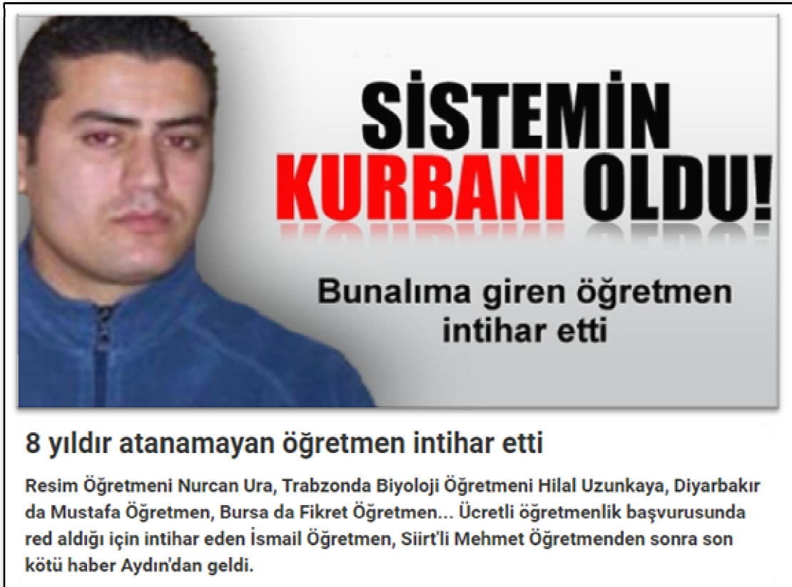
Resim 15. İntihar Eden Öğretmenler