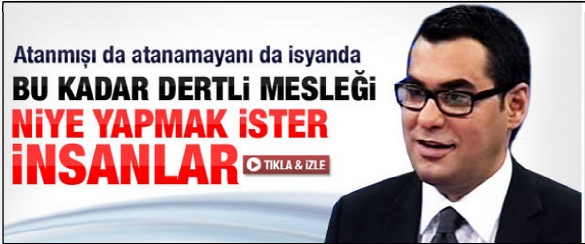
Resim 22. Enver Aysever İle Aykırı Sorular'da Öğretmen İmajı