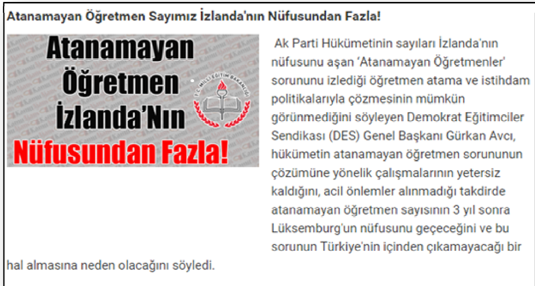
Resim 13. Atanamayan Öğretmen Sayısı

Resim 12’de görüldüğü gibi atanamayan öğretmenlere yönelik yapılan bir araştırma sonucu, öğretmenlerin %38’lik kısmı atanamayıp intiharı düşünmektedir. Resim 13 ise atanamayan öğretmenlerin İzlanda’nın nüfusundan fazla olduğu ile ilgilidir.