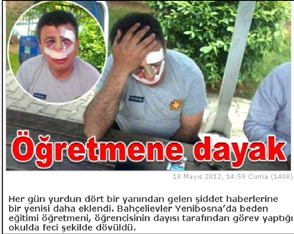
Resim 6. Veliden Şiddet Gören Öğretmen

Resim 6'da velisinden şiddet gören bir öğretmen haberine yer verilmektedir.