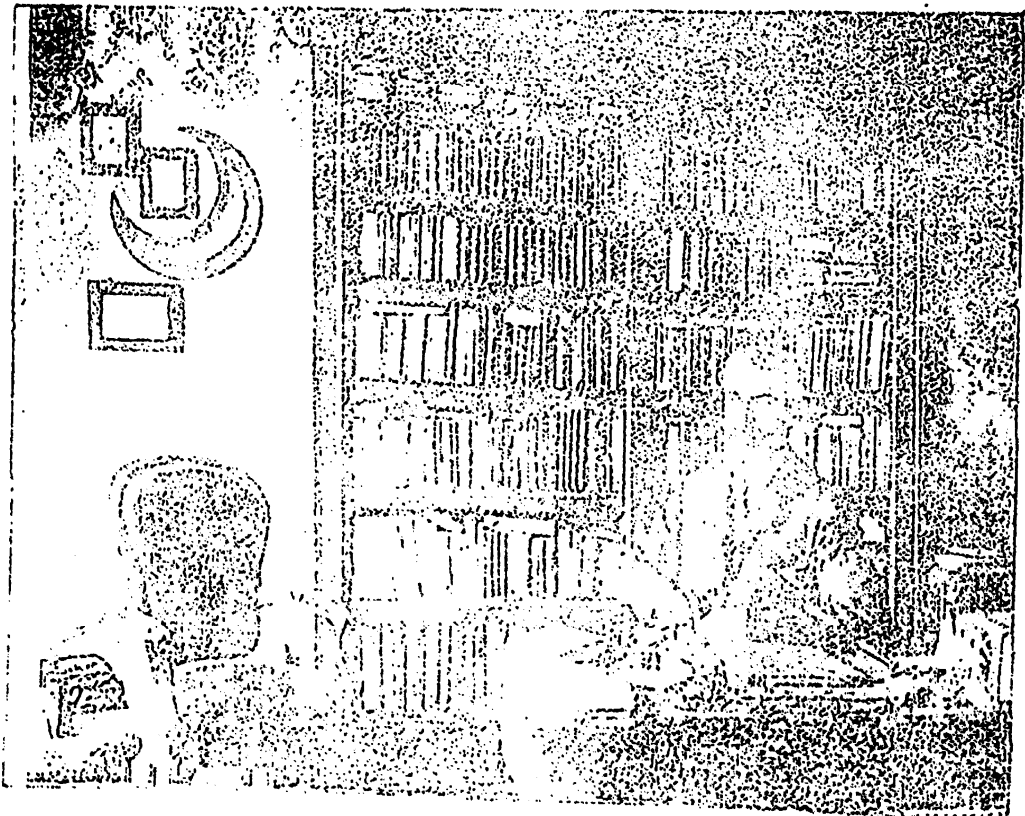
( اور اور بک جبرہ لئزلاندہ )

اوروپادہ علم و ہنرہ فکر بہ رونق ویرمش ماداملر ایچندہ دہ حیات زوجیہ ناند و نلمانی نمابہ ایضا ایدلر آزدور . چوغک تربیتہ سی نافسدور ، « اکثر بی تشکیل ایدن عوام طاقتک پاندہ علمدن ، فلسفہ دن بحث ایتمک جہاننی یوزہ اور ماقی ایچوز . عادت اولماشدر . اولردہ بزم کبارلرک اکثر بی کبی ہوائی ، سعلی شیلرہ دائر ادارہ اسان ایڈنی ایستلر ، الحق ، فنک قاریلری اولندکلمری زمان