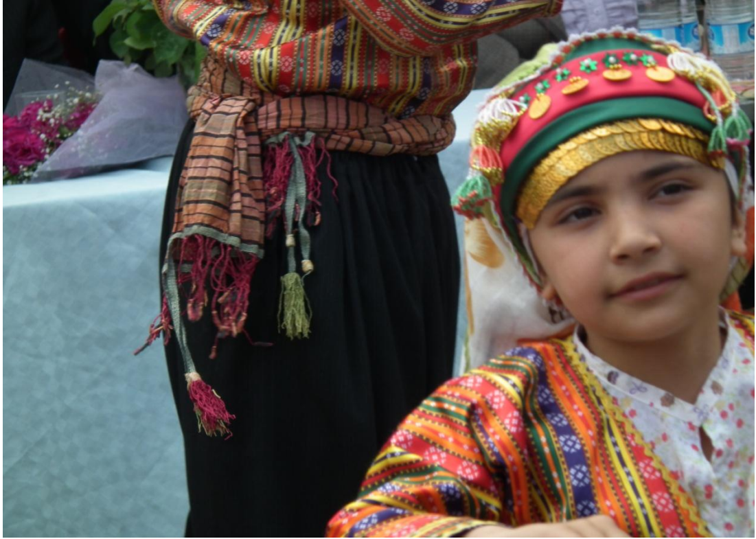
Foto-17: Kabaklar'da semah dönmeye hazırlanan küçük bir kız çocuğu.