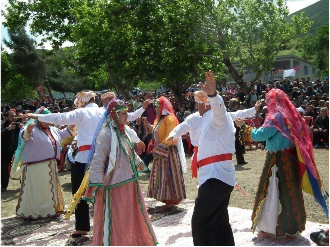
Foto-13: Kabaklar'da düzenlenen Tahtacı Şenliğinde dönülen bir semah.