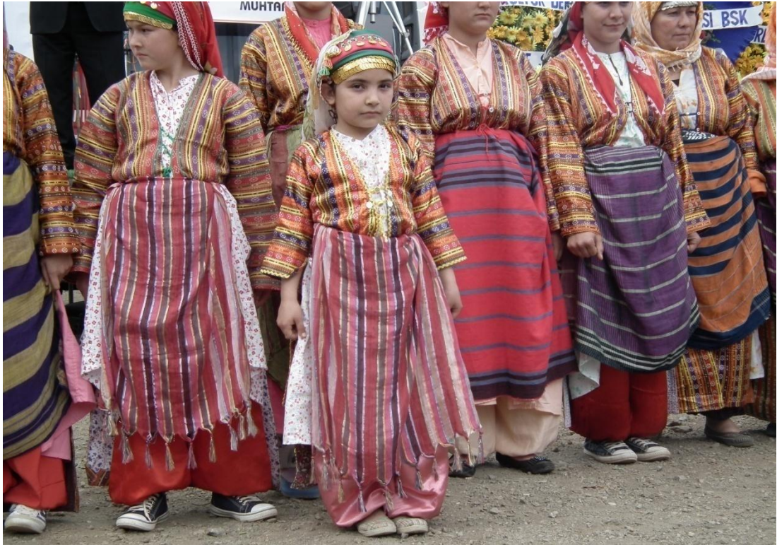
Foto-16: Önlerindeki peştamalı eşlerinden başka kimse çıkarmamakta ve öldüklerinde kefenlenirken bu peştamallara da sarılmaktadırlar.