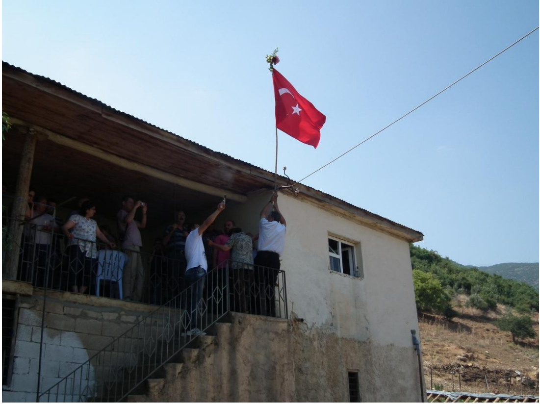
Foto-35: Kabaklar'da düğünlerin ilk günü, düğün evine bayrak dikilir.