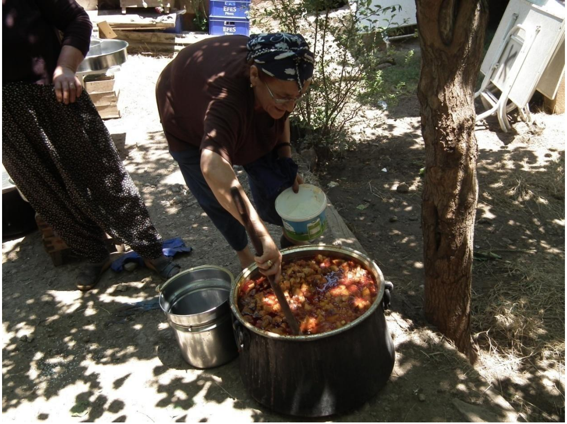
Foto-29: Köydeki törenlerde yemek pişiren kadınların usta ve yaşça büyük olanına “keyvani” denir.