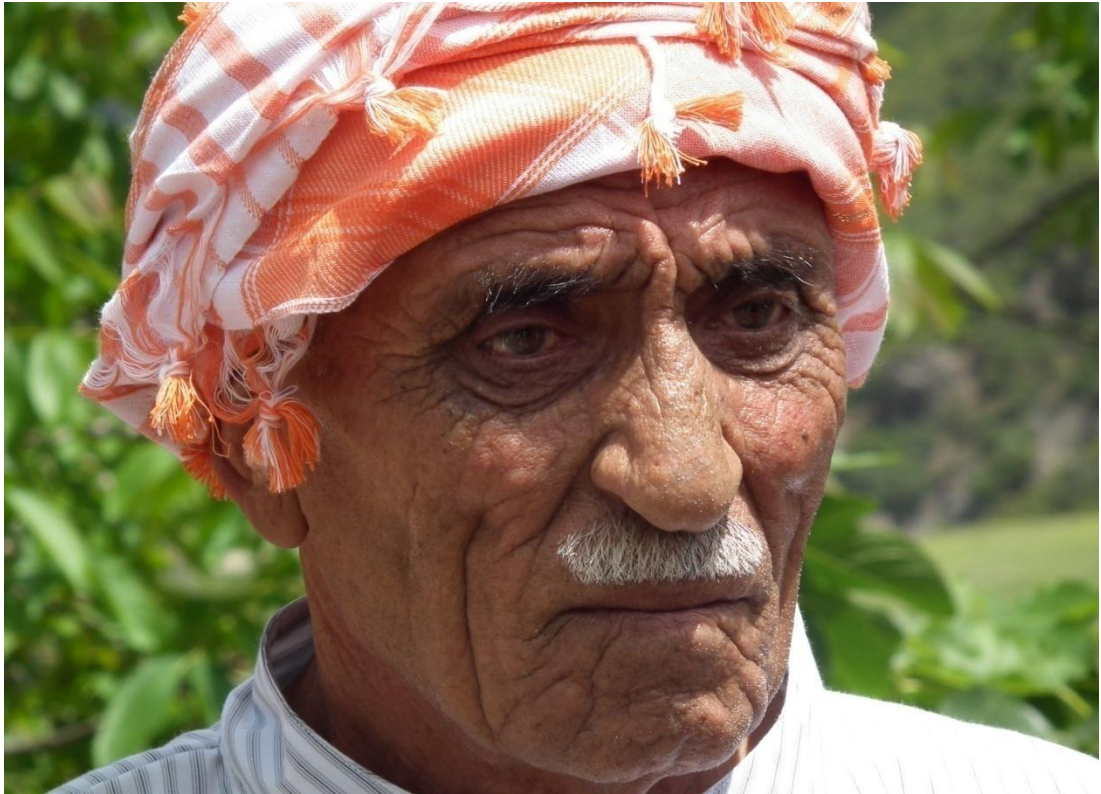
Foto-18: Tahtacı şenliğinde semah dönenlerden en yaşlısı(Mersin Tahtacılarından)