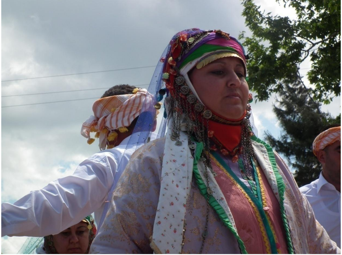
Foto-19: Geleneksel kıyafetleriyle semah dönen Türkmen Alevi Kadını.