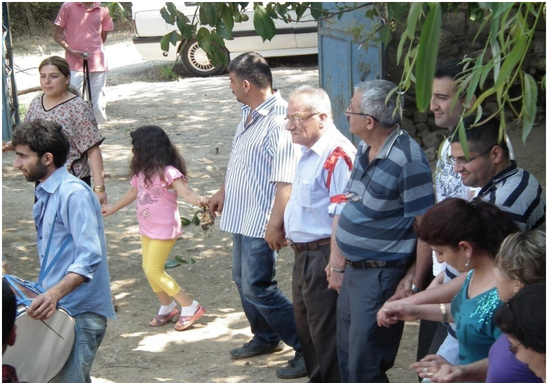
Foto-36: Düğünlerde kirvenin koluna kırmızı bir kurdele bağlanır.