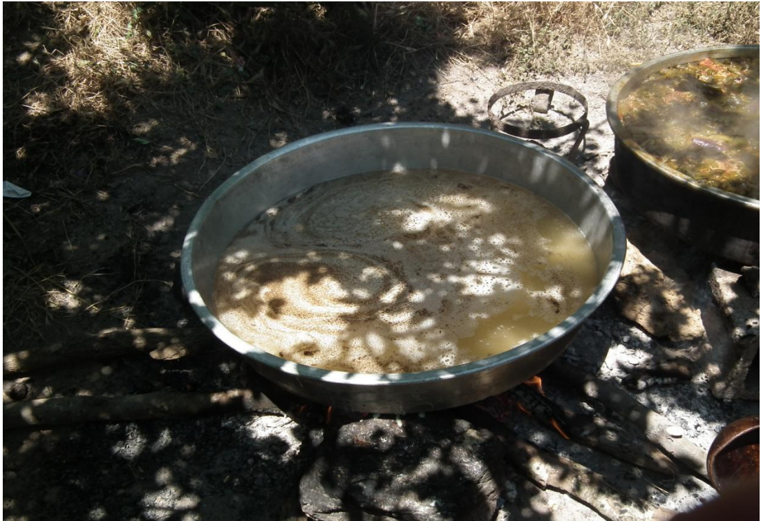
Foto-26: Halk mutfağına örnekler köyde pişen düğün yemekleri.(Pilav)