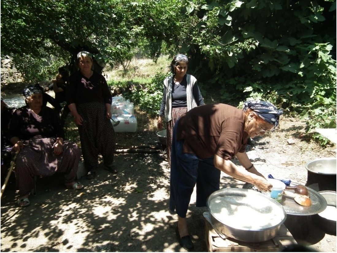
Foto-27: Köyde kadınların kalabalık yemeklerde dayanışmasına örnek.