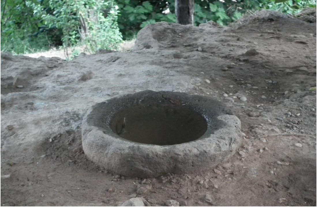
Foto-21: Kabaklar'da Oğundurma oruçlarıyla, köy işlerinde kullanılan bir dibek.