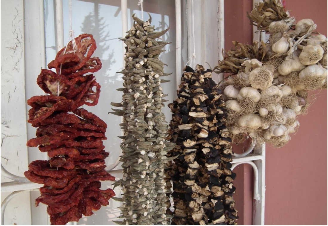
Foto-33: Yazın kurutulup, kışın tüketilen domates, bamya, patlıcan ve sarımsak.