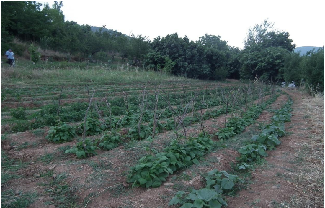
Foto-2: Kabaklar'ın en önemli geçim kaynaklarından biri olan bahçelerden bir görünüm.