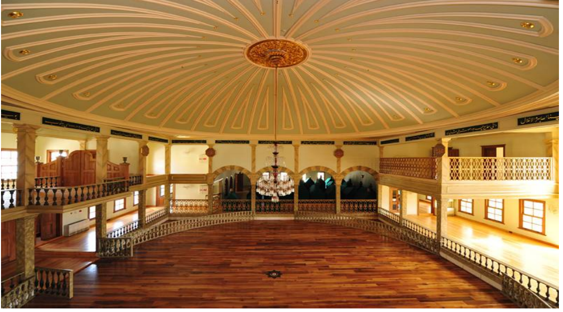
Resim 5. Yenikapı Mevlevihânesi Semahanesi ve Türbesi