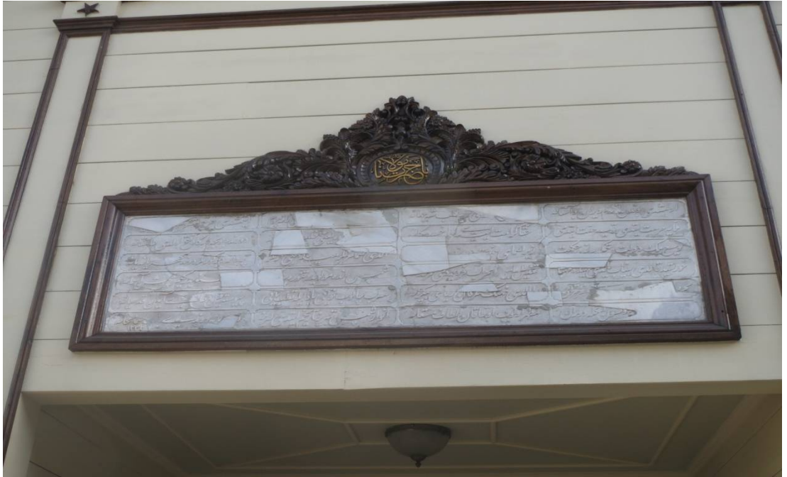
Resim 4. Yenikapı Mevlevîhânesi Semâhane Kitabesi