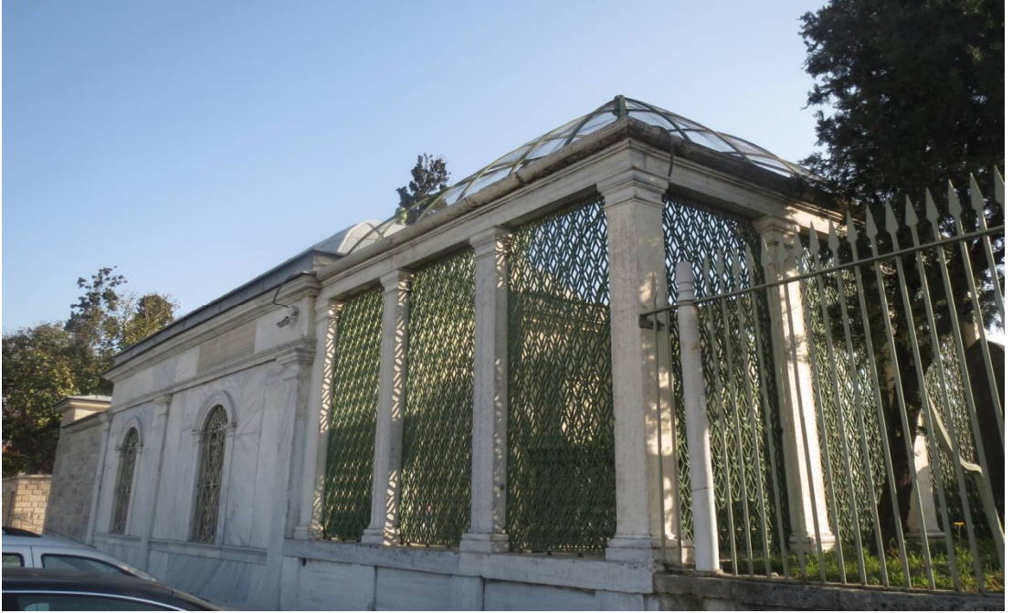
Resim 2. Yenikapı Mevlevihânesi Kütüphânesi ve Bânisi Abdurrahman Nafiz Paşa'nın Türbesi