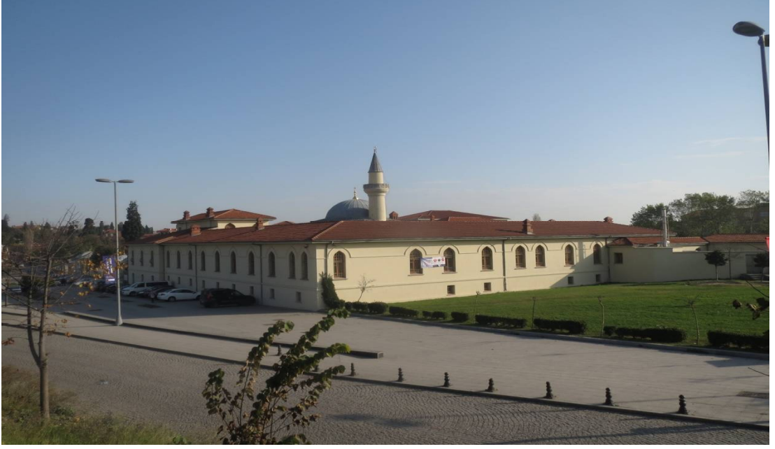
Resim 1. Yenikapı Mevlevihânesi'nin Kuzeyden Görünümü