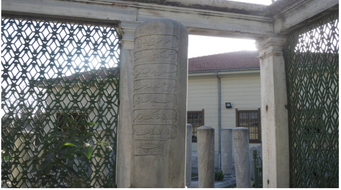
Resim 3. Abdurrahman Nâfiz Paşa'nın Mezar Taşı