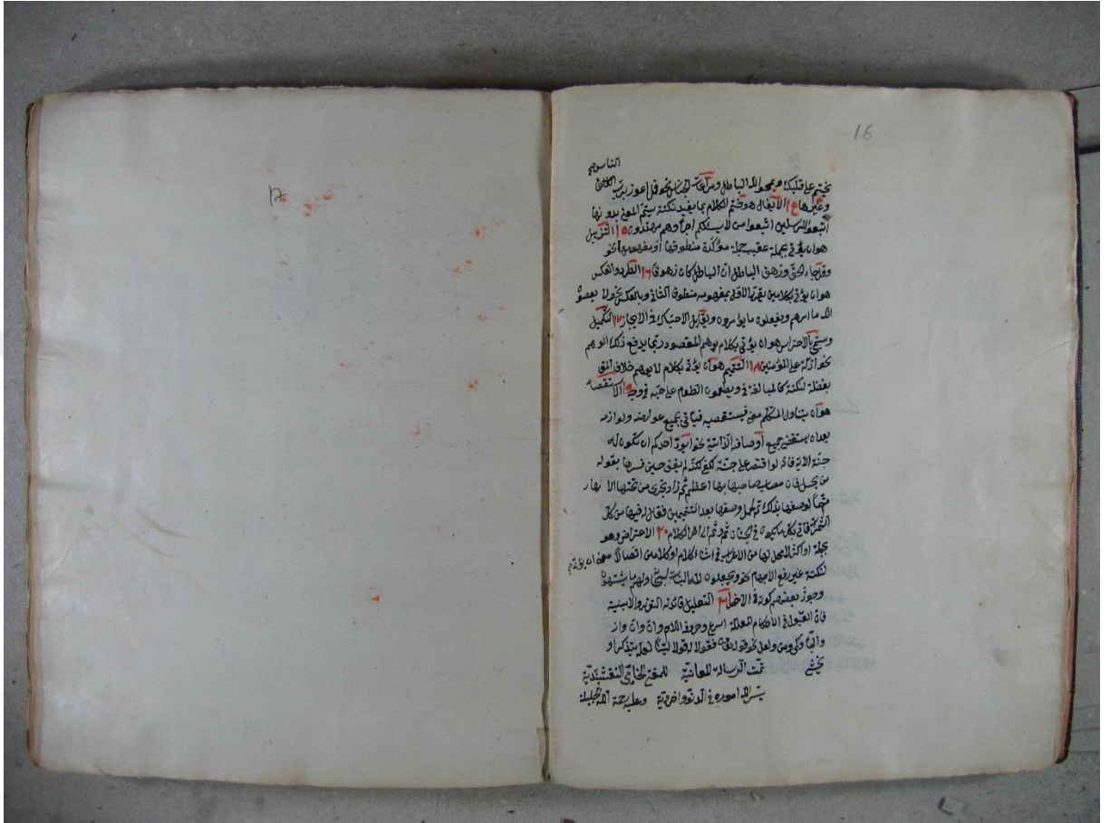
Konya İl Halk Kütüphanesi Cim Nüshası son sayfası