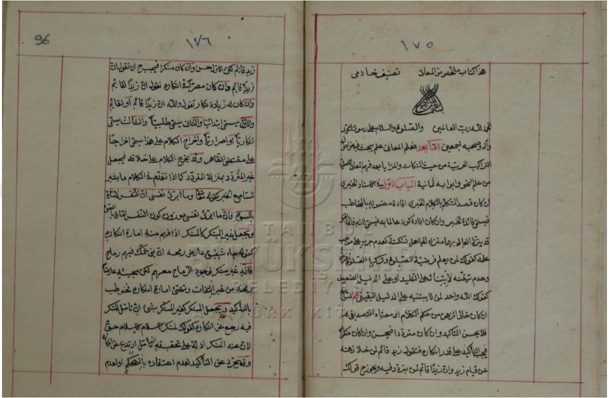
I.B.B. Bâ nüshasının ilk sayfası.