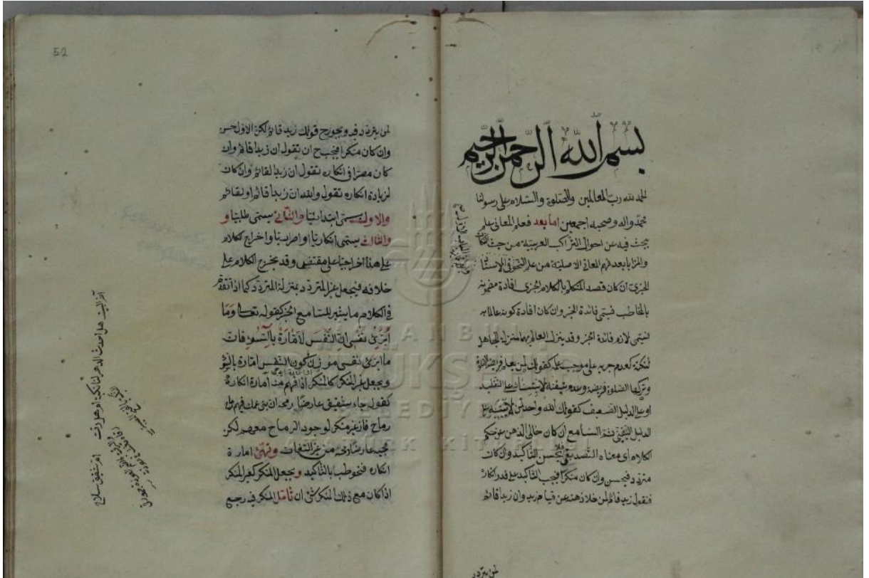
İ.B.B. Elif nüshasının ilk sayfası