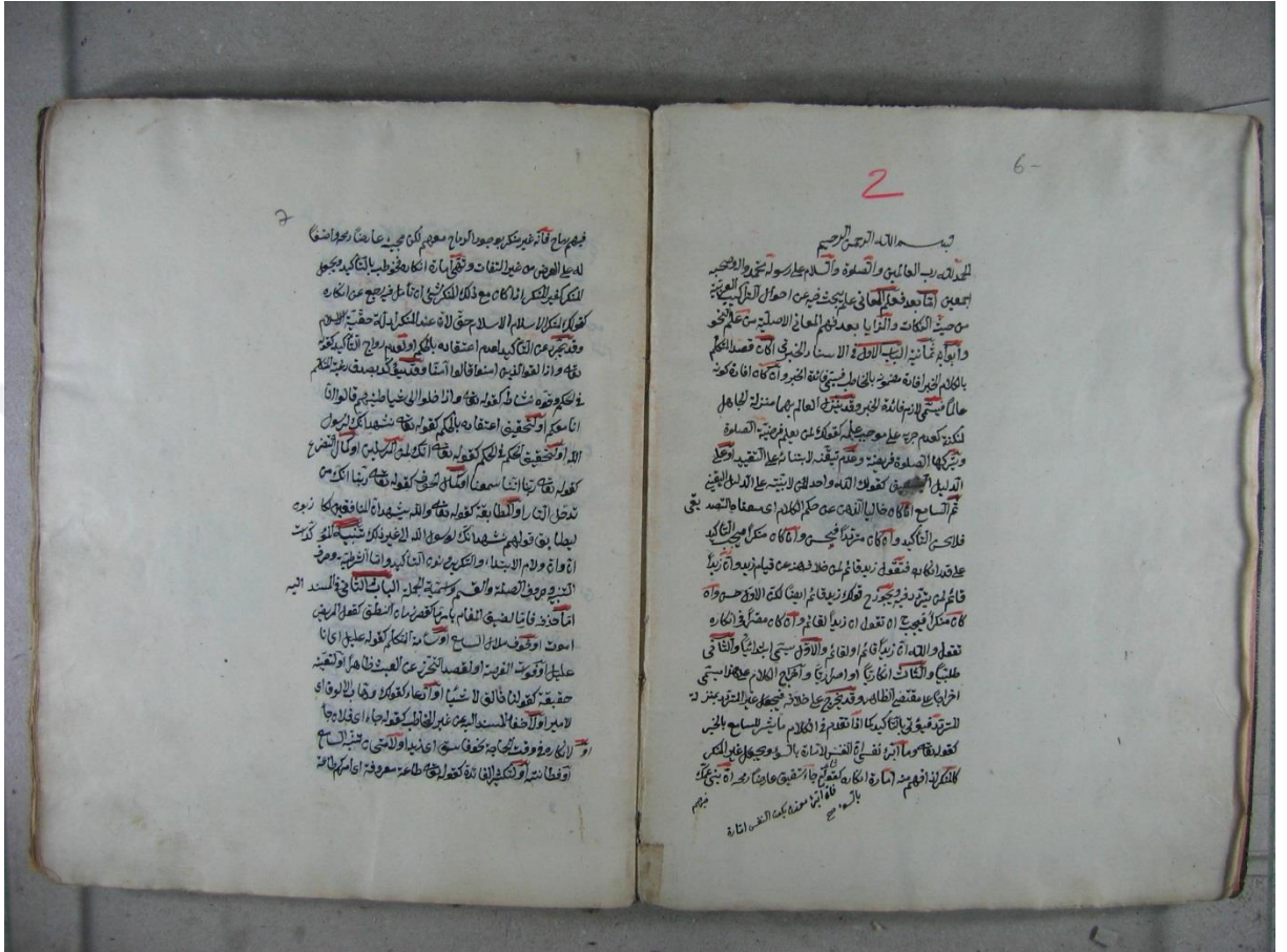
Konya İl Halk Kütüphanesi Cim Nüshası ilk sayfası