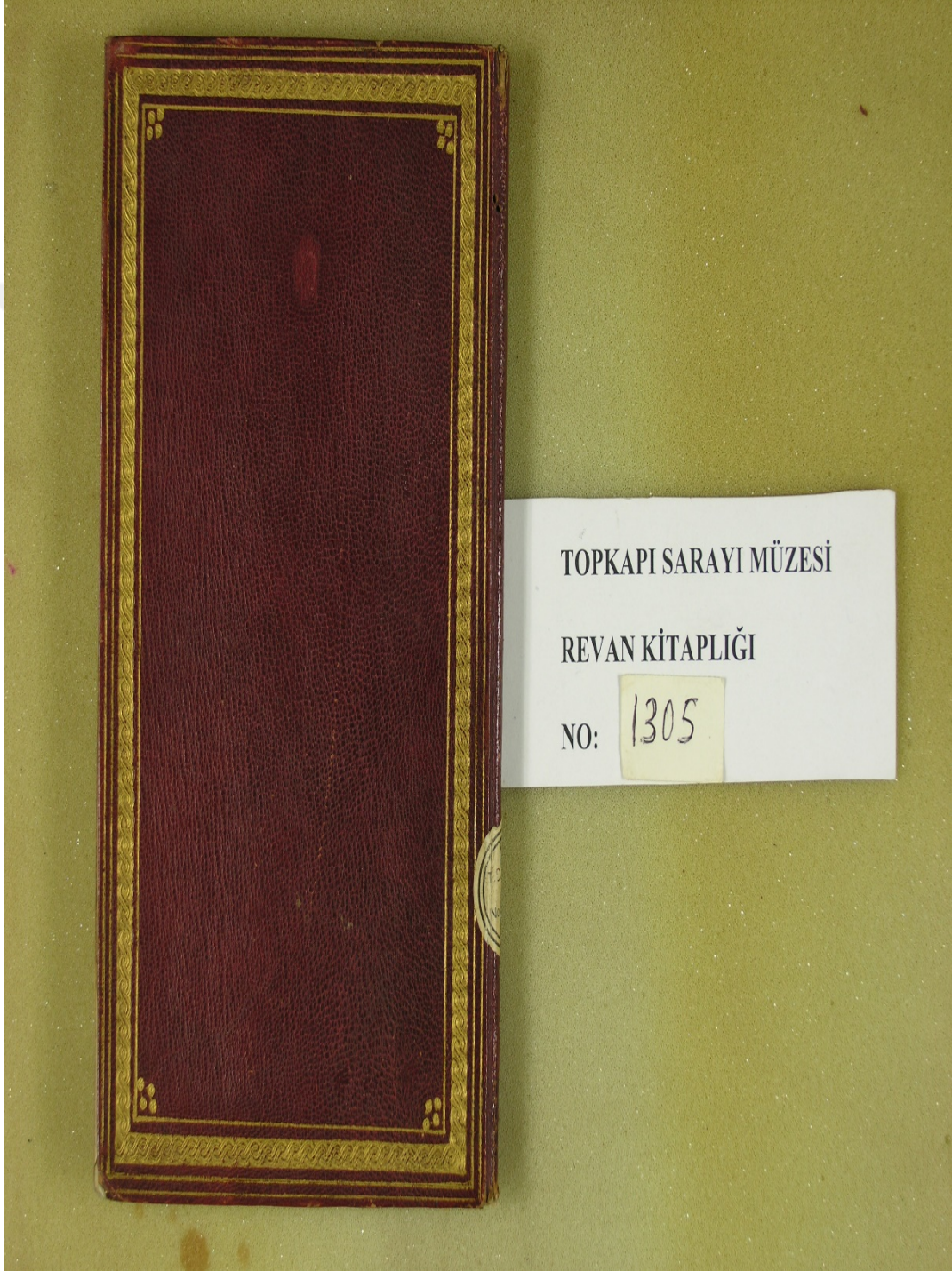
EK 1 TSM REVAN KİTAPLIĞI REVAN NÜSHASI KAPAĞI