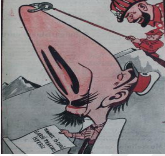
EK: 29 Karagöz, 20 Haziran 1946