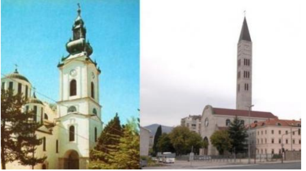
St Peter ve Paul Kiliseleri,Mostar. Yıkılmadan önce ve tekrar yapıldıktan sonra.