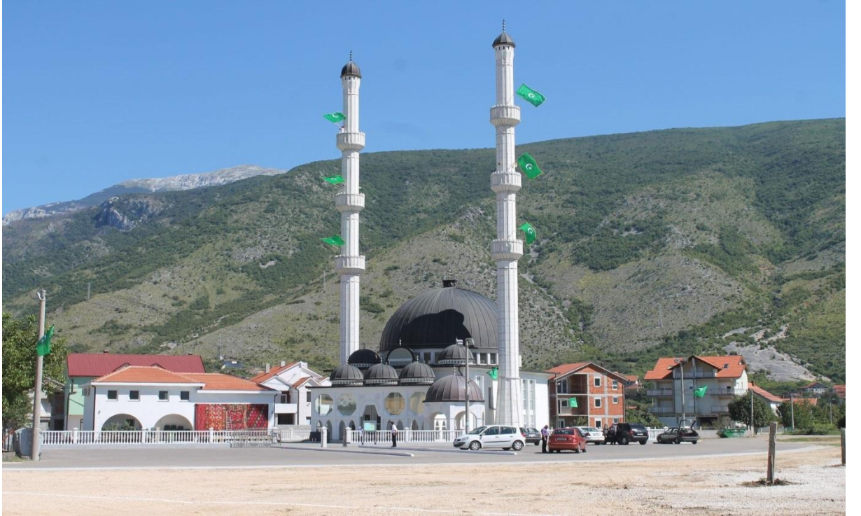
Mostar'ın Girişinde ki Yeni Yapılmış Cami