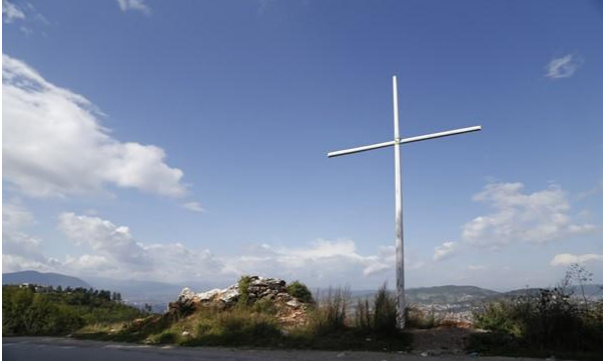
Saraybosna'nın üzerinde ki Zlatiste Tepesi'nde Sırp Milliyetçilerinin Diktiği Haç

Sırp Cumhuriyeti'nde devlet okullarında Piskoposların ve diğer din adamlarının mevcut Cumhurbaşkanı'nın hatta Sırbistan Başkanı Boris Tadic'in huzurunda çocukları kutsadığı durumlar mevcuttur. Aslında din ile siyaset arasında ki en güçlü gösterge kurulan Sırp Devleti'nin kilisede yemin etmesinde görülebilir 216 ancak devlet bazında dini binalara gittikçe daha fazla bütçe ayrılması durumu gözlenebilir bir durumdur. 217 Bu açıdan Berger'in laiklik tanımına geri dönersek: