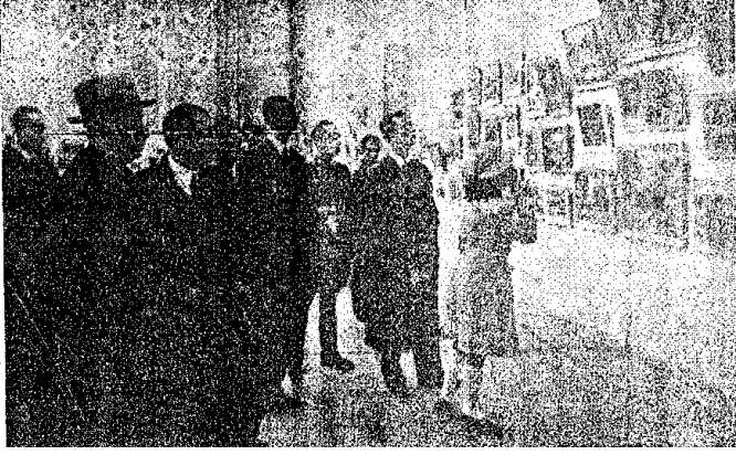
Güzel Sanatlar Akademisinde Sergi