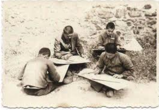
Köy Okulu Öğrencileri