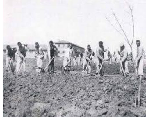
Köy Okulunda İş ve Ziraat Faaliyetleri