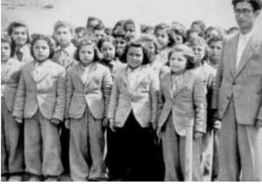
17 Nisan 1940'ta Köy Enstitülerinin Açılışı