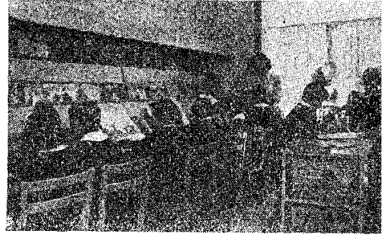
Bahçelievlerde Çocuk Kütüphanesi