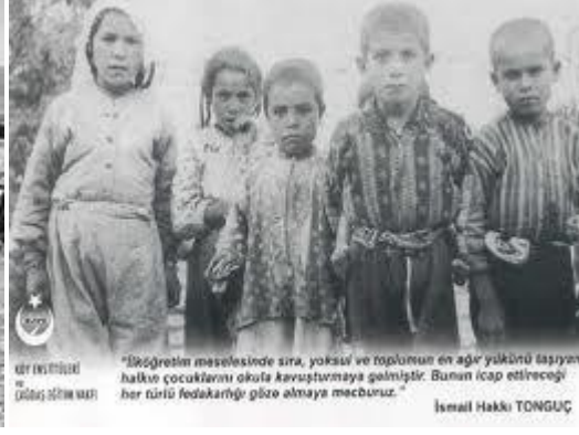
Okul Çağındaki Köy Çocukları