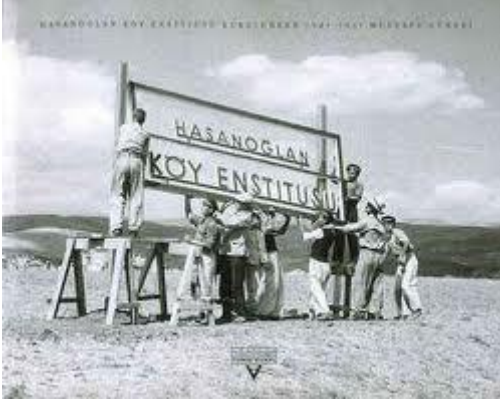
Hasanoğlan Köy Enstitüsü