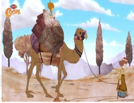
Resim 13: Maysa ve Bulut çizgi filminde kız çocukların kervan lideri olduğu sahneler

olduğunu çıkarmak mümkündür. Bu özelliklerinin yanı sıra kız çocukları pasif bireyler değildir. Liderlik yapabilirler. Zeynep karakterinin “İkişerli gruplara ayrılıp arayalım (İ,B9,7.45dk)” ifadesi, Elif karakterinin “Önce Gürgen ve Azmi’yi durdurmalıyız (İ,B17,5.55dk)” gibi ifadeleri bu iletinin çıkarılmasında etkili olmuştur. Diğer çizgi filmde kız ve erkek çocukların birlikte oyun oynadığı sahneler çok olmakla birlikte (İ,B9,07.00dk; İ,B17,03.05/03.33dk; B10,02.47dk), kız çocuklarının bu oyun grubuna liderlik ettiği sahneler de mevcuttur (B14,06.19dk). Buna ilaveten kız çocuklarının kervanbaşı olmak gibi görevleri de üstlendiği sahneler vardır (B1,03.50dk;B19,01.58dk).