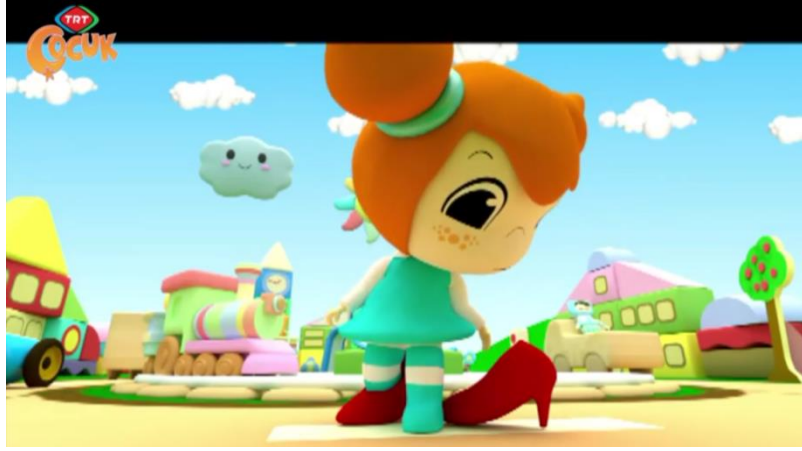
Resim 14 Canım Kardeşim çizgi filmde kız çocuklarının anneleri gibi olmak istediklerine dair bir sahne

Kız çocuklarının sanatla ilgili olduklarına dair sahneler de çizgi filmde mevcuttur. Zeynep ebru sanatı yaparken seyirci ile buluşur (İ,B19,3.15dk). Yine Zeynep karakterine piyano ile ilgili soru sorulması da (İ,B19,11.39) kız çocuklarının sanatla ilgili kimseler olduklarını gösterir niteliktedir. “ Keşke hep müzik dersi olsa (C,B9, 01.58dk)” ifadelerinden kız çocuklarının müziği sevdikleri çıkarılabilir. Zaman zaman bu kız çocuklarından “ Off bir sürü ödevim var! (C,B9 02.10)” gibi ifadeler duyulsa da “ Ödevleri seviyorum (C,B9, 03.52)” ifadelerini de duymak mümkündür. Diğer taraftan “ Öğretmenim çok akıllı ,her şeyi biliyor (C,B1103.16)” ifadeleri kız çocuklarının öğretmenlerini her şeyi bilen kişi olarak gördüklerini gösterebilir niteliktedir. Dolayısıyla kız çocukların okulu, okula gitmeyi de sevdikleri iletilerine ulaşılmıştır (M,B9,03.47; M,B16,01.05dk).