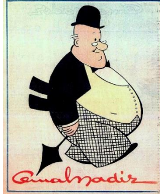
Resim 3: Cemal Nadir'in Amcabey Tiplemesi

Amcabey'in halk arasında çok sevilmesi onu halkın içinden gerçek bir kahraman olarak görülmesini sağlamıştır. Bu ünü sayesinde Amcabey, Nasrettin Hoca, Keloğlan, Hacivat-Karagöz gibi Türk mizahının önde gelen sembolleri arasında görülmüştür.