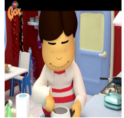
Resim 19-20-21 Canım Kardeşim çizgi filmde baba karakterinin çocukları ile ilgilendiği, mutfak işlerini yaptığı sahneler.

“Yatma vaktiniz gelmiş (C,B11,08.17)” gibi ifadelerle anne kadar sık olmasa da çocukları yönlendiren baba karakterinin çocuklarına öğütler verdiği görülmektedir. “Her zaman altın madalya alamazsın (C,B11, 3.14dk)” ifadesi bu durumu destekleyebilmektedir. 12.bölümde anne ve baba karakterinin çocuklarına coğrafya ile ilgili bilgiler verdiği sırada, babanın bir dünya maketi alıp çocuklarına