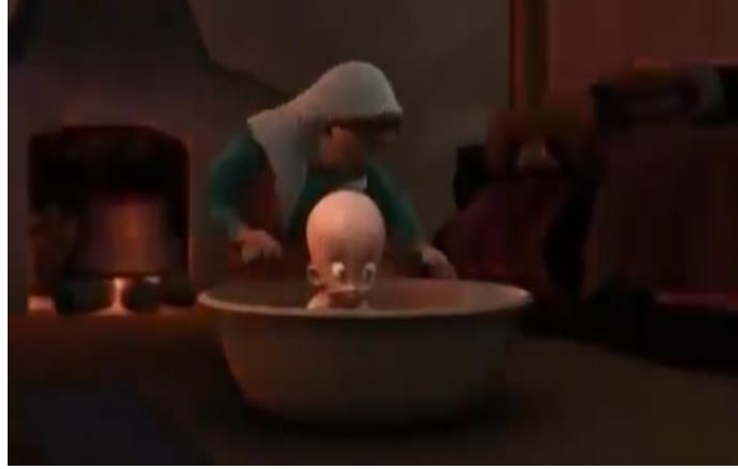
Resim 18 Keloğlan Masalları çizgi filminde anne karakterinin bebek bakımı yaptığı sahne

Çocukları bir şekilde yemek yiyemediği zamanlarda rahatsızlığını dile getirdiğini de (C,B4,06.26dk) ilgili bölümlerde görmek mümkündür. Keloğlan'ın kahvaltı yapmadan dışarı çıktığı bir gün annesi arkasından üzgün bir şekilde “ Kahvaltı etseydin bari (K,1B2,04.19dk)! ” diye seslendiği duyulur. Anne karakterinin çocukları öğün atladığında üzüleceği iletisine bu ifadeden de ulaşmak mümkündür. Müge karakterinin ödevlerinde zorlandığı bir bölümde anne tarafından söylenen “ Biraz çaba gösterirsen ödevlerini hızla yaparsın kızım. Ödevlerine dikkatini ver. En zor ödevi bile çok kolay yapacağına eminim (C,B9,03.29dk). ” ifadeleri annelerin çocuklarına güvendiği iletisine ulaşmakta etkili olmuştur.