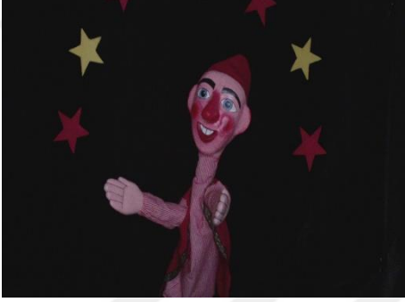
Resim 1: Komedi Kuklasının Ana Kahramanı Olarak Bilinen İbiş Kuklası

öncesi eğitimde kullanılan kukla oyunları eğlendirme işlevinin yanında eğitici görev de yerine getirmektedir. Kukla oyunları sayesinde çocukların yaratıcılıkları, sosyal, duygusal ve dil gelişimleri geliştirilebilmektedir. Gölge oyunu, taklide ve karşılıklı konuşmaya dayanır ve iki boyutlu tasvirlerle perdede oynatılmak suretiyle icra edilir. Bu oyun deriden kesilen ve tasvir edilen birtakım şekillerin (insan, hayvan, bitki, eşya vb.) arkadan ışıklandırılmış beyaz bir perde üzerine yansıtılması şeklindedir (Şimşek, 2014).