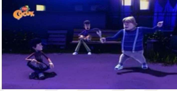
Resim 17: Rafadan Tayfa çizgi filminde çocukların tamir işlerini yaptıkları bir sahne.

dikkate alındığında erkek çocukların taşıma işleri yaptıkları (R,B2,08.12-10.21dk) ve etraftaki bireylerin erkek çocuklardan tamir işlerini yapabilmelerini bekledikleri (R,B1,4.20dk) görülmektedir.