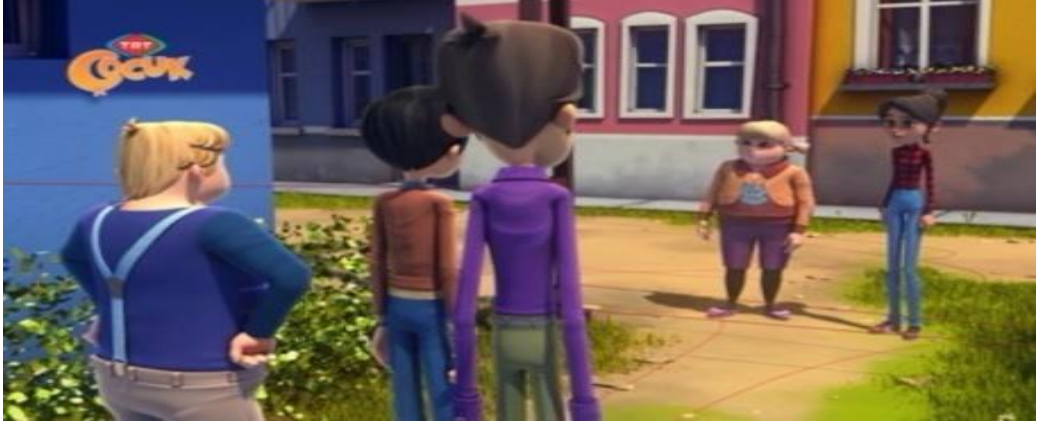
Resim 12: Rafadan Tayfa çizgi filminde ip sahnesi

Bir bölümde Yumak adlı köpek bulduğu bir ipi tüm mahalleye dolaştırmıştır. Erkek çocuklar ipin neden dolaştığını merak ederler ve bu işi çözmek için ipi takip etmeye başlarlar. Bu sırada bu iplerle kendilerine oyun kurmuş olan kız çocukları, ki kız çocuklarının oyun oynarken görüldüğü nadir sahnelerdendir, karşılarına çıkar. Sebebi hakkında fikirleri sorulduğunda Sevim “ Biz sadece buradan geçiyorduk. Tam ip atlamalıktı ” diye cevap verirken Hale “ Biz de yapacak bir şey arıyorduk (B9,6.19-6.26dk).” diyerek ekler. Bunun üzerine Kamil “ İşin aslını bir tek biz merak etmişiz (B9,10.40dk)” der. Erkek çocuklar merak duygusuyla yola çıkmış gösterilirken kız çocuklar tam tersi bir durumda izleyiciye verilmiştir. Kız çocuklarının erkeklere göre daha dikkatsiz ve meraksız olduğu mesajı izleyiciye aktarılmıştır.