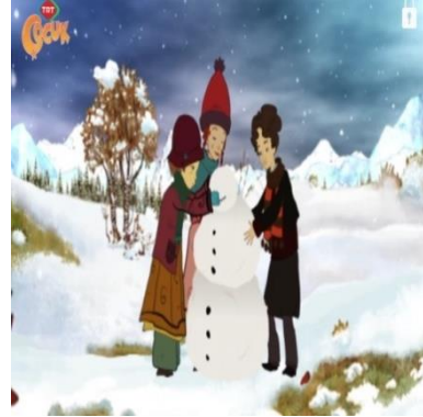
Resim 15-16 Çizgi filmlerde kız çocukların erkek çocuklar ile birlikte oyun oynadıkları sahneler

Kız çocuklarının tüm bu durumlara ilave olarak yardımlaşan bireyler oldukları (K1B3,04.34; 1B4,02.43dk), gösterişli eşyalara erkek çocuklara oranla daha fazla dikkat ettikleri (K,3B5,02.43dk) de görülür.