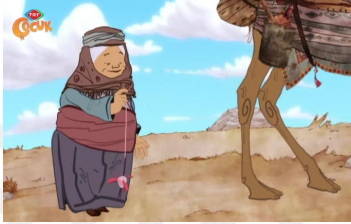
Resim 23: Maysa ve Bulut Çizgi Filminde Yaşlı Karakterlerin İlgilendikleri İşleri Gösteren Sahnelerden Biri

şekilde toplumdan soyut bir birey olmadığını ip eğirmek gibi işlerle toplumda var olduğunu da söylemek mümkündür (M,B19,05.24dk). Nine karakteri yapılan işlerde yönlendirir olarak da görev almaktadır (M,B19,09.18dk). etrafındaki büyük ya da çocukları da uyardıkları görülmektedir (M,B5,06.11;M,B6,05.20dk; M,B7,08.30dk).