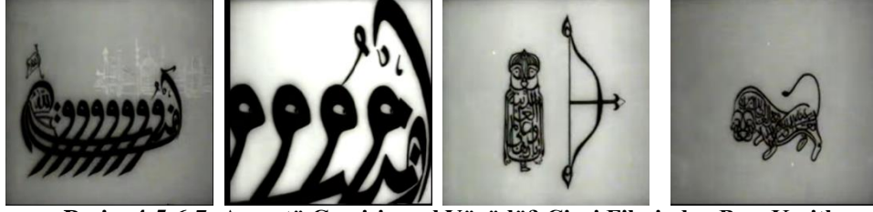
Resim 4-5-6-7: Amentü Gemisi nasıl Yürüdü? Çizgi Filminden Bazı Kesitler.