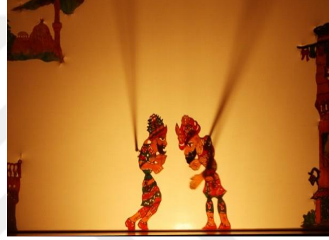
Resim 2: Karagöz Oyunununun Bir Sahne.

Ülkemizde animasyon, çizgi film çalışmalarının televizyon programlarıyla başladığını söylemek mümkündür. Türkiye’de çizgi film yapıtlarının müelliflerinin başlangıçta karikatürcüler olduğu görülmektedir. Bu dönemde yabancılardan etkilenen karikatürcüler kâğıt üzerinde durağan biçimde yarattıkları tiplerin beyaz perdede canlandırılması yolunda çalışmalar yapmışlardır. Bunların başında da Karikatürist Cemal Nadir gelmektedir. Walt Disney’in çizgi filmlerinden etkilenen Karikatürist Nadir, 1928 yılında yarattığı 30 “Amcabey” tiplemesini kullanarak 1932 yılında “Amcabey Plajda” adını verdiği bir çizgi film denemesinde bulunmuştur (Arslan, 2016). Sadece birkaç dakika sürecek bir film için 600 kadar resim çizmeye çalışır. Böyle bir çalışmanın tek başına yapılamayacağını, bunun takım çalışması olduğunu anlar ve vazgeçer. Dönemin teknik alanda geride olması ve eksikliklerden dolayı da proje denemeden ileri gidememiştir.