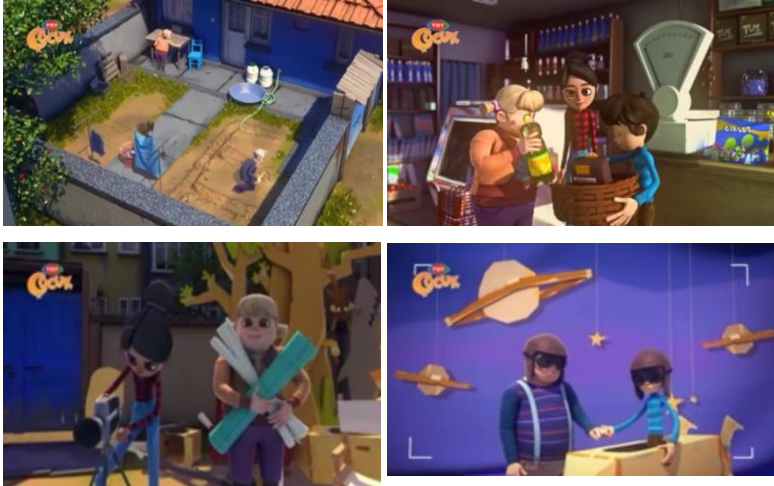
Resim 8-9-10-11: Çizgi filmlerde kız çocukların temizlik işleri ile uğraştıkları ve erkek çocuklara göre arka planda oldukları sahneler

Rüstem Ağabey'in köfte tarifini kaybettiği ve tarifi tutturmak için denemeler yaptığı bir bölümde köftenin lezzeti konusunda sadece erkek çocukların fikrini almaktadır. Kız çocuklarının yüklenen yemek pişirme misyonuna rağmen ortamda bulunmadıkları görülür (R,B19,08.40-13.47dk). Bu durumda kız çocuklarının fikrine ihtiyaç duyulmadığını söylemek mümkündür.