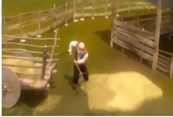
Resim 22: Keloğlan Masalları çizgi filminde baba karakterinin sorumlu olduğu işler ile ilgili sahne

Tüm bu özelliklerin yanı sıra babanın eşinin emeğine saygı duyan, yemek yedikten sonra “ Ellerine sağlık karıcığım (C,B11,00.55dk). ” şeklinde ifadeler söyleyen bir karakter özelliği gösterdiği görülür. Baba karakterinin eşini sevdiği ve ona saygı duyduğunu görmek mümkündür(K,1B1,06.21-06.36/06.59dk). Yine baba karakterinin ağır işlerden biri olan bahçe ya da saman atma işleri ile ilgilendiği de izleyici ile buluşur (K,1B1,08.42dk). Ayrıca baba karakterinin vatan sevgisine sahip olduğu da izleyici tarafından görülebilmektedir (C,B12,03.34dk).