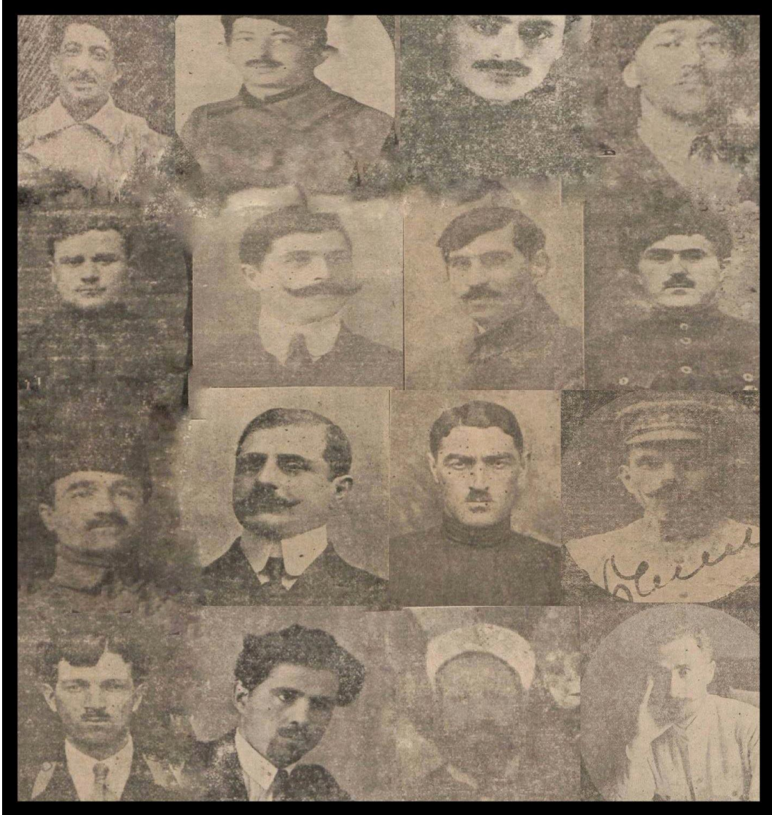
EK-16) Acaristan Kızıl Meclisi Merkezi İcra Komitesi Üyeleri ve Diğer Yoldaşlar