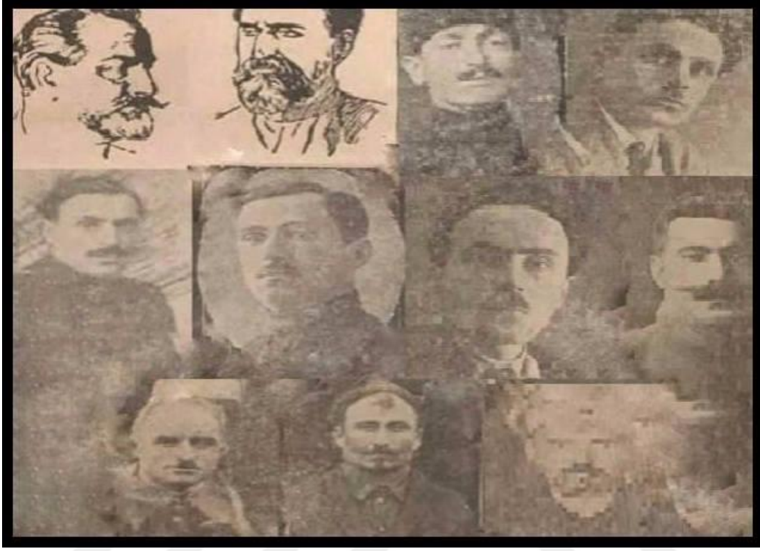
EK-17) Acaristan Kızıl Meclisi Merkezi İcra Komitesi Üyeleri ve Diğer Yoldaşlar