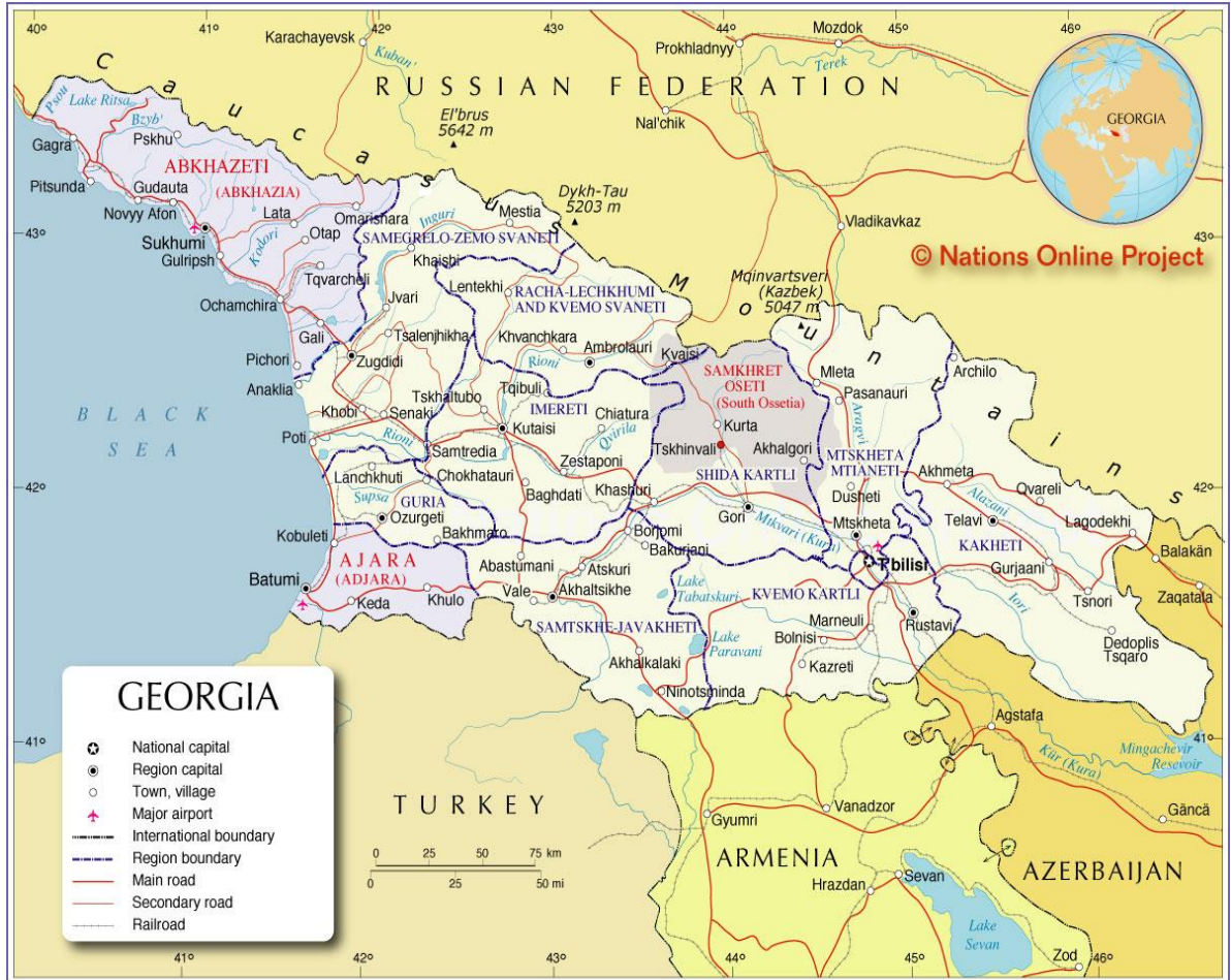
EK-14) Gürcistan Haritası

( http://www.nationsonline.org/oneworld/map/georgia_map2.htm )