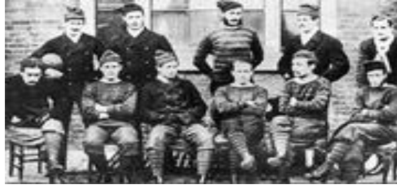
Şekil 4. 1872 yılındaki ilk FA Cupfinalinde oynayan Royal Engineers kadrosu. 34

C. W. Alcock, İngiliz kulüplerinin katılımıyla gerçekleştirilen ilk futbol müsabakası olan FA Cup'u kurdu. Uluslararası olarak düzenlenen ilk yarışma ise 1872 yılında Glasgow kentinde İskoçya ile İngiltere arasında gerçekleştirildi ve müsabaka golsüz beraberlik ile sonuçlandı. 34