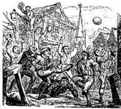
Şekil 2. Londra'da oynanan güruh futbolunu gösteren 1721 tarihli bir çizim. 21

9.yüzyılda Nennius'un Historia Brittonum adlı eserinde , Orta Çağ Avrupa'sında top ile alakalı bir oyunun oynandığına dair ifadeler yer almaktadır. Ayrıca Galler’de çocukların top oynadığından söz edilmiştir. 21