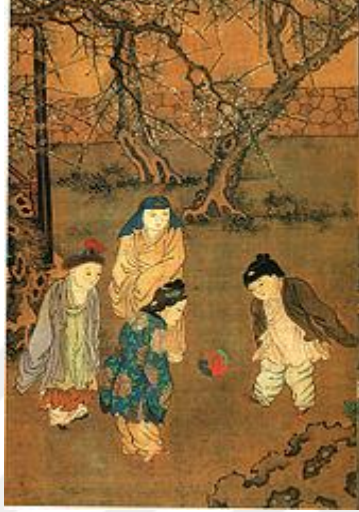
Şekil 1. Song Hanedanı döneminde cuju adlı oyunu oynayan çocukları gösteren bir çizim. 17

Milattan önceki zamanlarda futbola benzer oyunlarının kökeni dayandığı bilinmektedir. Günümüzde ise 1863 yılında İngiltere’de kurulan Futbol Birliğinin hazırladığı kurallar ile oluşturulmuştur. 15,16