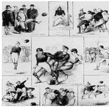
Şekil 3. 30 Kasım 1872'de, İngiltere ile İskoçya arasında gerçekleştirilen uluslararası ilk futbol maçına ait çizimler. 29