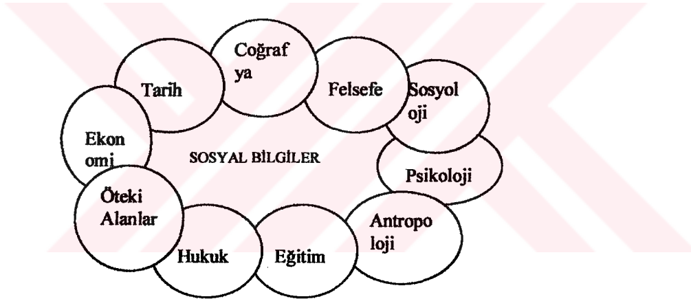
Şekil 1.1. Sosyal Bilgilerin Kapsamı

Sosyal Bilimlerin büyük ölçüde ortak ve birbirlerini tamamlayıcı yönleri sahip bulunması, disiplinler arası yaklaşımı desteklemekte, ayrıca bunu gerekli kılmaktadır. Sosyal Bilgiler dersi de, böyle bir yaklaşıma olanak tanırken temel kültür öğelerini, birçok alandaki çalışmalardan sağlanan bulgulardan, disiplinler arası bir yaklaşımla alıp yoğurmakta; ilköğretim düzeyine ve kendi yapısına, kendi doğasına uygun bir anlayışla varlığını bütünleştiren bir ders olarak programdaki yerini almaktadır. Sosyal Bilimlerin kapsadığı alanlar aşağıdaki şekil 1'de görülmektedir.