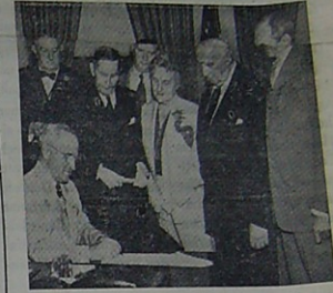
Başkan Harry S. Truman bir kanun tasarısını imzalarırken

Vaşington, 1 a.a. (Afp) İki silâhli adam bugün başkan Truman'ın ikamet ettiği "Blair House" a zorla girmeye teşebbüs etmiş ve muhafız polisleri tarafından öldürülmüşlerdir.