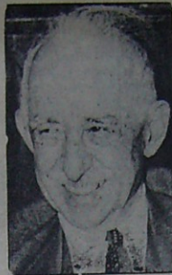
C.H.P. Genel Başkanı İSMET İNÖNÜ

Sabahın beşinden itibaren Demokrat Parti önünde toplanan yakaları rozetli 500 partili ellerinde İnönü'nün aleyhinde yazılı dövizlerle İnönü'nün ikamet ettiği evin önünde nümayişe başlamışlar ve avaz avaz bağırışlardır. Nümayişçiler rastladıkları bütün gazetecileri dövmüşler bu arada Bekir Çiftçinin fotoğraf makinesini kırmaslardır.