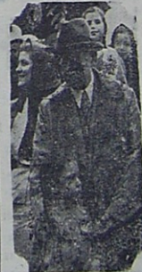
C.H.P. Genel Başkanı İsmet İnönü

kip başvekil kabinesinin topyekün istifa ettiğini bildirmiştir. Söylenelelere göre grupta adı geçen bazı vekiller hakkında Meclis tahkikatı açılacaktır.