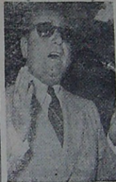
Başvekilimiz A. Menderes

Muhtekirlere karşı mücadelenin şiddetlendirilmesi, büyük bir memnuniyetle karşılanmış bulunuyor