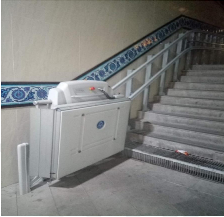
Fotoğraf 3.5: Kütahya Merkezde Fatih Sultan Mehmet Bulvarında Bulunan Altgeçit

Alt ve üst geçitlerin yürüme engelli bireylerin kolayca kullanımı için planlanarak yapılması gerekli görülmektedir. Engelli bireyler, Kütahya Belediye binası ile Kütahya Saat Kulesi arasında kalan bu alt geçitte (Fotoğraf 5) uygulamaya konulan asansör hizmetinin çok faydalı olduğunu düşünmektedir. Alt ve üst geçitlerde bu tarz asansörlerin yer almasının engelli bireylerin ulaşımını kolaylaştıracağı bilgisi aktarılmaktadır.